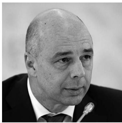
НА ФОТО: АНТОН СИЛУАНОВ

При этом он поддержал модель, которая, по сути, представляет одно из звеньев механизма покрытия фискальных недоимок в бюджет Пенсионного фонда РФ. По словам г-на Улюкаева, на счетах ВЭБа и различных НПФ находится свыше 3 трлн. рублей пенсионных накоплений, которые вложены в различные активы. Так, если верить руководителю ведомства, которое от-