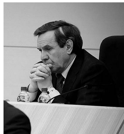
НА ФОТО: ЧТО БУДЕТ ДЕЛАТЬ ГУБЕРНАТОР?

— Перекредитоваться, заменить банковские кредиты государственными