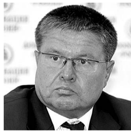
НА ФОТО: АЛЕКСЕЙ УЛЮКАЕВ

Соответственно, по логике Алексея Улюкаева, если бы власти не пошли на заморозку пенсионных накоплений в 2014—2015 гг., то в НПФ и ВЭБе удалось бы аккумулировать более 4 трлн. рублей, что благотворно отразилось бы на инвестиционном климате в России. Таким образом, путь к спасению экономики РФ от дефицита ликвидности, вызванного перекрытием западных кредитных линий, лежит через возвращение к накопительной модели пенсионного обеспечения. «В этом году инвестиционный спад порядка 10%, в следующем году мы прогнозируем 1,5%. Весь объем инвестиций — 13,5 трлн. рублей, 1 трлн. составляет порядка 7-8%, вот считайте, какой короткий шаг от инвестиционного спада до инвестиционного подъема», — резюмировал Улюкаев.