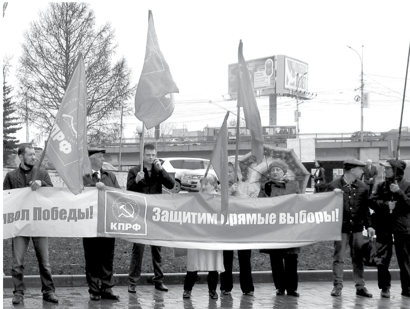
НА ФОТО: ПИКЕТ В ЗАЩИТУ ПРЯМЫХ ВЫБОРОВ В АПРЕЛЕ 2015 ГОДА У ЗАКСОБРАНИЯ НОВОСИБИРСКОЙ ОБЛАСТИ