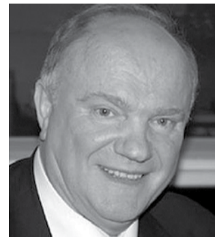
НА ФОТО: ГЕННАДИЙ ЗЮГАНОВ

«Сегодня Минский тракторный завод производит более 40 тысяч тракторов в год, — продолжил Геннадий Андреевич. — Причем тракторов всех типов. Начиная от «ползунок», который чистит тротуары и работает на приусадебных участках, до могучих машин, способных обрабатывать любые контуры полей. Этот завод поставляет свою продукцию в 72 страны мира. К слову сказать, четыре российских тракторных завода произведут в этом году, похоже, меньше пяти тысяч тракторов».