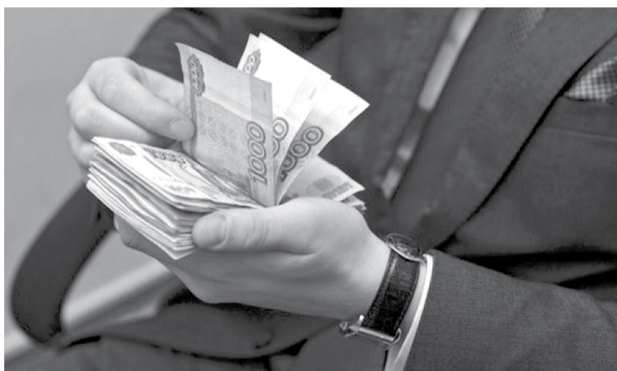
НА ФОТО: ЧИНОВНИКИ ПОЗАБОТИЛИСЬ О СВОЕМ КАРМАНЕ

ложение» самих депутатов и их помощников. На 16% выросли расходы на оплату их труда, с 3,4 млрд рублей до почти 3,94 млрд. Также почти в два раза повышены и суммы на накладные расходы: оплату билетов, телефонных переговоров и т. д.