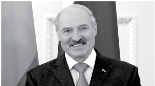
НА ФОТО: ИЗБРАННЫЙ ПРЕЗИДЕНТ БЕЛОРУССИИ А.ЛУКАШЕНКО