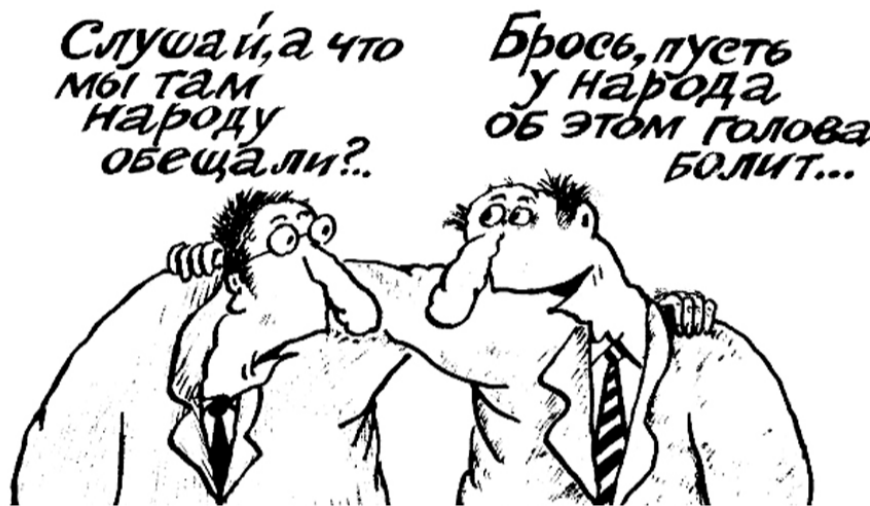
НА ФОТО: ПОСЛЕ ВЫБОРОВ «ЕДИНАЯ РОССИЯ», ПО ТРАДИЦИИ, ТЕРЯЕТ ПАМЯТЬ