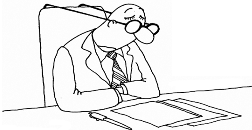
● НА РИС.: ЧИНОВНИКИ ЗАКРЫВАЮТ ГЛАЗА НА ПРОБЛЕМЫ НАРОДА

«Эта проблема касается всех депутатов. Я собрал 277 предложений по наказам, из которых администрация района предлагает включить в план всего 3! Такая же ситуация и у других депутатов. Районным администрациям была поставлена задача по максимальному сокращению количества наказов. Если в прошлом созыве на моем округе исполнено 108 наказов, то в этом созыве предлагают выполнить всего 3. С этим я как депутат никогда не соглашусь. При этом 116