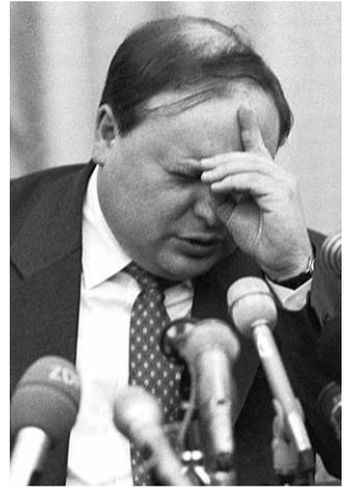
● НА ФОТО: ЕГОР ГАЙДАР

Президент России Дмитрий МЕДВЕДЕВ подписал указ об увековечении памяти одиозного экономиста и политического деятеля 90-х Егора ГАЙДАРА, который скончался в декабре 2009 года, сообщила