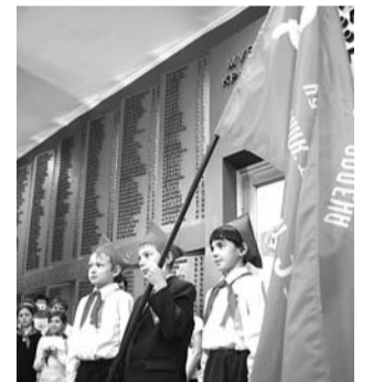
● НА ФОТО: ВСЕГДА ГОТОВЫ

В день 88-летней годовщины пионерии 17 новосибирских школьников вступили в ряды пионерской организации имени Владимира Ильича ЛЕНИНА. На торжественном собрании пионеры из приемов прошлых лет рассказали о своих достижениях, а новички дали торжественную клятву беречь и хранить честь своего галстука. Повязали галстуки школьникам ветераны Великой Отечественной войны и лидеры новосибирских коммунистов.