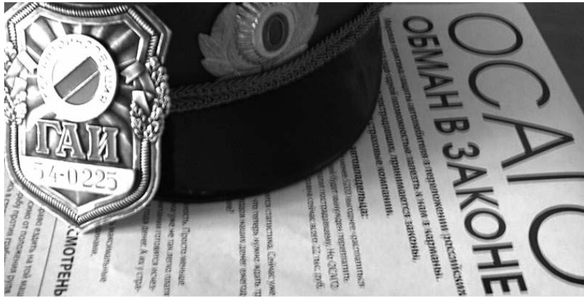
● НА ФОТО: УЗАКОНЕННЫЙ ГРАБЕЖ

В «презентации» грядущее повышение стоимости страховки подается под соусом защиты населения. Дескать, теперь пострадавшие в ДТП могут в случае чего получить максимум не 160 тыс., а целых 500 тыс. рублей. Проникающее ранение черепа по предлагаемой системе «оценивается» в 150 тыс. рублей, перелом одной тазовой кости — в 25 тыс. рублей, а сотрясение мозга — в 10 тыс. Эта неслыханная щедрость, конечно, будет оплачена не из средств страховых компаний, а из кармана автолюбителей. Стоимость полиса ОСАГО в результате «повышения выплат для пострадавших в ДТП» по прогнозам экспертов в правительстве вырастет на 30%. Если учесть, что сегодня страховка ОСАГО для среднестатистического автомобиля в России стоит 2 400 руб., то рост будет весьма ощутим для автовладельцев.