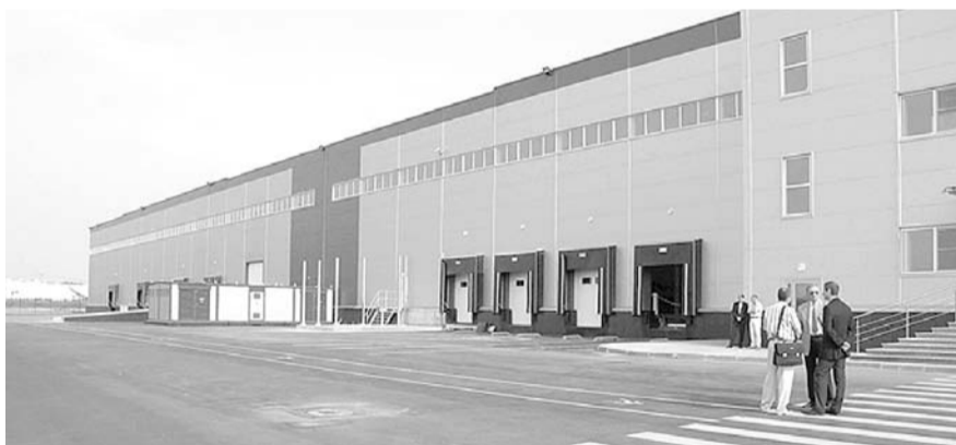
НА ФОТО: НА РАЗВИТИЕ ПЛП ИЗ ОБЛАСТНОГО БЮДЖЕТА БЫЛО ВЫДЕЛЕНО 2 934 МЛН РУБЛЕЙ

В ряде случаев договоры на строительные-монтажные работы заключались УК ПЛП до получения положительного заключения государственной экспертизы, что приводило к увеличению стоимости и сроков строительства. Также допускались нарушения сроков выполнения работ, при этом неустойка за нарушение сроков подрядным организациям, как