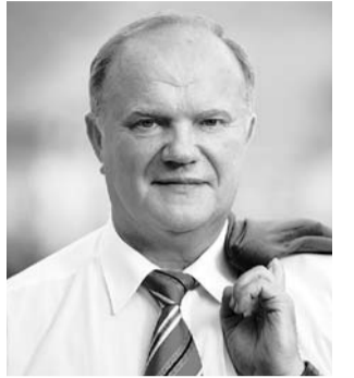
НА ФОТО: ЛИДЕР КПРФ

26 июня отметил свой день рождения Председатель ЦК КПРФ Геннадий Андреевич ЗЮГАНОВ. От имени коммунистов и сторонников КПРФ в Новосибирской области лидер партии поздравляет первого секретаря обкома Анатолий ЛОКОТЬ.