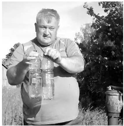
НА ФОТО: ГРЯЗНАЯ ОЧИЩЕННАЯ ВОДА

Жители Куйбышева жалуются на качество воды. Из крана течет коричневая мутная жидкость, назвать которую питьевой водой просто нельзя. Жалобы в администрацию города результата не дают, а жители вынуждены стоять в очереди у колонок, которых в Куйбышеве только две.