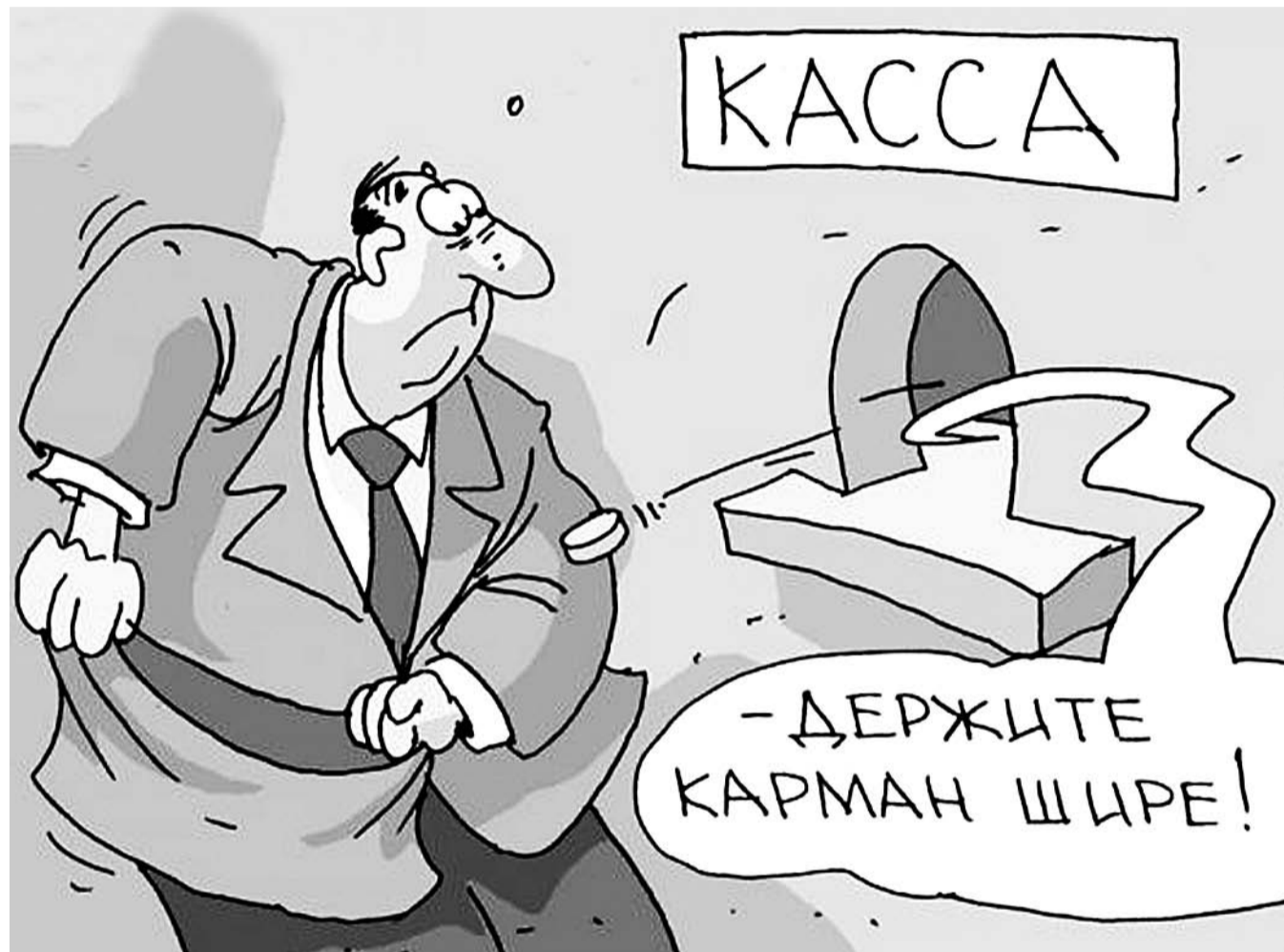
НА РИС.: СРЕДНЯЯ ЗАРАБОТНАЯ ПЛАТА В НОВОСИБИРСКОЙ ОБЛАСТИ СОСТАВЛЯЕТ 23 750 РУБЛЕЙ. ЭТО МЕНЬШЕ, ЧЕМ В РЕСПУБЛИКЕ ХАКАСИЯ