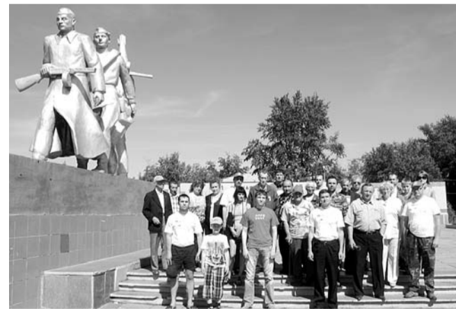
НА ФОТО: УЧАСТНИКИ АВТОПРОБЕГА В БАРАБИНСКЕ