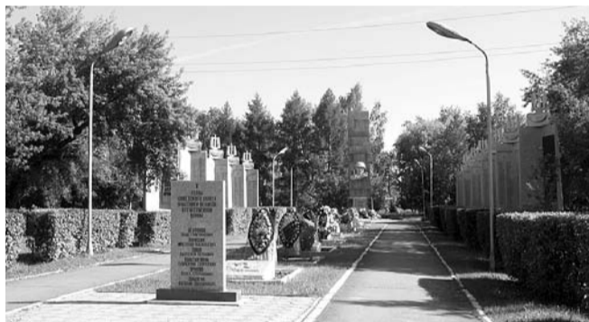
НА ФОТО: АЛЛЕЯ СЛАВЫ В КУЙБЫШЕВЕ

Администрация Куйбышева перенесла мероприятия в память о начале Великой Отечественной на 21 июня