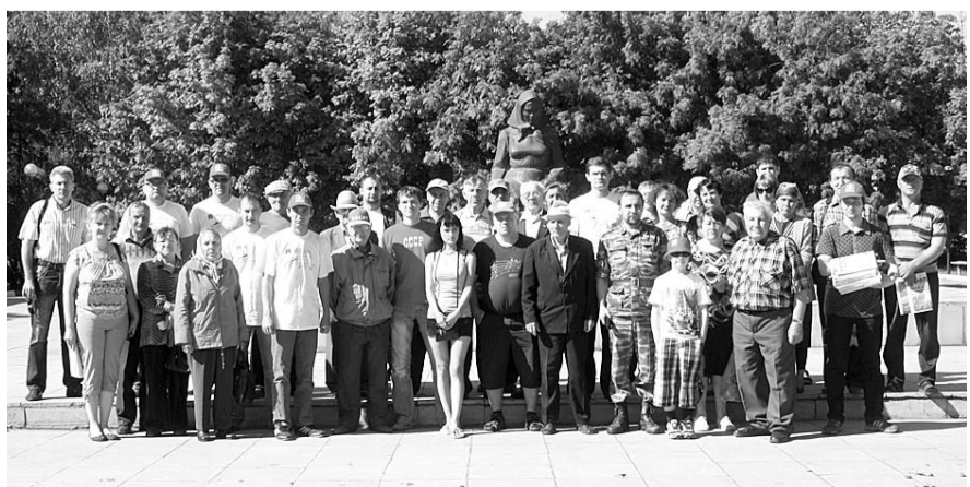
НА ФОТО: УЧАСТНИКОВ АВТОПРОБЕГА ВСТРЕЧАЮТ В ДОВОЛЬНОМ