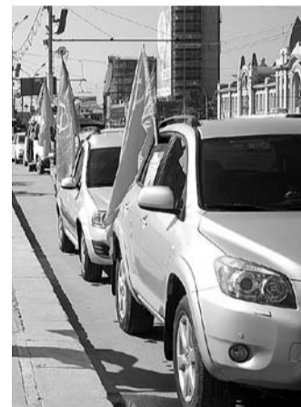
НА ФОТО: СТАРТ АВТОПРОБЕГА

22 июня в 10:00 с площади Ленина в Новосибирске стартовал традиционный автопробег, проводимый новосибирскими коммунистами в день начала Великой Отечественной войны. В этом году мероприятие было приурочено к 100-летию со дня рождения Александра Покрышкина.