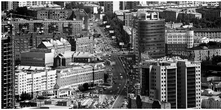
НА ФОТО: РЫНОК НАРУЖНОЙ РЕКЛАМЫ МОЖЕТ СУЩЕСТВЕННО ПОПОЛНЯТЬ БЮДЖЕТ ГОРОДА

Фракция КПРФ предложила поправку, увеличивающую коэффициент К2 до 0,4, но депутаты-единороссы решили пожалеть операторов рекламного рынка.