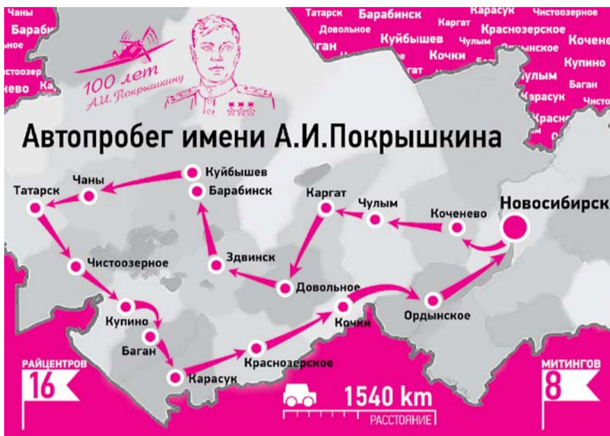
НА РИС.: КОММУНИСТЫ ПРЕОДОЛЕЛИ БОЛЕЕ 1500 КИЛОМЕТРОВ ПО ДОРОГАМ ОБЛАСТИ

— Нам очень приятно ваше внимание, ведь это дань уважения ветеранам. Пока мы помним этот день, никакие учебники