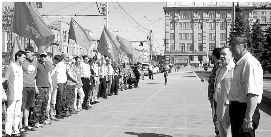
НА ФОТО: ПЕРЕД СТАРТОМ АВТОПРОБЕГА 22 ИЮНЯ С ПЛОЩАДИ ЛЕНИНА В НОВОСИБИРСКЕ