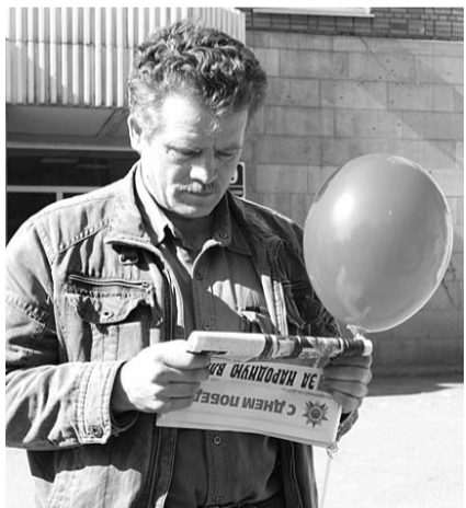
НА ФОТО: «ЗНВ» — ВОСТРЕБОВАННАЯ ГАЗЕТА

— «Обострения» эти происходят, как правило, накануне выборов. Сей-