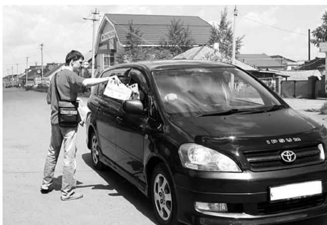
НА ФОТО: АВТОПРОБЕГ В ЧУЛЫМЕ. ЗНАКОМСТВО С ГАЗЕТОЙ «ЗНВ»