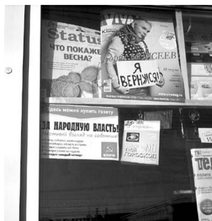
НА ФОТО: В 2011 ГОДУ РЕДАКЦИЯ ГАЗЕТЫ ПРОВОДИЛА СПЕЦИАЛЬНУЮ РЕКЛАМНУЮ КАМПАНИЮ В СЕТИ КИОСКОВ СА «ЭКСПРЕСС»