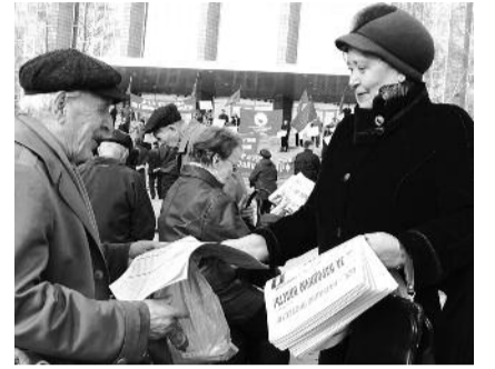
● НА ФОТО: СЕЙЧАС ТРЕБУЕТСЯ РАЗЪЯСНИТЕЛЬНАЯ РАБОТА СРЕДИ НАСЕЛЕНИЯ

Пояснения в области технологии ее проведения убедительно дает пресс-конференция лидера коммунистов Геннадия Зюганова 31 января текущего года в информацион-