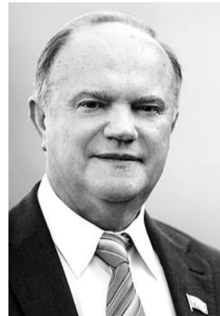
● НА ФОТО: ЛИДЕР КПРФ

В информационном агентстве «Интерфакс» 9 февраля кандидата в Президенты России от Народно-патриотических сил Геннадий ЗЮГАНОВ рассказал о «Правительстве Народного доверия», которое будет сформировано после победы на президентских выборах.