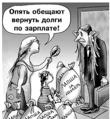
● НА РИС.: А ДОЛГИ ВСЕ РАСТУТ И РАСТУТ...

ций, находящихся на территории Новосибирской области, на всех уровнях — районном, городском, областном. Кроме того, вопросы просроченной задолженности по зарплате выносятся на рассмотрение трехсторонних комиссий, а также комиссий Минтруда области. Кроме невыплаты заработной платы из-за нехватки средств, есть ситуации, когда свернувшие производство, либо перенесшие свои мощности в другие регионы предприятия должны заработную плату жителям Новосибирской области. Например, ЗАО «Завод ПСК», который перенес производство в Иркутскую область и остался должен работникам в Новосибирской области 28,5 млн. рублей.