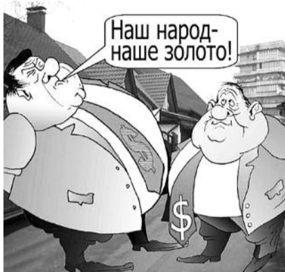
● НА РИС.: ЗА ЧЕЙ СЧЕТ ЖИРУЕТЕ?

В 2007-2008 годах жилищно-коммунальными делами улицы Кубовая, что в микрорайоне Мочище, занималась МУП «УК Заельцовская». В это время жильцы оплачивали согласно полученным квитанциям капитальный ремонт, который не спешил начинаться. А уж после реформирования системы ЖКХ управляющая компания и вовсе помахала собственникам жилья рукой, уйдя обслуживать жильцов других районов и не оставив мочищенцам ни ремонта, ни собранных на него средств порядка двенадцати миллионов рублей. Новой управляющей компании эти средства также переданы не были. И здесь стоит отметить тот факт, что сейчас жилищно-коммунальным хозяйством улицы Кубовой занимается совершенно другая управляющая компания с похожим названием, что может ввести жителей улицы в заблуждение. Однако новая управляющая