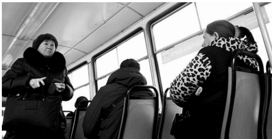
● НА ФОТО: КОММУНИСТЫ ТРЕБУЮТ ЗАКРЕПИТЬ ЗАКОНОМ ЗА ЛЬГОТНИКАМИ ПРАВО НА ПРОЕЗД

— Комитет «Пенсионеры за достойную жизнь» будет продолжать борьбу, пока закон не будет принят, — рассказала член оргкомитета «Пенсионеры за достойную