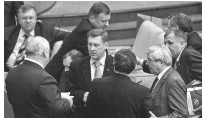
■ НА ФОТО: АНАТОЛИЙ ЛОКОТЬ (В ЦЕНТРЕ) В ЗАЛЕ ЗАСЕДАНИЙ ГОСДУМЫ