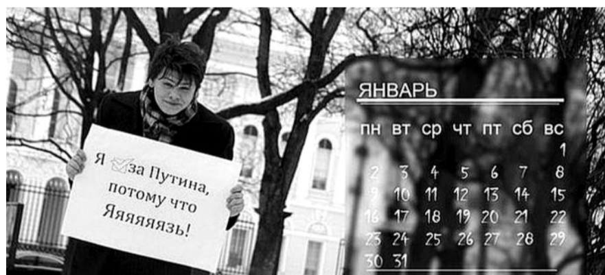
■ НА ФОТО: ЛИСТОК АГИТАЦИОННОГО КАЛЕНДАРЯ. НАЛИЦО МОЩНАЯ АРГУМЕНТАЦИЯ

На «сладкое» избирателям, готовым проголосовать за Путина, будет предложена лотерея с заманчивыми призами. Лотерейные билеты, или «купончики», как