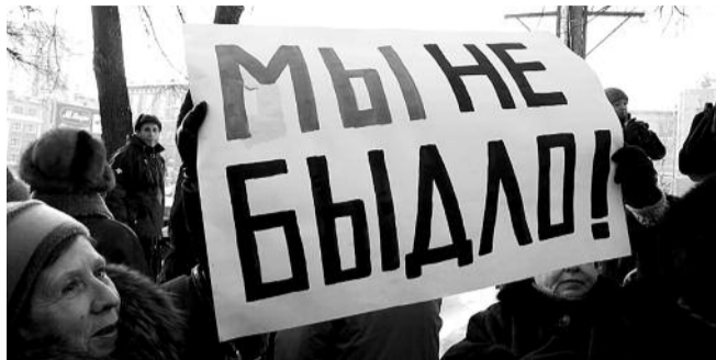
● НА ФОТО: ПЕНСИОНЕРЫ ОТСТОЯЛИ СВОИ ПРАВА

Больше года длилось противостояние нового губернатора ЮРЧЕНКО и пенсионеров Новосибирской области по поводу отмены безлимитного проезда льготников. В 2011 году губернатор решил за счет пенсионеров поправить бюджет области, ограничив льготный проезд пенсионеров 30-ю поездками в месяц.