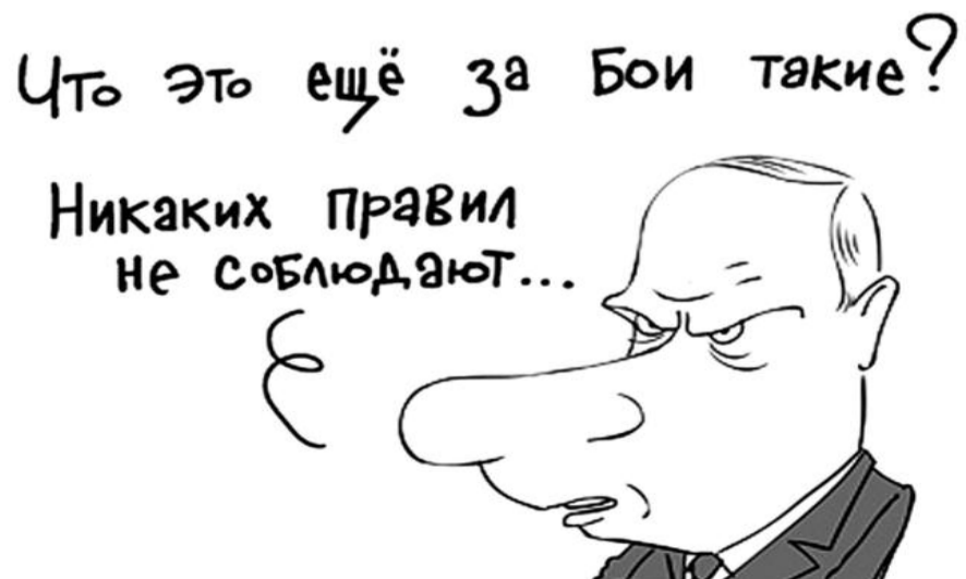
● НА РИС.: ОБИДЕЛСЯ...