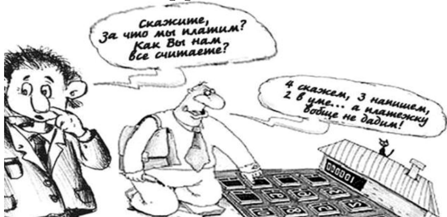
● НА РИС.: НАПЕРСТОЧНИКИ ОТ ЖИЛИЩНО-КОММУНАЛЬНОГО ХОЗЯЙСТВА

В адрес фракции КПРФ в Городском Совете Новосибирска поступило несколько обращений от граждан по фактам необоснованного повышения тарифов со стороны управляющих компаний (УК). Как показала практика, заставить УК пересмотреть необоснованные тарифы могут только прокуратура или суд.