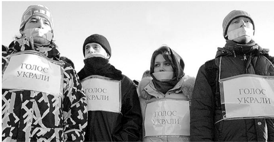
● НА ФОТО: НОВОСИБИРСКАЯ МОЛОДЕЖЬ В ПИКЕТЕ «ЗА ЧЕСТНЫЕ ВЫБОРЫ» 12 ДЕКАБРЯ 2011 ГОДА

Сейчас политически активную молодежь можно разделить на три условных группы. Первая группа — это молодые люди, которые протестуют против ПУТИНА и