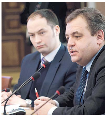
НА ФОТО: НА СЕССИИ ГОРСОВЕТА

Кроме этого, лидер фракции подчеркнул, что рано или поздно к этому ре-