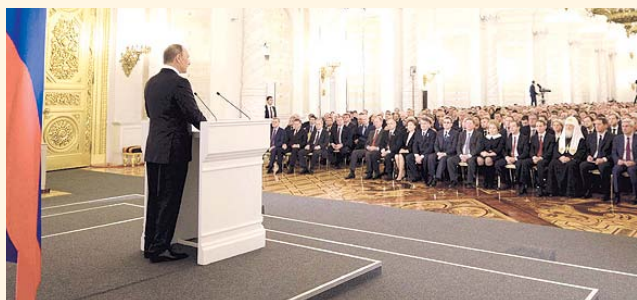
НА ФОТО: ПРЕЗИДЕНТ ВЫСТУПАЕТ ПЕРЕД ФЕДЕРАЛЬНЫМ СОБРАНИЕМ