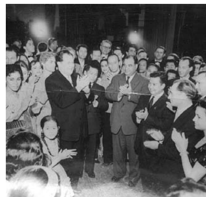
НА ФОТО: ВСТРЕЧА ДЕЛЕГАЦИИ

А далее следует визит в еще строящийся научный центр Сибирского отделения Академии Наук СССР, встреча с его руководителем, академиком Ми-