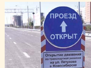
НА ФОТО: ГОРОДУ — НОВЫЕ ДОРОГИ!