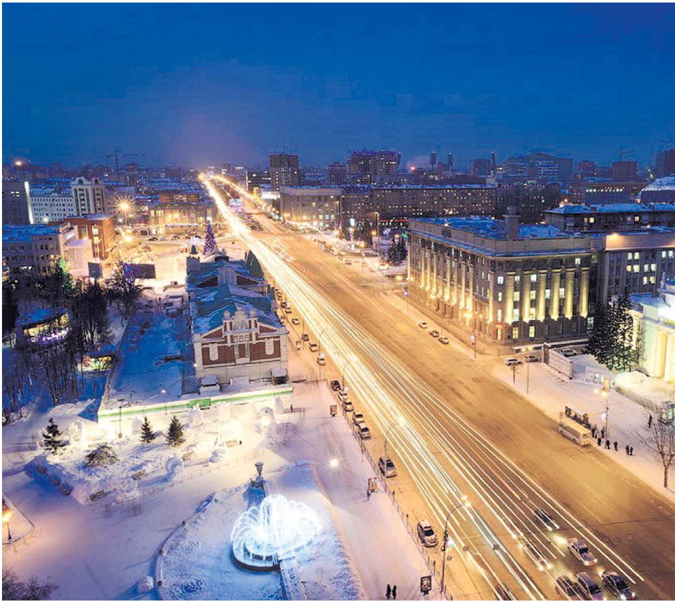
НА ФОТО: ДЕПУТАТЫ СОХРАНИЛИ СОЦИАЛЬНУЮ НАПРАВЛЕННОСТЬ ГОРОДСКОГО БЮДЖЕТА