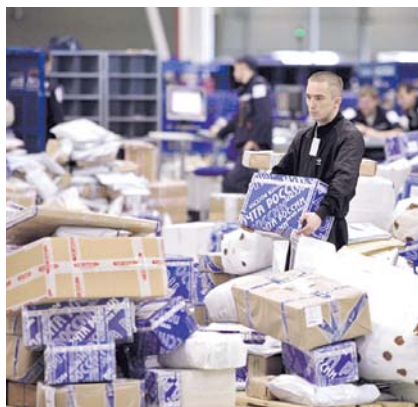
НА ФОТО: ПОЧЕМУ ЗАДЕРЖИВАЕТСЯ ГАЗЕТА?

В сортировочном центре предложили получить ответ, позвонив на «горячую линию». Сотрудники же «горячей линии» почему-то порекомендовали обратиться в отдел подписки, при том, что, как было сказано изначально, речь идет о газетах, распространяемых не посредством подписки, а через партийных активистов в районах. Дальше последовала своеобразная эстафета: