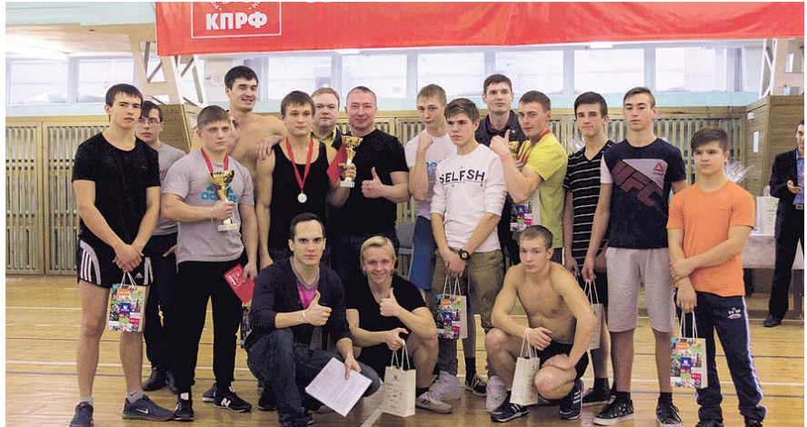
НА ФОТО: УЧАСТНИКИ СОРЕВНОВАНИЙ

4 декабря в ДДТ им. Ефремова состоялся зимний воркаут турнир-2016. Организатором выступил Новосибирский областной комитет КПРФ.