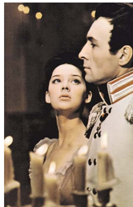
НА ФОТО: НАТАША РОСТОВА И КНЯЗЬ АНДРЕЙ БОЛКОНСКИЙ

Прежде никто не показывал войну так масштабно, как сделал это Сергей Бондарчук в сценах Бородинского сражения. Центральную панораму главного сражения начали снимать 25