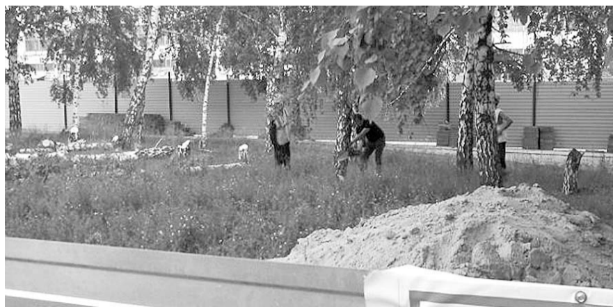
НА ФОТО: ВЫРУБКА ДЕРЕВЬЕВ В СКВЕРЕ ОКОЛО ГПНТБ