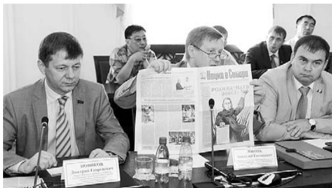
НА ФОТО: АНАТОЛИЙ ЛОКОТЬ (В ЦЕНТРЕ) НА СЕМИНАРЕ-СОВЕЩАНИИ

— Главной темой семинара-совещания были предстоящие выборы 8 сентября, которые проходят во многих регионах Сибири: это Читинская область,