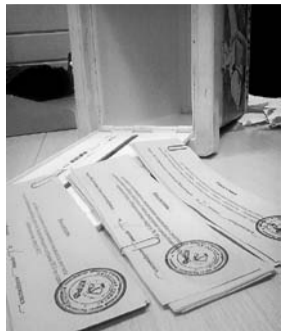
НА ФОТО: БЮЛЛЕТЕНИ ДЛЯ ТАЙНОГО ГОЛОСОВАНИЯ

На состоявшемся в понедельник заседании бюро Новосибирского областного комитета КПРФ коммунисты определили кандидатов на довыборы, которые состоятся 8 сентября. Выдвижение состоялось по трем округам: в Законодательное собрание Новосибирской области по Калининскому