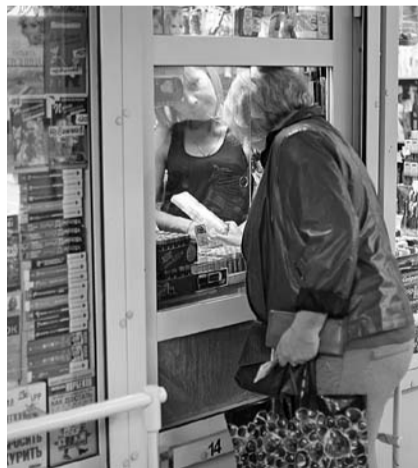
НА ФОТО: В

Что послужило причиной такому резкому охлаждению героического пыла областной власти по поводу выселения «террористически опасных» киоскеров? Ответ очевидный — консолидация торгового розничного сообщества, которое, вне всякого сомнения, примет участие в грядущих выборах мэра и губернатора, и явно не забудет обид. Как посчитали сами представители торговых предприятий, количество семей, которые живут за счет работы в киосках метрополитена, составляет более 1500. То есть, речь идет о довольно большом количестве избирателей,