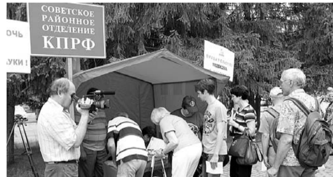
НА ФОТО: ИДЕТ СБОР ПОДПИСЕЙ ЗА ОТСТАВКУ ПРАВИТЕЛЬСТВА

10 Подрыв обороноспособности страны. Из 1223 аэродромов у России осталось сегодня 120. Из 1800 боевых самолетов 1200 нуждаются в ремонте.