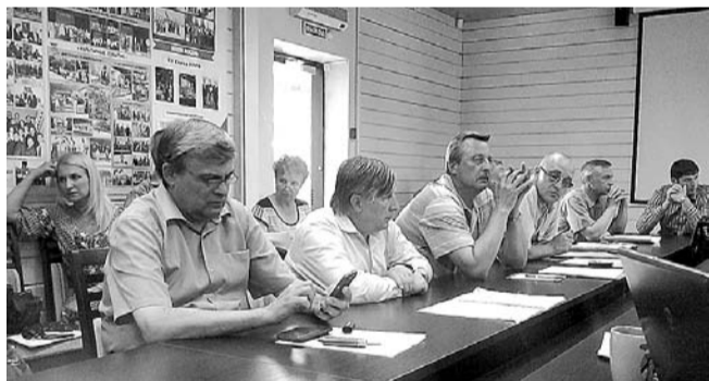
НА ФОТО: ИДЕТ ЗАСЕДАНИЕ БЮРО ОБКОМА