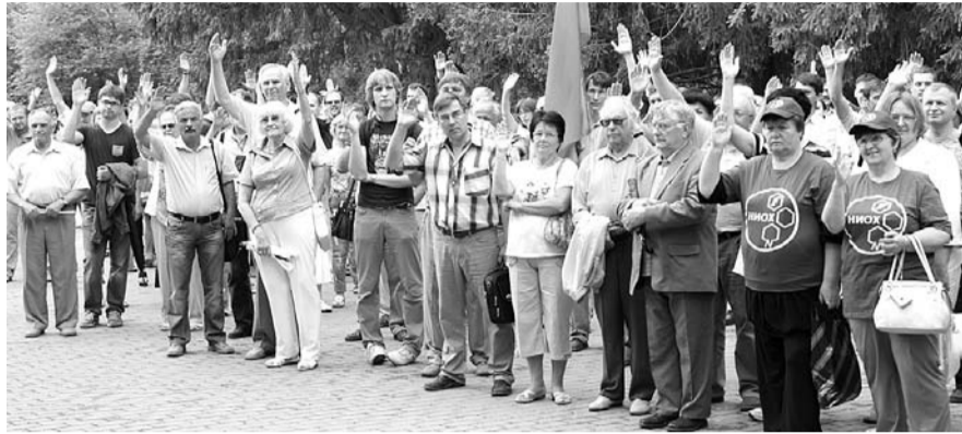
НА ФОТО: РЕЗОЛЮЦИЯ МИТИНГА ПРИНЯТА ЕДИНОГЛАСНО. НЕРАВНОДУШНЫХ МНОГО

Более 250 человек примут участие в мероприятии. В первую очередь, такие соревнования проводятся для молодого