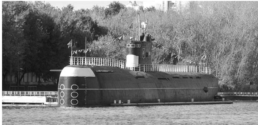
НА ФОТО: ГЕРОИЧЕСКУЮ ИСТОРИЮ «НОВОСИБИРСКОГО КОМСОЛЬЦА» ЗАКОНЧИЛИ ПО-ТИХОМУ

Накануне дня ВМФ закрыт уникальный музей на борту легендарного «Новосибирского комсомольца»