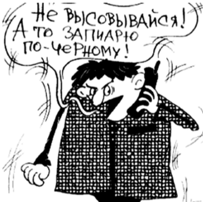
НА РИС.: В ДЕЛО ВСТУПАЮТ ТЕХНОЛОГИИ

Коммунисты никогда не пользовались методами черного пиара, и не собираются этого делать и впредь. Люди в Новосибирске и области достаточно умные, чтобы понять причины нападков на КПРФ. Оппоненты боятся новосибирских коммунистов и стараются застраховать свои должности перед важнейшими выборами в регионе — выборами губернатора.