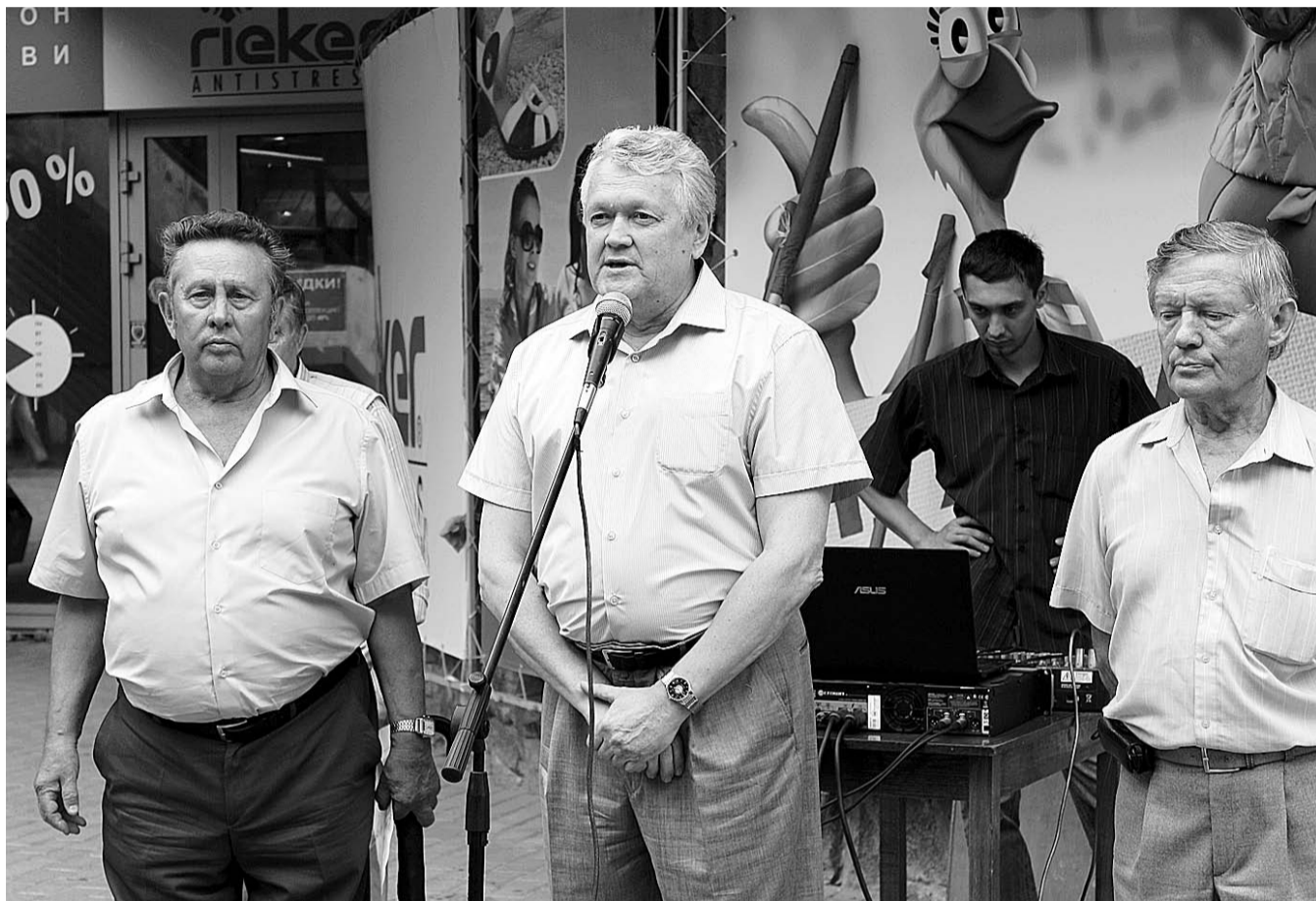
НА ФОТО: МИТИНГ В ЗАЩИТУ НАУКИ. ВЫСТУПАЕТ ПРЕДСЕДАТЕЛЬ ПРЕЗИДИУМА СО РАН АЛЕКСАНДР АСЕЕВ