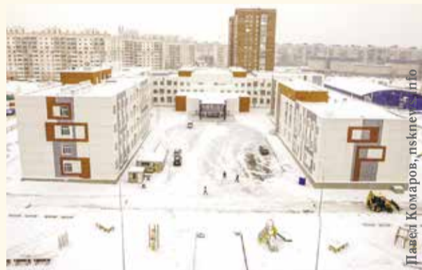
НА ФОТО: НОВУЮ ШКОЛУ НА 1100 МЕСТ В МИКРОРАЙОНЕ «РОДНИКИ» СДАДУТ В ДЕКАБРЕ

На 14-й сессии Законодательного собрания было одобрено концессионное соглашение о строительстве шести новых школ в Новосибирске. Общая вместимость — 5775 мест.