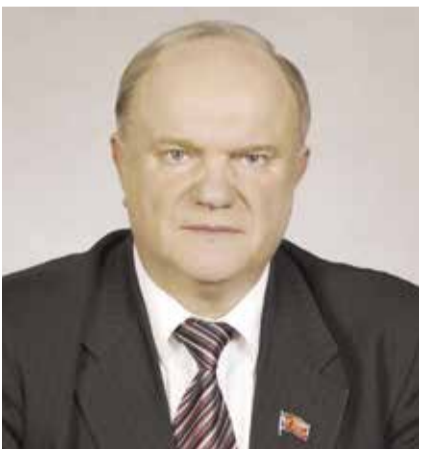
НА ФОТО: ПРЕДСЕДАТЕЛЬ ЦК КПРФ ГЕННАДИЙ ЗЮГАНОВ

Открытое письмо руководителей 11 больниц с приглашением посетить «красные зоны» больниц было адресовано «противникам вакцинации», среди которых оказались известные общественники, деятели искусства и культуры, а также политики — первым в списке значился Председатель ЦК КПРФ Геннадий ЗЮГАНОВ , вторым — лидер «Справедливой России» Сергей МИРОНОВ ,