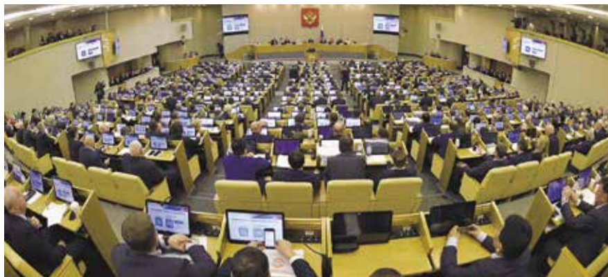
НА ФОТО: ДЕПУТАТЫ РЕШИЛИ, ЧТО ЛЬВИНАЯ ДОЛЯ ДОПОЛНИТЕЛЬНЫХ ДОХОДОВ БУДЕТ НАПРАВЛЕНА В ФОНД НАЦИОНАЛЬНОГО БЛАГОСОСТОЯНИЯ