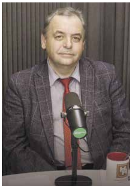
НА ФОТО: ДЕПУТАТ ГОСУДАРСТВЕННОЙ ДУМЫ, ВТОРОЙ СЕКРЕТАРЬ ОБЛАСТНОГО КОМИТЕТА КПРФ РЕНАТ СУЛЕЙМАНОВ ВЫСТУПИЛ КАК ЭКСПЕРТ В РАДИОПРОГРАММЕ «ВЕЧЕРНИЙ РАЗГОВОР С АРТЕМОМ РОГОВСКИМ»

Несмотря на то, что в плане законопроектной работы российского парламента на декабрь два правительственных законопроекта о введении QR-кодов не стоят, они активно обсуждаются в региональных парламентах, и усилиями большинства в лице «Единой России» (а, например, в Омской области к ним присоединяются «Коммунисты России») на них даются положительные отзывы.