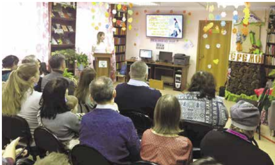
НА ФОТО: ДЕНЬ МАТЕРИ В БИБЛИОТЕКЕ ИМ. М. М. ПРИШВИНА

День матери — один из самых трогательных праздников. Каждый человек несет в душе неповторимый, родной образ своей мамы, которая всегда пожалеет, приласкает, назовет самыми теплыми и ласковыми словами и будет любить, несмотря ни на что.