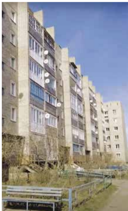
НА ФОТО: ЗНАМЕНИТЫЙ «ПАДАЮЩИЙ ДОМ» В ТАТАРСКЕ

Уровень наклона позволяет признать дом аварийным и готовить его к расселению жителей