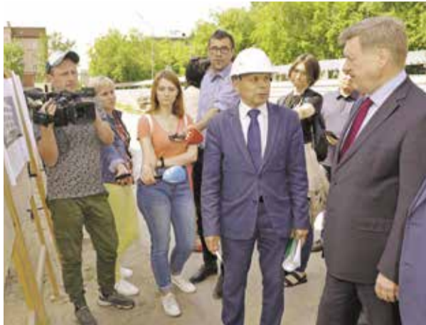
НА ФОТО: МЭР АНАТОЛИЙ ЛОКОТЬ НА СТРОИТЕЛЬНОЙ ПЛОЩАДКЕ ШКОЛЫ

Четырехэтажное здание для школы № 54 в Центральном районе Новосибирска рассчитано на 249 мест, его строительство идет с опережением графика.