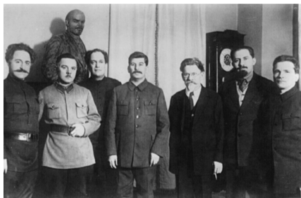
НА ФОТО: Г. К. ОРДЖОНИКИДЗЕ, К. Е. ВОРОШИЛОВ, В. В. КУЙБЫШЕВ, И. В. СТАЛИН, М. И. КАЛИНИН, Л. М. КАГАНОВИЧ, С. М. КИРОВ В ДЕНЬ 50-ЛЕТИЯ СТАЛИНА. 21 ДЕКАБРЯ 1929 Г.