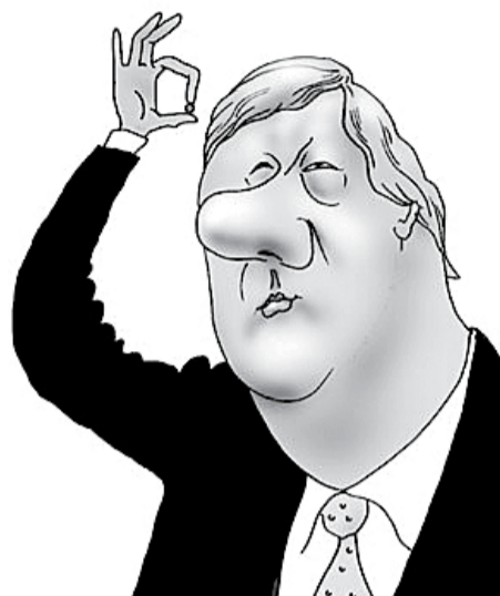
НА РИС.: ЧУБАЙС НАЧИНАЕТ НАНО-ПРОДАЖУ

— Больше года назад компания обнародовала планы своего превращения в