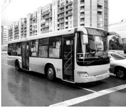
НА ФОТО: ГАЗ ЭКОНОМИТ СРЕДСТВА

Как минимум половина общественного транспорта в России должна быть переведена на газовое топливо — об этом гласит соответствующее постановление Правительства. Однако это решение упирается в объемный пласт проблем, в которых сейчас обитает муниципальный транспорт на местах.