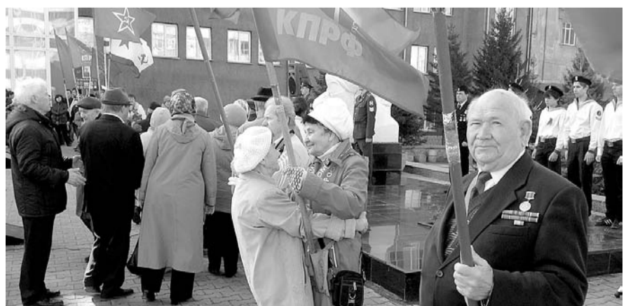
НА ФОТО: КОММУНИСТЫ ОКТЯБРЬСКОГО РАЙОНА У ПАМЯТНИКА БОРИСУ БОГАТКОВУ