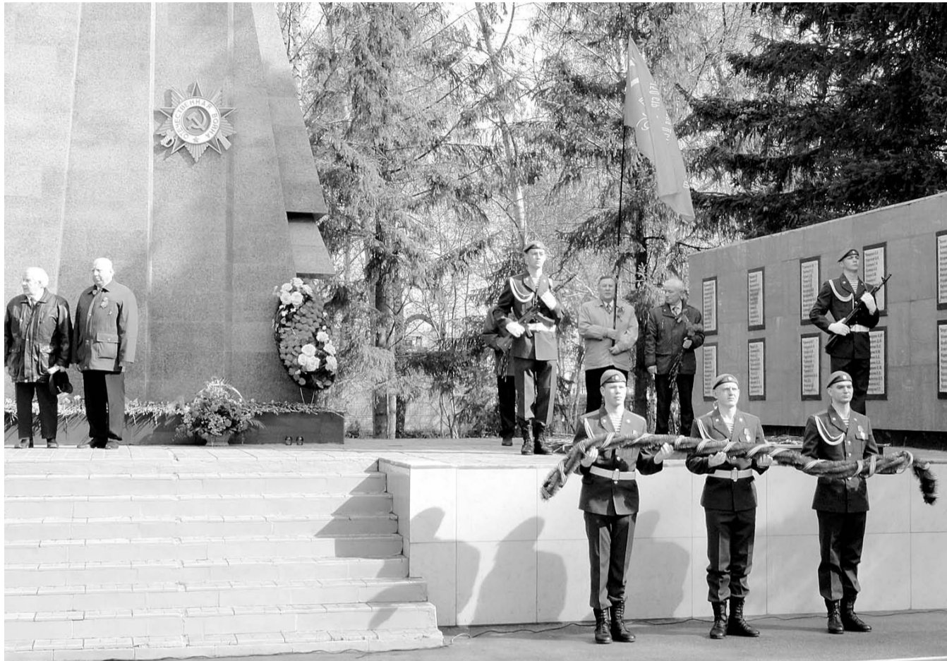
НА ФОТО: КОММУНИСТЫ ДЗЕРЖИНСКОГО РАЙОНА ПРИНЯЛИ УЧАСТИЕ В ТОРЖЕСТВЕННОМ МИТИНГЕ У ПАМЯТНИКА В «БЕРЕЗОВОЙ РОЩЕ»