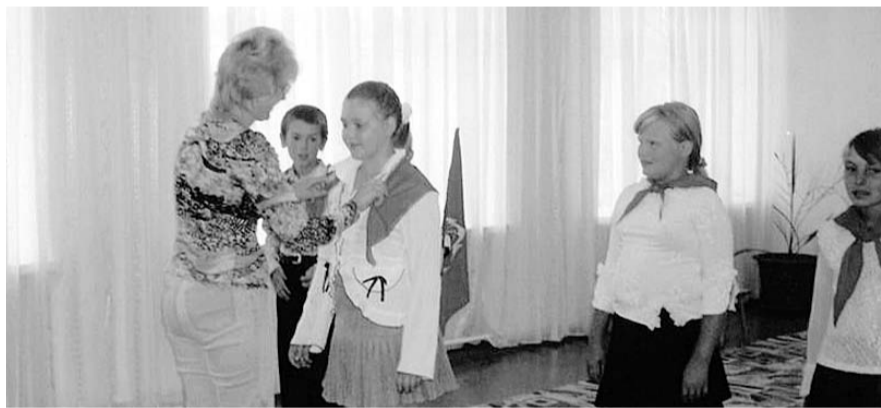
НА ФОТО: ТОРЖЕСТВЕННЫЙ ПРИЕМ В ПИОНЕРЫ В ЧИСТООЗЕРНОМ РАЙОНЕ