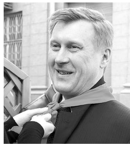
НА ФОТО: НА ЦЕРЕМОНИИ ВРУЧЕНИЯ ПРЕМИИ «КРАСНАЯ СТРОКА-2009» ВСЕ МОГЛИ ВНОВЬ ПОЧУВСТВОВАТЬ СЕБЯ ПИОНЕРАМИ