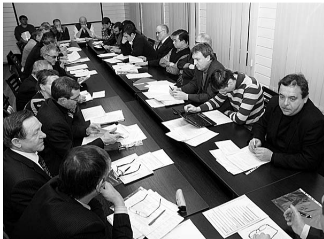
НА ФОТО: ИДЕТ ЗАСЕДАНИЕ БЮРО ОБКОМА КПРФ