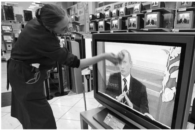
● НА ФОТО: ПУТИН-ТО ПРИПЫЛИЛСЯ...

Буржуазная власть запретила постоянный и непрерывный контроль со стороны всех государственных контролирующих органов в отношении технических объектов, производств, транспорта, увеселительных и других общественных заведений, в производстве и продаже продуктов питания и лекарств. Такое, граничащее с безумием, самоустранение государства привело к реальной угрозе жизни и гибели людей.