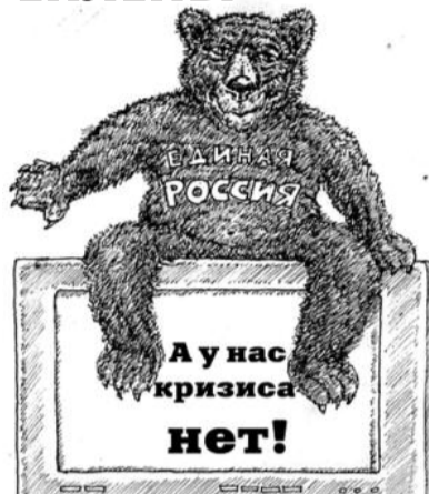
● НА РИС: МЕДВЕЖЬИ ОБЕЩАНИЯ

В-третьих, в новом бюджете заложен беспрецедентный рост расходов на национальную оборону, безопасность и правоохранительную деятельность. Их доля в тратах вырастет с 27,4% в 2011 году до 40,1% в 2014-м. Исходя из этого, можно сделать вывод о приоритетах правительства, указывают эксперты. В связи с колоссальным ростом расходов на силовую блок всплывает другая остро-насыщенная для России проблема. Даже сами власти признают, что средства на оборону расходуются неэф-