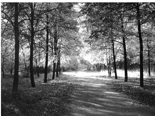
● НА ФОТО: СКВЕР ИМ. СИБИРЯКОВ-ГВАРДЕЙЦЕВ ПОД УГРОЗОЙ!

Распоряжением №4267-р от 16.06.2005 г. определяют скверу новые границы, по которым он оказывается с отсутствием в него входом, и умышленно в приложении №2 для застройщика территорию сквера обозначают как «земли резерва».