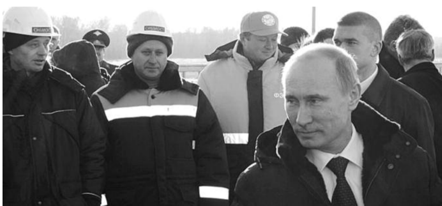
● НА ФОТО: «НАМ НУЖНЫ СТАНДАРТЫ КАЧЕСТВА, ТЕХНИКА СОВРЕМЕННАЯ...»

Особая проблема — это кадры, тут нам есть чему поучить других. Новосибирская область — единственная в стране, где по министру транспорта и дорожного хозяйства СИМОНОВУ осенью 2010 года Новосибирским Управлением антимонопольной службы