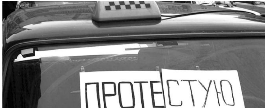
● НА ФОТО: УЖЕ СОСТОЯЛСЯ РЯД ПРОТЕСТНЫХ АКЦИЙ ТАКСИСТОВ И ПРЕДПРИНИМАТЕЛЕЙ