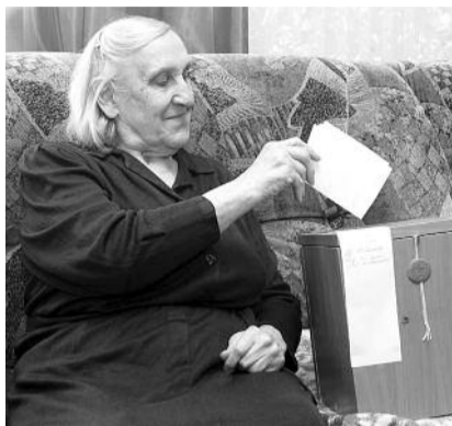
■ НА ФОТО: БУДЬТЕ БДИТЕЛЬНЫ 4 ДЕКАБРЯ

■ вызвать председателя комиссии, поставить в известность о том, что за вас кто-то «проголосовал» и потребовать составления протокола о нарушении (протокол должен быть подписан, и на нем должна быть