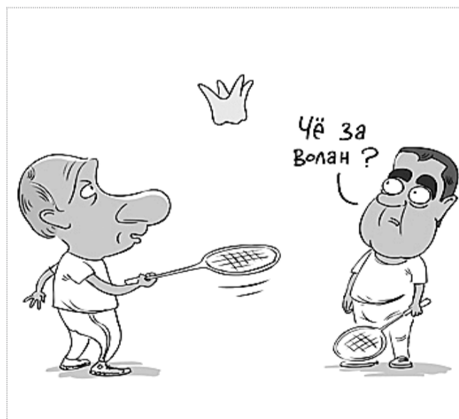
карикура Сергея ЕЛКИНА с сайта POLIT.RU