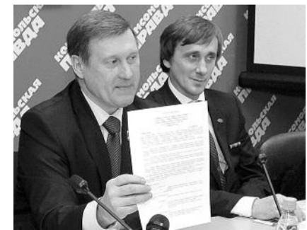
■ НА ФОТО: АНАТОЛИЙ ЛОКОТЬ

Материал оплачен из средств избирательного фонда Новосибирского областного отделения партии «Коммунистическая партия Российской Федерации»