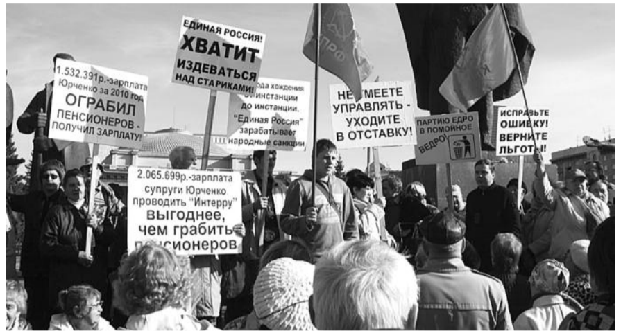
● НА ФОТО: ВЛАСТЬ НАШЛА ВИНОВАТОГО ВETERАНА ВЕЛИКОЙ ОТЕЧЕСТВЕННОЙ ВОЙНЫ

отделения, допрашивала, что называется, загадя, зная, какое решение, спустя несколько дней, возможно, не без санкции исполнительной власти примет суд.