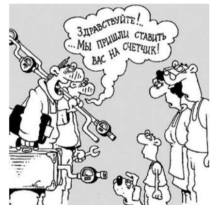
● НА РИС.: В ЧЬЮ ПОЛЬЗУ ОН БУДЕТ ТИКАТЬ?

пятое — установка счетчиков призвана только для одного — возместить потери в