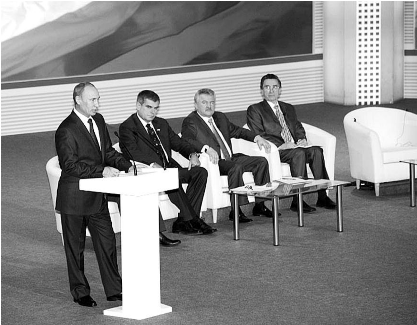
НА ФОТО: ВЛАДИМИР ПУТИН НА ФОРУМЕ ТРАНСПОРТНИКОВ В НОВОСИБИРСКЕ