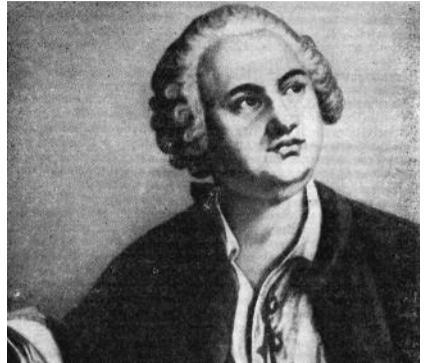
● НА ФОТО: МИХАИЛ ЛОМОНОСОВ

Ломоносов был одним из основоположников силлабо-тонического стихосложе-