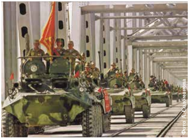
НА ФОТО: ПОСЛЕДНЯЯ КОЛОННА СОВЕТСКИХ ВОЙСК ПЕРЕСЕКАЕТ АФГАНО-СОВЕТСКУЮ ГРАНИЦУ, 15 ФЕВРАЛЯ 1989 ГОДА.