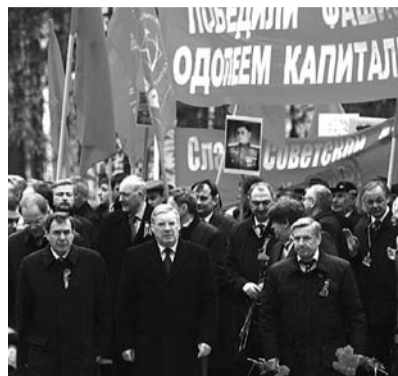
● НА ФОТО: ПЕРВЫМ ЛИЦАМ ГОРОДА ПРИШЛОСЬ ИДТИ ПОД КРАСНЫМИ ФЛАГАМИ

В итоге, прибывшим с опозданием высокопоставленным чиновникам и их замам пришлось идти к памятнику под красными знаменами и лозунгом «Победили фашизм — одолеем капитализм».