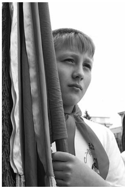
● НА ФОТО: РАСТЕТ СМЕНА!

Прошлым летом при поддержке обкома ребяташки из области ездили в пионерский лагерь на Байкал. Заняты пионеры проведением уроков мужества, организацией праздников, участвуют в обще-