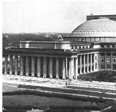
● НА ФОТО: НОВОСИБИРСКИЙ ТЕАТР ОПЕРЫ И БАЛЕТА В ГОД ЕГО ОТКРЫТИЯ

Внешний облик театра был характерен для модернистской архитектуры конца 1920 х гг.: отсутствие декоративных элементов, чистота и строгость форм, обнаженная и ясная строгость конструкций. Купол свободно лежит на круговой рандбалке, связывающей внутренние стойки радиально расположенных рам кула-