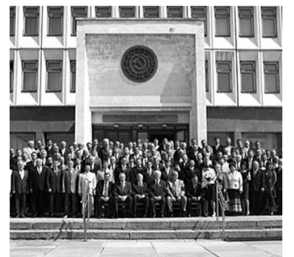
● НА ФОТО: ГЕРБ НА ЗДАНИИ СОВЕТА — НАШ, СОВЕТСКИЙ