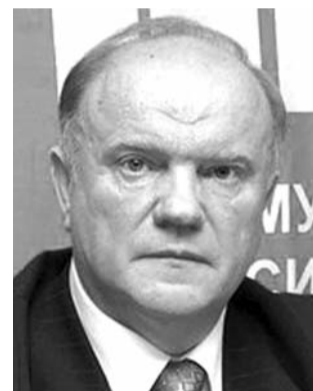
● НА ФОТО: ЛИДЕР КПРФ

Президент Дмитрий МЕДВЕДЕВ в интервью «Известиям», рассуждая об анти-сталинской «государственной идеологии» новой России изложил позицию, которая чревата далеко идущими морально-политическими и юридическими последствиями для РФ.