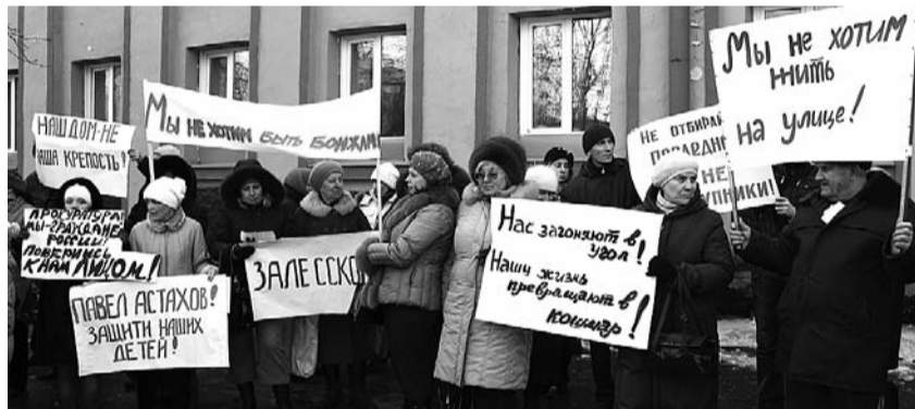
● НА ФОТО: ТОЛЬКО ТАК ИХ УСЛЫШАТ!