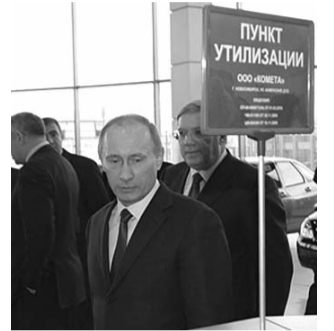
● НА ФОТО: РЕЙТИНГ — ДЕЛО ТОНКОЕ. ЧУТЬ ОТПУСТИЛ И В УТИЛЫ

Рейтинг информационного присутствия — это своего рода индикатор обострения политической конкуренции перед выборами 2012 года.