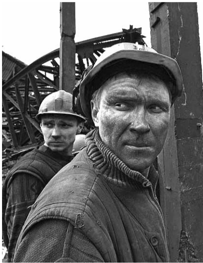
● НА ФОТО: ШАХТЕРЫ ПРОДОЛЖАЮТ ОПЕРАЦИЮ ПО СПАСЕНИЮ ТОВАРИЩЕЙ, 10 МАЯ

В результате аварии на шахте «Распадская» погибло 60 человек. На поверхность поднято 46 тел погибших. Медпомощь оказана 107 пострадавшим. Поиски 30 горняков продолжаются.