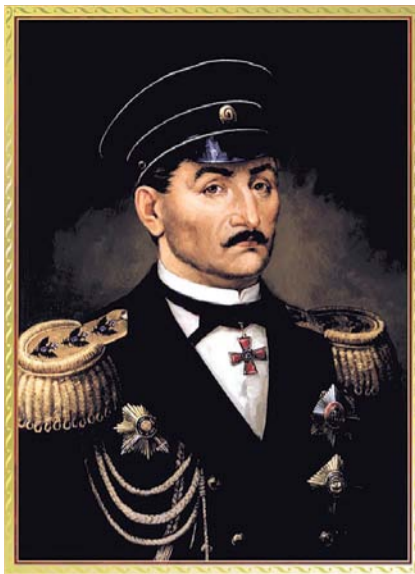
НА ФОТО: АДМИРАЛ ПАВЕЛ НАХИМОВ

Важнейшим направлением своих внешнеполитических интересов в это время Россия избрала Балканы. Здесь она преследовала две цели: установление своего контроля над важнейшими проливами Босфор и Дарданеллы и оказание помощи братским народам Балканского полуострова в их тяжелой освободительной борьбе от ненавистного османского ига. Однако первые же успешные шаги России в этом направлении (русско-турецкие войны 1806-1812 и 1828-1829 гг.) стали вызывать острое недовольство ее европейских коллег: Англии, Франции и Австрии. Никто из них не желал полного разгрома Турции и усиления за ее счет на Балканах России. Особенно беспокоило европейцев присутствие мощного русского флота на Средиземном море. Каждая их этих стран рассчитывала решать «восточный вопрос» в своих интересах.