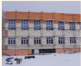
НА ФОТО: НА ШКОЛЫ ДЕНЕГ НЕТ

Федеральные средства, не реализованные в ходе софинансирования строительства школ в 2016 год, вновь распределили между регионами. Новосибирской области в числе фаворитов не оказалось.