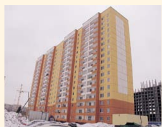
НА ФОТО: МКР ЗАКАМЕНСКИЙ

— На данный момент в городе осталось 47 проблемных объектов жилищного строительства. Из них 13 запланировано достроить в этом году, три дома уже введены: на улицах Петухова, Новосибирской и Ельцовской. Все остальные находятся на контроле муниципалитета, по каждому составлен индивидуальный план, — отметил мэр Анатолий ЛОКОТЬ .