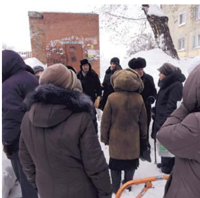
НА ФОТО: ЖИТЕЛИ ЗАЩИЩАЮТ СВОИ ПРАВА

В апреле 2016 года собственник сменился, им стало некое ООО «Финкор». Жители об этом уведомлены не были, пока в августе 2016 года новый собственник не поставил их перед фактом: надо заключить новые договоры и внести каждому по 10 тысяч рублей — якобы на капитальный ремонт овощехранилища. При этом смета на ремонт также не предъявлялась. Желавших отдавать почти всю пенсию непонятному лицу не оказалось, и тогда «Финкор» пошел на крайние меры: замки