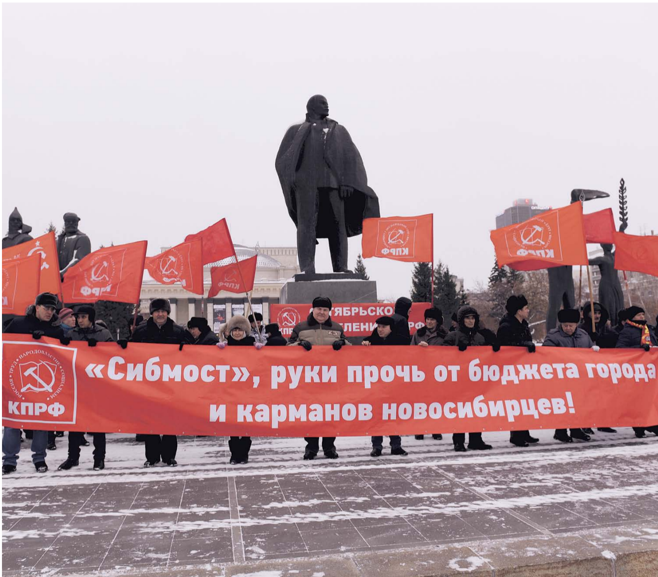
НА ФОТО: НА ПИКЕТЫ ВЫХОДЯТ СОТНИ ГОРОЖАН