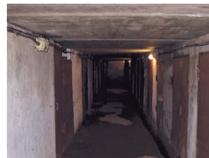
НА ФОТО: КТО ЗАРАБАТЫВАЕТ НА КООПЕРАТИВЕ?

Еще в 1989 году решением Исполкома Совета народных депутатов города Новосибирска за номером 184 от 27 июня было принято решение о выделении земельного участка площадью 25697 м 2 под строительство потребительского кооператива «Снегири» для хранения овощей и продуктов их переработки работниками завода №32, ныне ПО «Север». Овощехранилище было построено в количестве восьми отдельных блоков, и осталась еще свободная территория для дальнейшей застройки. Реформы в стране и другие причины повлекли за собой приостановку строительства новых ячеек. Из числа собственников образовался совет кооператива в количестве 10 человек, и был избран его председатель, который впоследствии все больше и больше стал удивлять своими единоличными решениями относительно сумм взносов, денежных сборов и их использования, прикрываясь при этом якобы постановлениями общих собраний. Пользуясь пассивностью членов кооператива, а порой их безразличием и нежеланием вступать в конфликтные отношения с правлением, этот зарвавшийся диктатор умудряется до сих пор руководить овощехранилищем, ничуть не беспокоясь за свою судьбу. Доказательств его прегрешений собрано предостаточно, но судами всех инстанций он оправдан и даже признан пострадавшим от «клеветы и необоснованных» подозрений. Но ведь известно, что современный суд не ищет доказательств вины или невиновности. Если истец смог правильно доказать и оформить все, как надо, с точки зрения судьи, то может рассчитывать на победу. А если не смог, то это уж его проблемы.