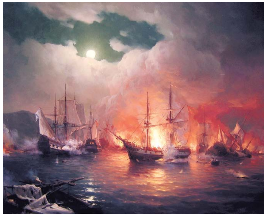
НА ФОТО: СИНОПСКОЕ СРАЖЕНИЕ