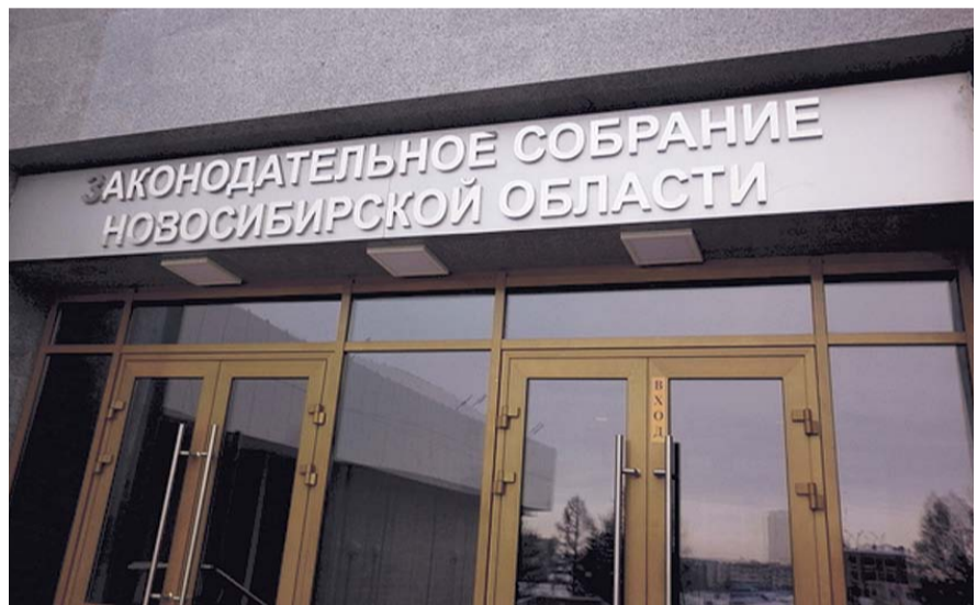
НА ФОТО: КОММУНИСТЫ В ЗАКСОБРАНИИ БОРЮТСЯ ЗА СОЦИАЛЬНЫЙ БЮДЖЕТ