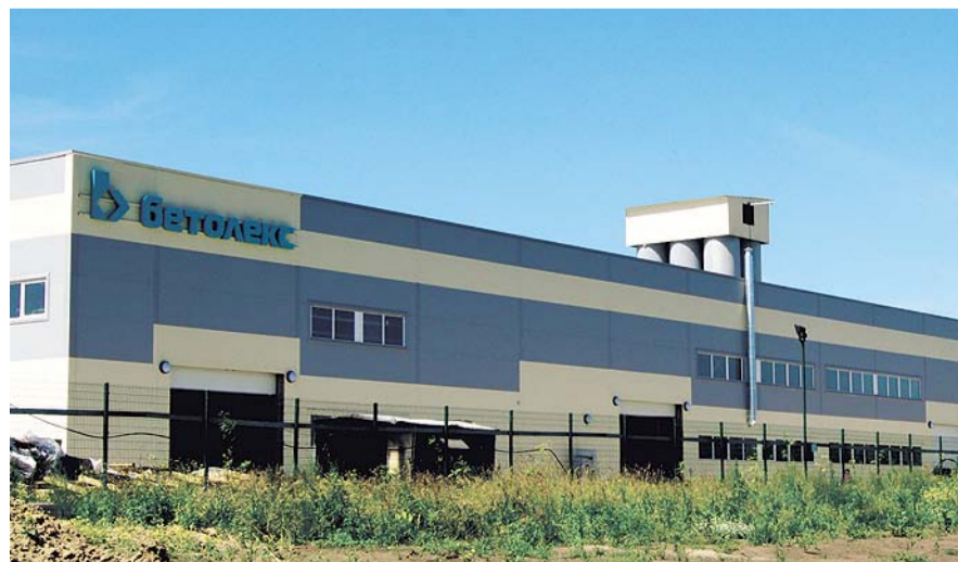
НА ФОТО: ЕЩЕ НЕДАВНО УСПЕШНОЕ ПРЕДПРИЯТИЕ ОБЪЯВЛЕНО БАНКРОТОМ