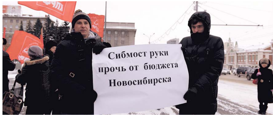
НА ФОТО: ГОРОЖАНЕ ВЫШЛИ НА ЗАЩИТУ БЮДЖЕТА ОТ АППЕТИТОВ КОММЕРСАНТА

— В принципе судиться с бюджетом — дело заведомо проигрышное, а здесь, когда по 10-й части бюджета принимается решение против городского бюджета, возникает вопрос в честности решения. Фактически была изменена сумма иска,