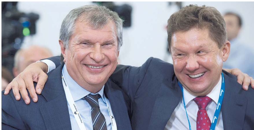
НА ФОТО: ИГОРЬ СЕЧИН И АЛЕКСЕЙ МИЛЛЕР

Forbes опубликовал список самых богатых топ-менеджеров России. Список традиционно возглавили глава «Газпрома» Алексей МИЛЛЕР (17,7 млн долларов в 2016 году) и президент «Роснефти» Игорь СЕЧИН (13 млн долларов).