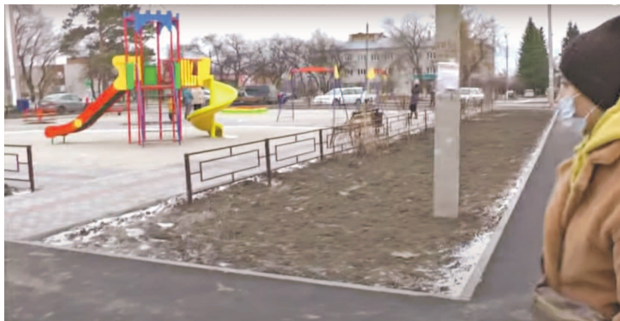
НА ФОТО: ЖИТЕЛИ НЕДОВОЛЬНЫ БЛАГОУСТРОЙСТВОМ ДЕТСКОЙ ПЛОЩАДКИ

Замечаний у общественников еще много, начиная с травмоопасных аттракционов и заканчивая тем, что смета вообще не совпадает с тем, что установлено по факту. Например, песочница из бруса, стоимость которой 16,8 тысяч рублей, сделана из обычных досок. Карусели не соответствуют