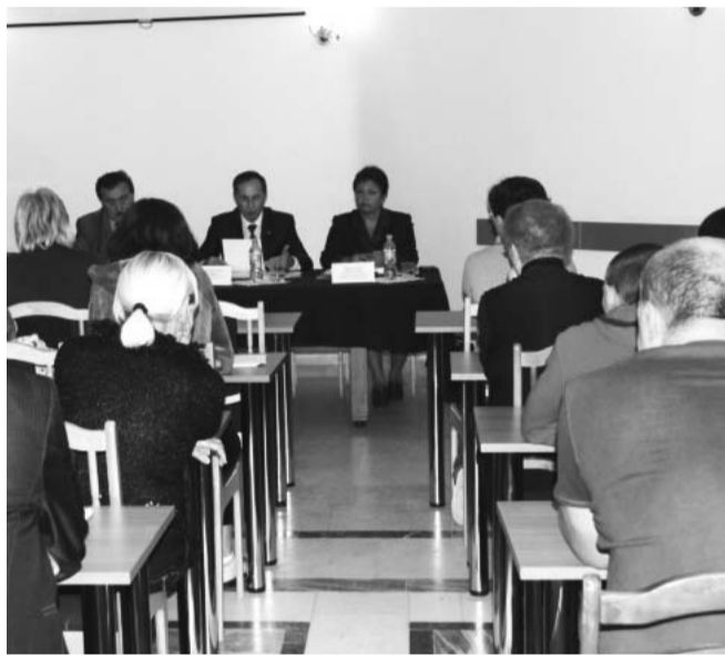
НА ФОТО: НА ВСТРЕЧЕ С РАБОТОДАТЕЛЯМИ