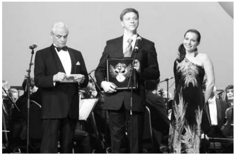
НА ФОТО: ДМИТРИЙ АВЕРИН (В ЦЕНТРЕ)

На концерте, посвященном Международному женскому дню 8 Марта, в организации которого также участвовало Новосибирское отделение Всероссийского женского Союза «Надежда России», нам посчастливилось услышать великолепного певца, лауреата Национальной премии «Золотая Маска» Дмитрия АВЕРИНА . Обладающий ярким, сильным, выразительным баритоном, драматическим даром, пластикой и незаурядной внешностью, он способен передать всю гамму чувств,