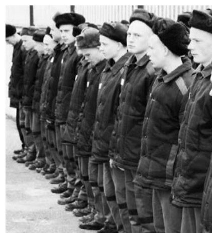
НА ФОТО: ДЕТСКАЯ КОЛОНИЯ

информация показывает уровень работы с молодежью: рост подростковой преступности в городах и районах Новосибирской области. Такая картина практически по всей области. Вот она — истинная эффективность молодежной политики. Мы тратим большие деньги, мы проводим «Интерру», проводим другие мероприятия, а преступность растет. У нас есть учреждения, которые должны заниматься молодежью, а эффективности нет. Более чем на 20% возросло число несовершеннолетних участников преступлений. Что еще более шокирует — на 72% увеличилось число преступников среди студентов вузов, а ведь со студентами власти работают активнее всего. И вот результат! На 43% увеличилась доля особо тяжких преступлений, совершаемых подростками! Цифры ужасают. И когда мы говорим о разработке новых программ в сфере молодежной политики и работы с молодежью, то один из критериев — это уровень преступности среди молодежи. Можно говорить и рапортовать о чем угодно, но, видя такие показатели, становится страш-