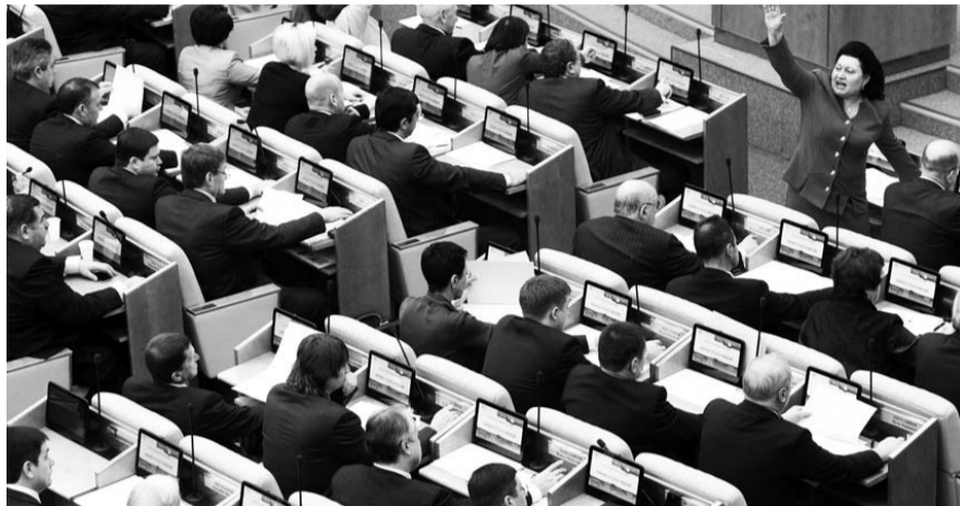
НА ФОТО: ЗАСЕДАНИЕ ГОСДУМЫ

У КПРФ вызывает сомнение, пройдет ли закон о госконтроле цен на продукты питания. Коммунисты уверены, что этот закон не только будет способ-