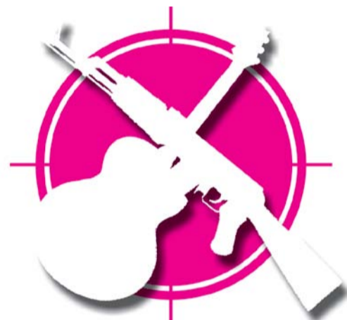
НА ФОТО: АРТБЛОКПОСТ АНТИ-НАТО — 2

Концерт продлится до 20.00. Его финалом станет файер-шоу.