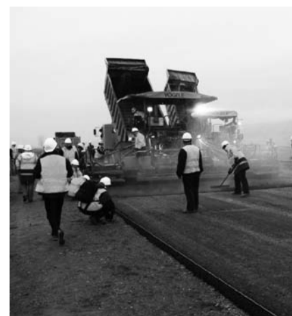
НА ФОТО: ДОРОГИ СТРОЯТСЯ!

В связи с экономическими сложностями в стране, области, городе, к строительству социально значимых объектов мэрия намерена активно привлекать частных инвесторов. Так, организации «Сибирский гигант», «Кварсис» и «Хорос» готовы вложить средства в модернизацию транспорт-