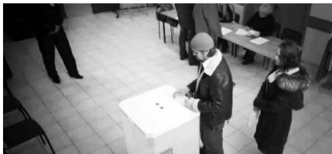
НА ФОТО: ПОПЫТКА «ВБРОСА»