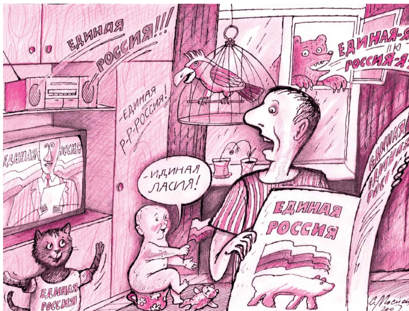
НА ФОТО: ПАРТИЯ ВЛАСТИ ТЕПЕРЬ ВЫЗЫВАЕТ У ИЗБИРАТЕЛЕЙ ЛИШЬ РАЗДРАЖЕНИЕ