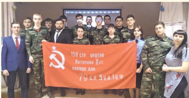
НА ФОТО: ШКОЛЬНИКАМ РАССКАЗАЛИ О ЗНАМЕНИ ПОБЕДЫ