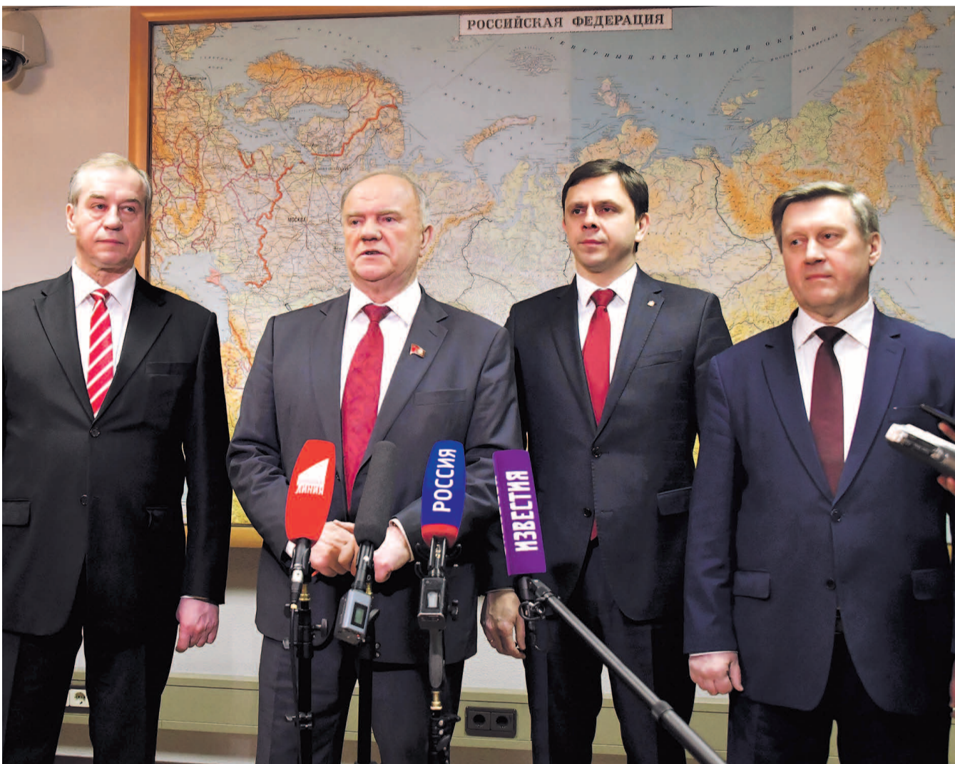
НА ФОТО: Г.А. ЗЮГАНОВ ПРИНЯЛ ОТЧЕТ РУКОВОДИТЕЛЕЙ-КОММУНИСТОВ — С.Г. ЛЕВЧЕНКО, А.Е. КЛЫЧКОВА И А.Е. ЛОКТЯ (СЛЕВА НАПРАВО)