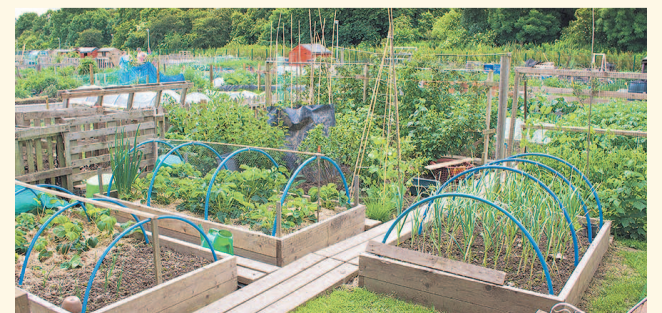
НА ФОТО: НА ЧТО БЫ ЕЩЕ НАЛОГ ПРИДУМАТЬ?