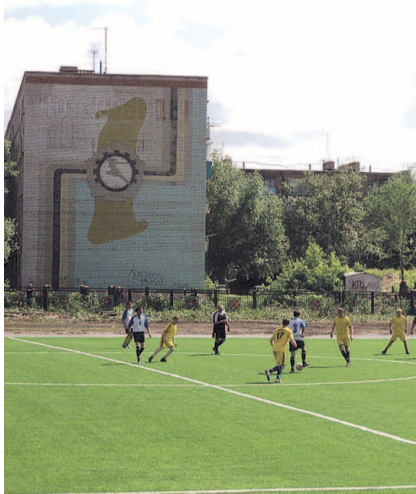
НА ФОТО: СТАДИОН ЕСТЬ, ПОБЕД — НЕТ

Областную спартакиаду среди ветеранов проведет Министерство по ФКиС Новосибирской области. Во всех районах области районные спартакиады среди ветеранов проводят учреждения ФКиС. А вот в Карасуке учреждении ФКиС самоустранилось