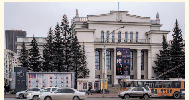
НА ФОТО: НОВОСИБИРСКИЙ ДОМ ЛЕНИНА