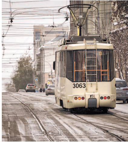
НА ФОТО: ОБНОВЛЕННЫЕ ТРАМВАЙНЫЕ ПУТИ

5. Строительство перехватывающих парковок у узловых станций метро и подземных общественных и частных парковок, вклю-