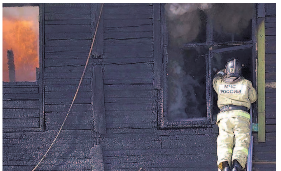
НА ФОТО: СПАСАТЕЛИ УБЕРЕГЛИ ПОСЕЛОК ОТ ПОЛНОГО ИСЧЕЗНОВЕНИЯ В ОГНЕ

Если бы спасатели не среагировали так быстро, масштабы трагедии могли