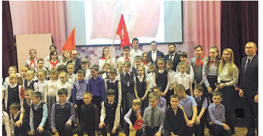
НА ФОТО: РЕБЯТИШКИ ВОЗРОЖДАЮТ СОВЕТСКИЕ ТРАДИЦИИ

— Сегодня здесь присутствуют все звенья нерушимой великой системы воспитания: октябрята — пионеры — комсомольцы, — отметила она, — в прошлом веке вся суть их деятельности заключалась в ежедневном подвиге, трудом и военном. Сейчас тоже есть место подвигу — подвигу в добрых делах: помогать старшим, защищать младших, поддерживать тех, кто оказался в сложной ситуации. Хочу пожелать нашим ок-