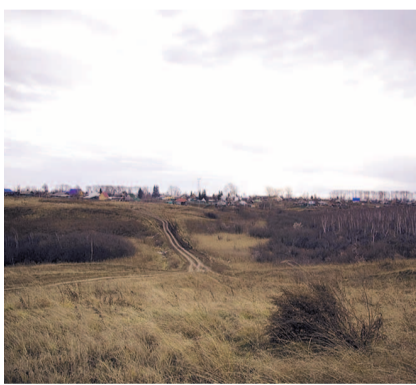
НА ФОТО: ДОРОГА НИКОМУ НЕ ПРИНАДЛЕЖИТ

Что касается непосредственно дороги, глава указывает, что «ранее в зимний период дорога до кладбища чистилась по мере необходимости (для захоронения)», но что сейчас «дорога разбита автотранспортом в связи с вывозом в весенне-осенний период дров