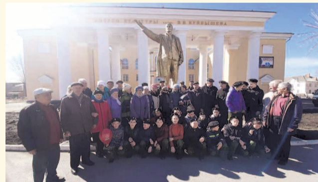
НА ФОТО: ЖИТЕЛИ КУЙБЫШЕВА У ПАМЯТНИКА ЛЕНИНУ