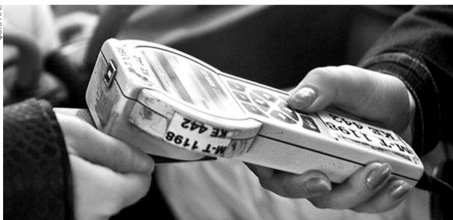
НА ФОТО: ПОСЛЕ ОТМЕНЫ БЕЗЛИМИТА ЛЬГОТНИКИ СТАЛИ ГОРАЗДО МЕНЬШЕ ЕЗДИТЬ