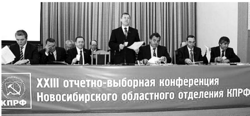
● НА ФОТО: В ПРЕЗИДИУМЕ ОТЧЕТНО-ВЫБОРНОЙ КОНФЕРЕНЦИИ