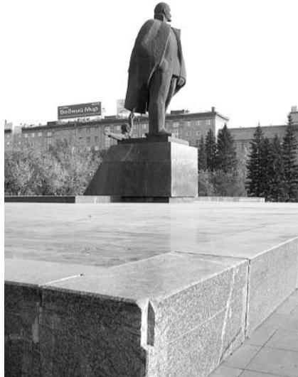
● НА ФОТО: РУКИ ПРОЧЬ ОТ ЛЕНИНА!

В эти выходные Новосибирская область отмечала свое 75-летие. Праздник, который должен был объединить всех жителей региона, стараниями областной власти ознаменовался скандалом. Власть, в очередной раз проигнорировав мнение общественности и наплевав на закон, решилась на крайне спорные имиджевые решения. Возводя декорации для празднования юбилея области, дважды награжденной Орденом Ленина, было решено «спрятать» памятник Владимиру Ильичу ЛЕНИНУ в недрах 30-тонной конструкции. И это несмотря на то, что архитектурная композиция является памятником истории федерального значения, где возведение любых конструкций запрещено законом. Та же участь постигла и бюст знаменитого новосибирца, трижды Героя Советского Союза Александра ПОКРЫШКИНА .