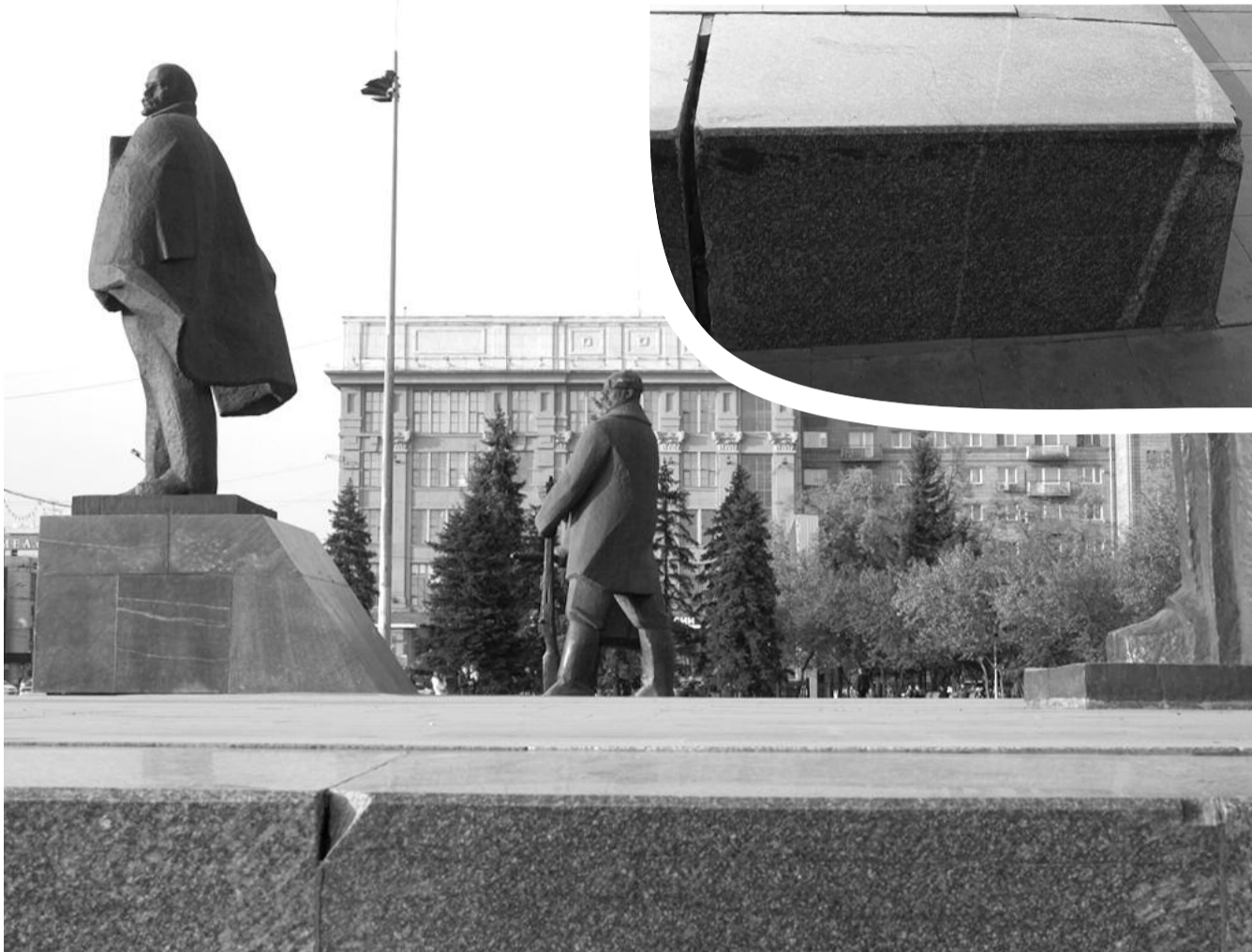
● НА ФОТО: 30-ТОННАЯ СЦЕНА ИЗУВЕЧИЛА ПАМЯТНИК ВЛАДИМИРУ ИЛЬИЧУ ЛЕНИНУ В ЦЕНТРЕ НОВОСИБИРСКА