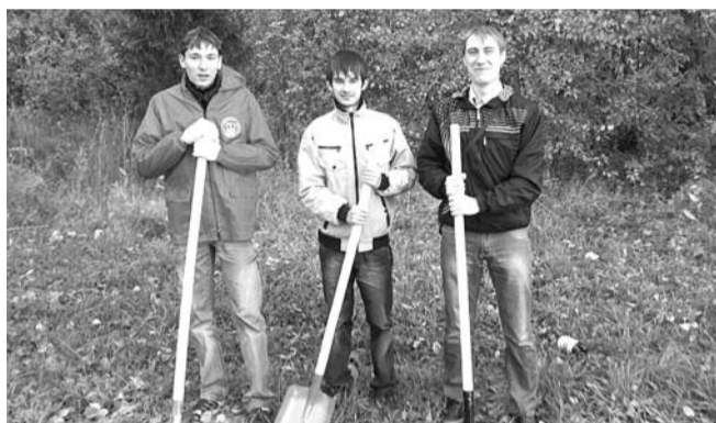
■ НА ФОТО: МОЛОДЫЕ КОММУНИСТЫ — ЗА ЗЕЛЕНЬ НОВОСИБИРСКИ

На прошлой неделе Депутатский центр КПРФ в Октябрьском районе провел акцию «Посади дерево», в ходе которой было высажено 30 деревьев. Также активисты центра совместно с управляющей компанией «УКЖХ Октябрьского района» спилили 15 аварийных деревьев.