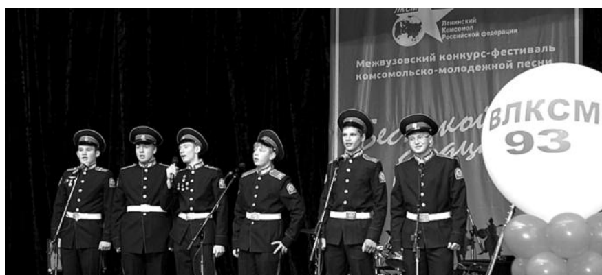
■ НА ФОТО: В ПРОШЛОМ ГОДУ УЧАСТВОВАЛИ 16 СОЛИСТОВ И 10 МУЗЫКАЛЬНЫХ КОЛЛЕКТИВОВ