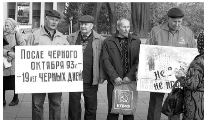
● НА ФОТО: НЕ ЗАБУДЕМ — НЕ ПРОСТИМ!

В среду, пока верстался номер, на главной площади Новосибирска состоялся пикет новосибирских коммунистов в память о защитниках Советской власти, погибших в октябре 1993-го. Также участники акции высказали нынешней власти свое требование — прекратить надругательства над символами Советского государства, случаи которого в последнее время участились.