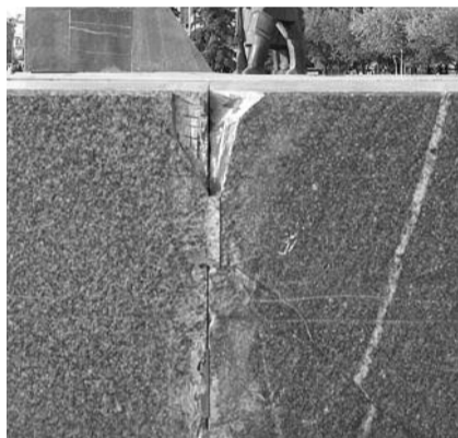
● НА ФОТО: ВАНДАЛОВ — К ОТВЕТУ!