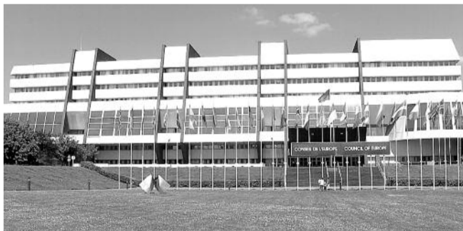
● НА ФОТО: ЕВРОПЕЙСКИЕ ПАРЛАМЕНТАРИИ НЕ ДОВЕРЯЮТ РОССИИ

На очередной сессии Парламентской ассамблеи Совета Европы в Страсбурге парламентарии проголосовали за резолюцию, в которой решили оставить Москву под мониторингом ее обязательств. В документе отмечается, что РФ не отменила де-юре смертную казнь, не выполнила резолюции ПАСЕ по «войне между Россией и Грузией» и не вывела войска из Молдавии.