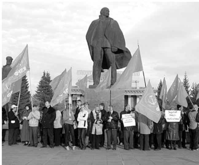
● НА ФОТО: КОММУНИСТЫ — НА ЗАЩИТУ ПАМЯТИ!