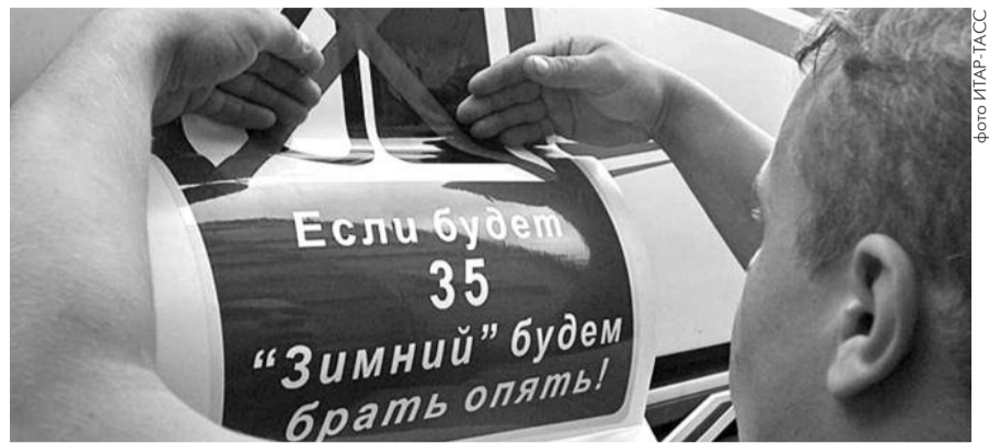
■ НА ФОТО: МОНОПОЛИСТЫ ИСПЫТЫВАЮТ ТЕРПЕНИЕ АВТОМОБИЛИСТОВ. НАДОЛГО ЛИ ХВАТИТ?

— Фестиваль направлен на пропаганду культурных ценностей. Исполнение молодежью комсомольских песен, в первую очередь, патриотической направленности, дает ей возможность ближе познакомиться с культурой предшествующих поколений, с нашей отечественной историей. Под эти