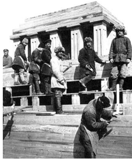
фото 1924 года

Секрет успеха белорусских каменщиков был в их невероятной точности, ведь технические возможности строительства в 1924 году были крайне ограниченные, и в распоряжении строителей были только мастерок, отвес, да собственный профес-