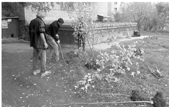
■ НА ФОТО: АКТИВИСТЫ ВЫСАДИЛИ 30 ДЕРЕВЬЕВ

После того как заявления попадают в Депутатский центр, формируется заявка в администрацию Октябрьского района, чтобы получить деревья в питомнике Новосибирского горзеленхоза. После того, как наша заявка была принята, в питомник выехали активисты Депутатского центра КПРФ и члены Октябрьского отделения ЛКСМ и перевезли саженцы до места проведения субботника. У дома нас уже ждали жители, которые помогали нам высаживать деревья.