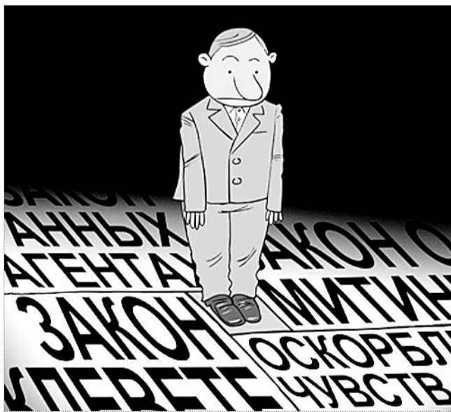
карикатура Сергея ЕПИКИНА / РОИП.РУ