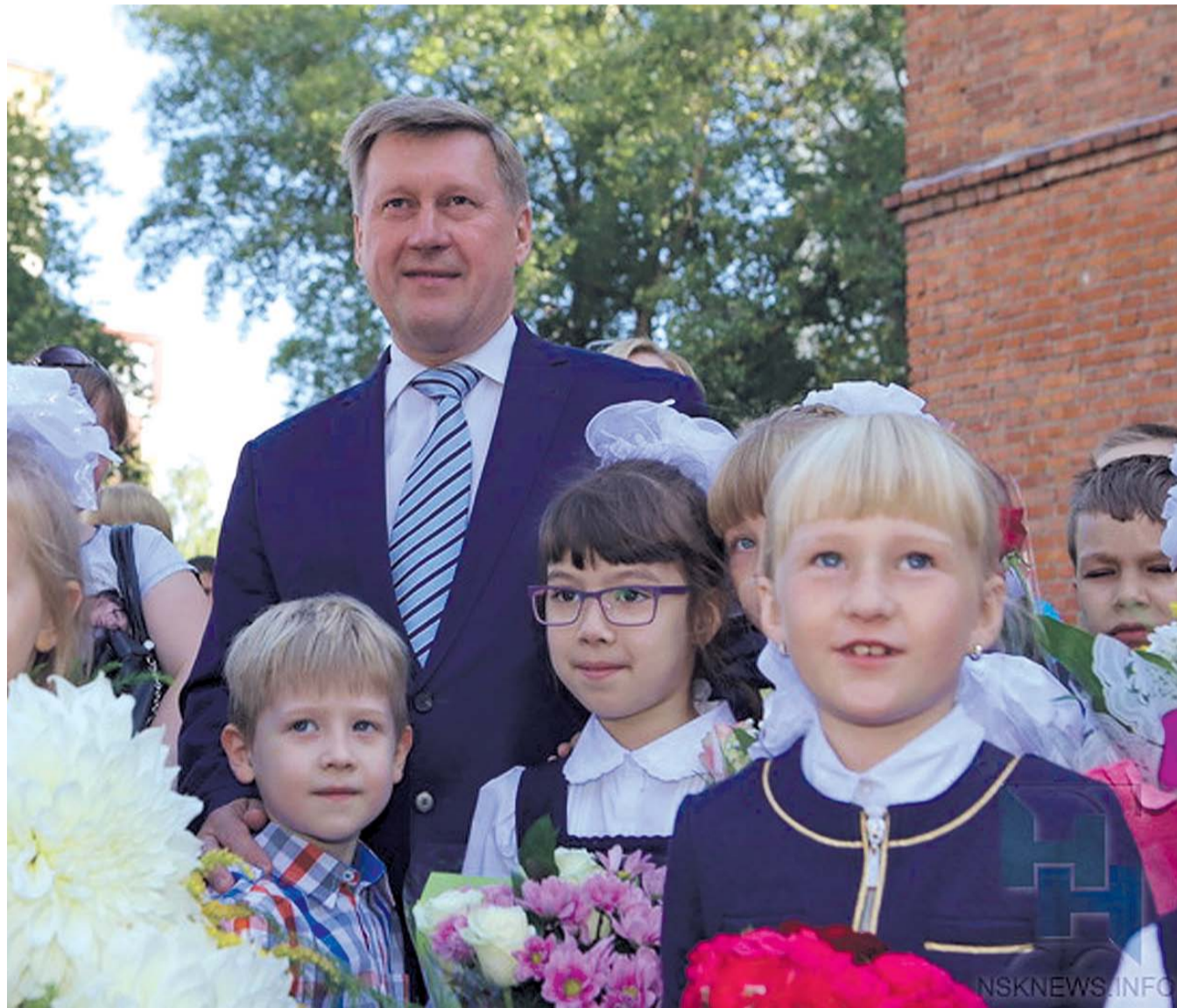
НА ФОТО: МЭР НОВОСИБИРСКА АНАТОЛИЙ ЛОКОТЬ ПОЗДРАВЛЯЕТ ШКОЛЬНИКОВ С ДНЕМ ЗНАНИЙ