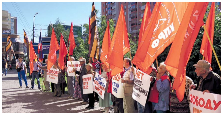
НА ФОТО: КОММУНИСТЫ ПИКЕТИРОВАЛИ КОНСУЛЬСТВО УКРАИНЫ В НОВОСИБИРСКЕ