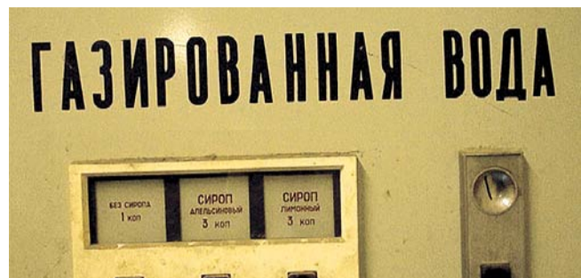
НА ФОТО: СИМВОЛ СТАБИЛЬНОСТИ И БЛАГОПОЛУЧИЯ

Захар ПРИЛЕПИН о том, что стоит за символами советского прошлого