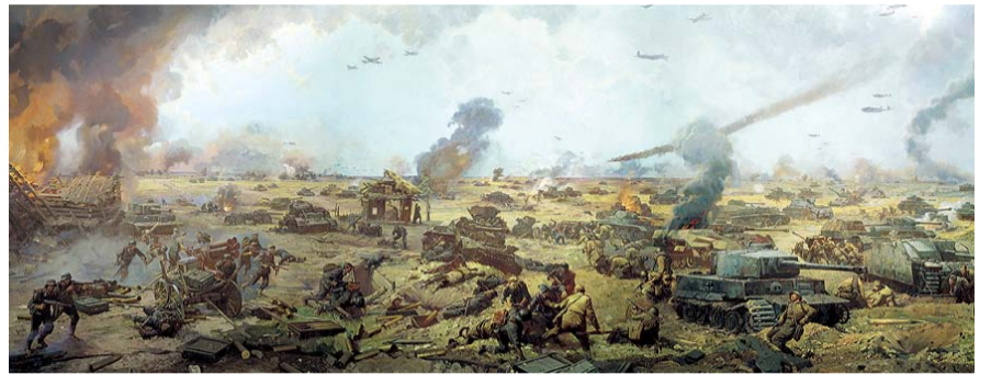
НА ФОТО: НА ПОЛЕ БИТВЫ

12 июля советские войска на Курской дуге перешли в наступление. В этот день в районе железнодорожной станции Прохоровка в 56 км к северу от Белгорода произошло самое круп-