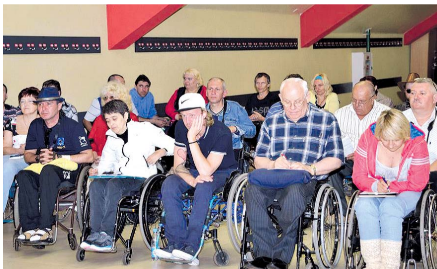
НА ФОТО: В НОВОСИБИРСКЕ СОЗДАДУТ КОМФОРТНУЮ СРЕДУ ДЛЯ ВСЕХ

При этом градоначальник не мог обойти стороной вопиющий случай с