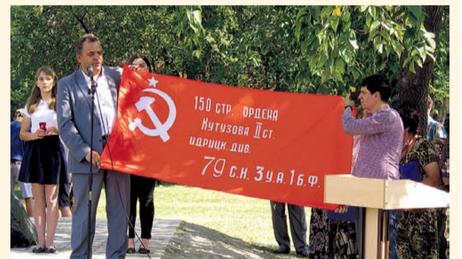
НА ФОТО: РЕНАТ СУЛЕЙМАНОВ ВРУЧИЛ КОПИЮ ЗНАМЕНИ ПОБЕДЫ

27 августа поселок Шахты Тогучинского района отмечал двойной праздник: День шахтера и День села. Поздравить шахтинцев приехал заместитель председателя Совета депутатов города Новосибирска, второй секретарь областного комитета КПРФ Ренат СУЛЕЙМАНОВ .