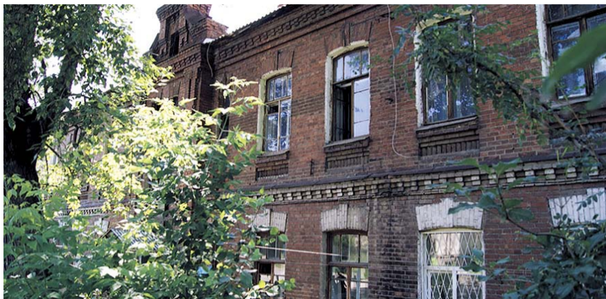
НА ФОТО: ОБВЕТШАВШИЕ ДОМА ДАВНО НУЖДАЮТСЯ В РЕМОНТЕ

Приказ заместителя министра обороны №472 поставил точку в проблеме, которую безуспешно пытались решить в течение 20 лет. Помочь жителям военного городка решить этот вопрос пообещала депутат Государственной думы Вера ГАНЗЯ — и сдержала свое обещание.