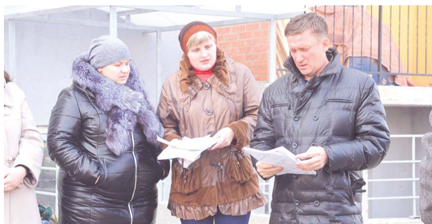
НА ФОТО: ЖИТЕЛИ «РАДУЖНОГО» ДЕЛЯТСЯ СВОИМИ БЕДАМИ С ЖУРНАЛИСТАМИ

Последняя экспертиза воды была сделана всего два месяца назад, и тогда результаты были вполне удовлетворительными. По словам жителей микрорайона, проблема возникает из-за того, что система водоочистки функционирует не полностью: в воду должны регулярно добавляться реагенты, которые кто-то на какие-то средства должен приобретать. На сегодняшний день вопрос, кто это будет делать и на чьи деньги, не решен.