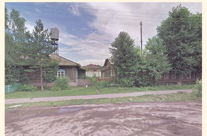
НА ФОТО: ОДИН БАРАК СНЕСЛИ, ВТОРОЙ ЖДЕТ СВОЕГО ЧАСА