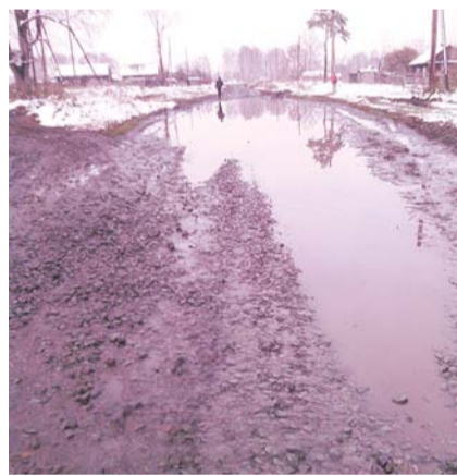
НА ФОТО: И ШКОЛЬНИКИ, И ФЕЛЬДШЕР...

Еще одна головная боль для романовцев в зимнее время — обеспечение села водой. Дело в том, что водокачка в Романово не автоматизирована: каждое утро в любую погоду работник по