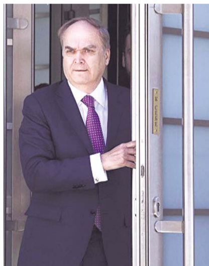
НА ФОТО: АНАТОЛИЙ АНТОНОВ

Другое событие, случившееся на днях с участием российского посла, и