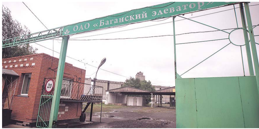
НА ФОТО: ОДИН ИЗ ЭЛЕВАТОРОВ, ПРОШЕДШИХ «ОЗДОРОВЛЕНИЕ»

Тем не менее, урожайность составила 19 центнеров с гектара — 3 млн тонн зерна. По подсчетам министерства, 1,074 млн тонн необходимо реализовать за пределами Новосибирской области — на 474 тысячи больше, чем в прошлом году. Традиционные партнеры находятся в Перми, Москве, Санкт-Петербурге, порядка 200 тысяч тонн планируется вывезти в Монголию и КНР. Но, когда в октябре основные районы закончили уборку урожая, начались проблемы: не хватало подвиж-