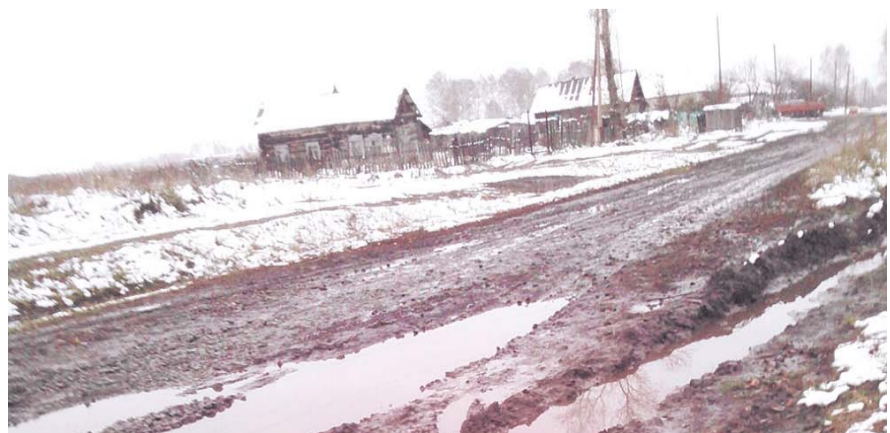
НА ФОТО: ...ХОДЯТ ПО ЭТИМ ДОРОГАМ, А XXI ВЕК ПРОЙТИ НЕ МОЖЕТ