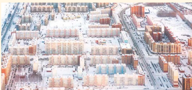
НА ФОТО: ГОРОДУ НУЖНЫ ИНВЕСТИЦИИ, ЧТОБЫ РАЗВИВАТЬСЯ