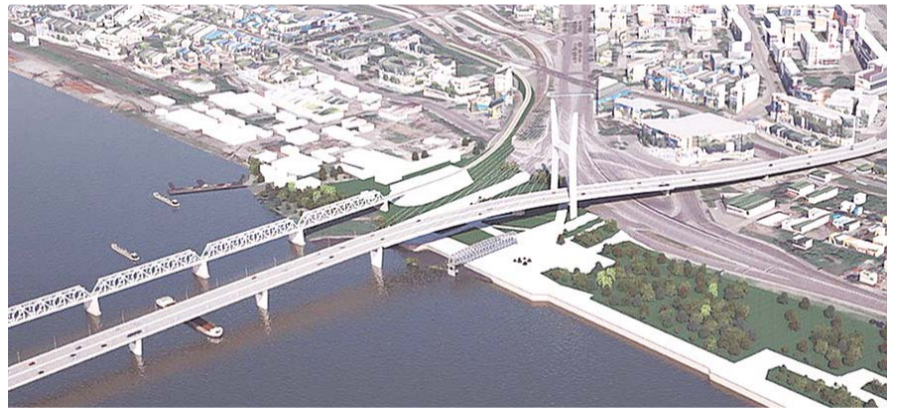
НА ФОТО: ПРОЕКТ ЧЕТВЕРТОГО МОСТА