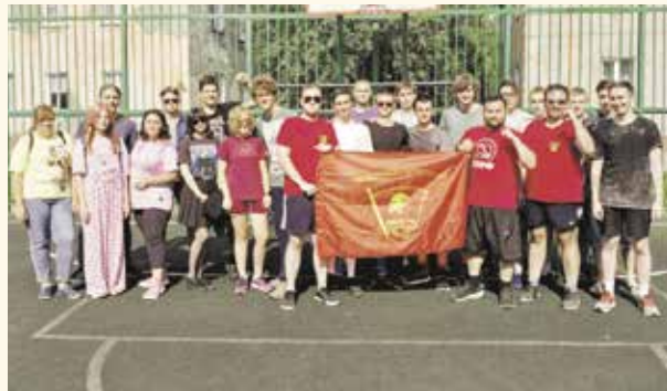
НА ФОТО: КОМСОМОЛЬСКИЙ АКТИВ НА СОРЕВНОВАНИИ

На выходных в Первомайском районе прошел футбольный турнир для членов новосибирского комсомола. Главной задачей соревнований, по словам организаторов, стало сплочение и укрепление традиций организации.