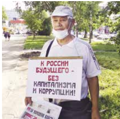
НА ФОТО: ОКТЯБРЬСКИЙ РАЙКОМ ПРИНЯЛ УЧАСТИЕ ВО ВСЕРОССИЙСКОЙ АКЦИИ

Пандемия коронавируса сделала невозможным проведение массовых мероприятий, но партийные активисты находят способ, чтобы высказать свою позицию. Так в Заельцовском районе