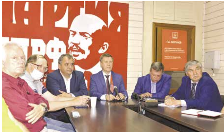
НА ФОТО: ЛИДЕРЫ НОВОСИБИРСКОГО ОБКОМА ПРИНИМАЮТ УЧАСТИЕ В ОНЛАЙН-СОВЕЩАНИИ ПО ВЫБОРАМ

— Нам с вами удалось успешно пройти три этапа предвыборной борьбы. Первый этап был связан с формированием нашей программы, начиная с Орловского экономического форума, подготовлены прекрасные материалы, которые описывают механизмы реального вывода страны из кризиса. Для нас принципиально поддержать