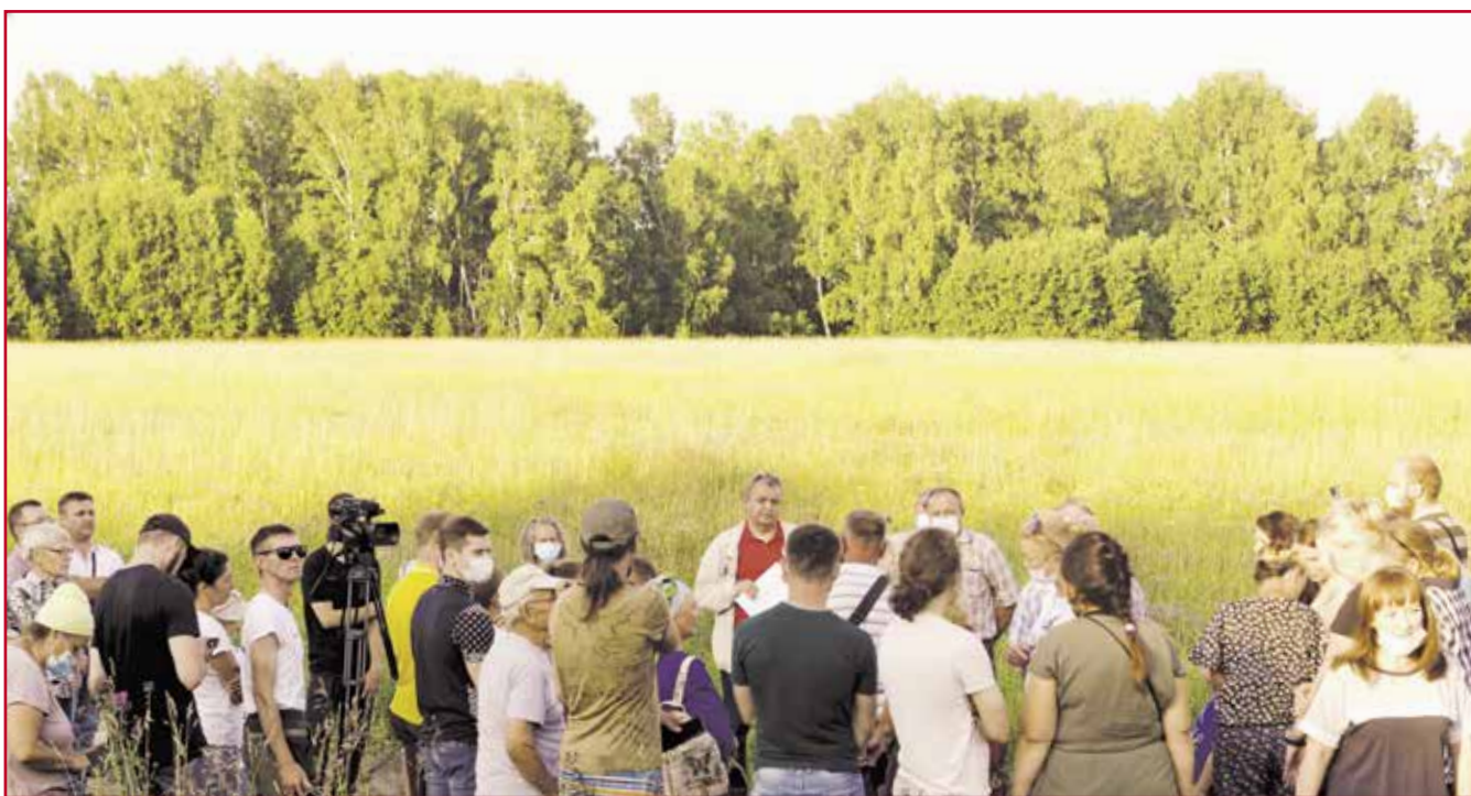
НА ФОТО: ОКОЛО СТА ЧЕЛОВЕК ВЫШЛИ НА ПРОТЕСТ ПРОТИВ СТРОИТЕЛЬСТВА МУСОРНОГО ПОЛИГОНА