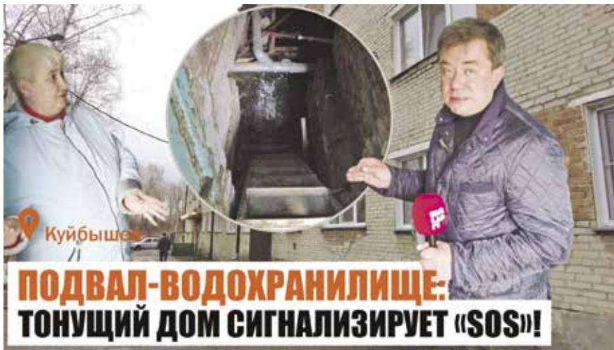
ПОДВАЛ-ВОДОХРАНИЛИЩЕ: ТОНУЩИЙ ДОМ СИГНАЛИЗИРУЕТ «SOS»!

Редакция YouTube-канала «Вацап-ТВ» снова посетила Куйбышев, чтобы разобраться с проблемой жителей дома, где подвал постоянно наполняется водой.