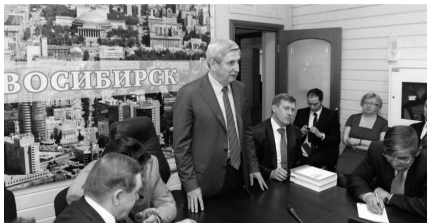
НА ФОТО: НА ВСТРЕЧЕ С АКТИВОМ ОРГАНИЗАЦИИ В ОБКОМЕ

— Сегодняшний визит для меня самый приятный. Но мы должны понимать, что выборы выиграть трудно,