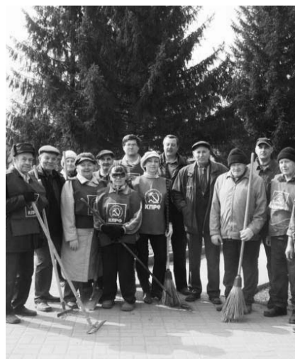
НА ФОТО: УЧАСТНИКИ СУББОТНИКА В ПЕРВОМАЙСКОМ РАЙОНЕ

Советский район . Жителей района работали в микрорайонах на закрепленных участках. Не оставили без внимания и территорию, прилегающую к зданию, где расположен районный комитет КПРФ и бюст Ленина.