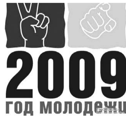
НА ФОТО: МОЛОДЕЖЬ ЕСТЬ, ПОЛИТИКИ НЕТ