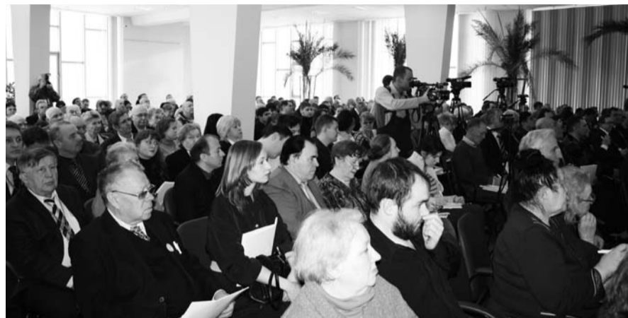
НА ФОТО: НАЛИЧИЕ ЗАПРОСА НА ШИРОКОЕ ОБЩЕСТВЕННОЕ ОБСУЖДЕНИЕ ПРОБЛЕМ И КЛЮЧЕВЫХ ВОПРОСОВ РАЗВИТИЯ ГОРОДА ПОКАЗАЛ ФОРУМ «БУДУЩЕЕ НОВОСИБИРСКА»

23 апреля состоялись сразу две сессии Горсовета. После внеочередной сессии, где принес присягу новый мэр, состоялась вторая, где обсуждался вопрос о поправках в правила проведения общественных слушаний в Новосибирске. Фактически депутатам Горсовета предложили внести две поправки, которые лишают общественные слушания в городе какого-либо смысла.