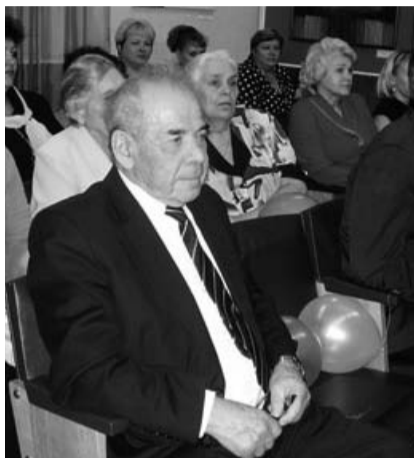
НА ФОТО: ОН ДО ПОСЛЕДНЕЙ МИНУТЫ РАБОТАЛ ДЛЯ ЛЮДЕЙ

10-я часть урожая области, 126 тыс. голов крупного рогатого скота, новые школы и сады, спорткомплекс