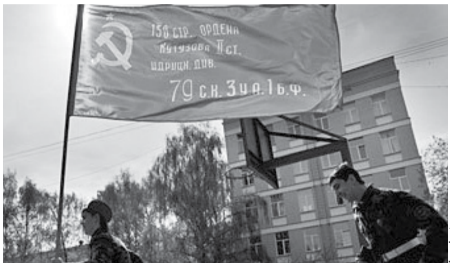
НА ФОТО: В МОСКВЕ ЗАКОН О ЗНАМЕНИ ПОБЕДЫ ВЫПОЛНЯЕТСЯ НЕУКОСНИТЕЛЬНО