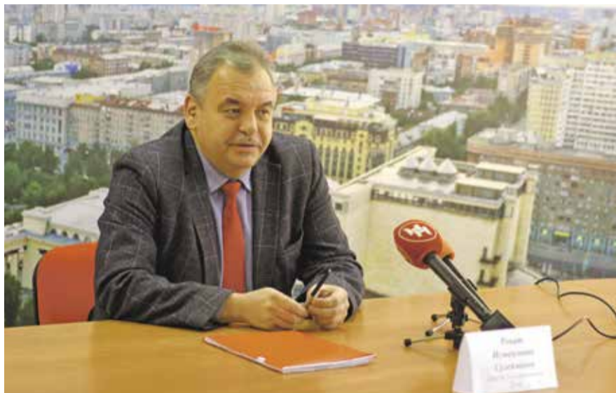
НА ФОТО: ДЕПУТАТ ГОСДУМЫ РФ ОТ НОВОСИБИРСКОЙ ОБЛАСТИ РЕНАТ СУЛЕЙМАНОВ

При этом снижаются расходы на социальную политику, здравоохранение, расходы на образование остаются на прежнем уровне, но в реальном выражении «тают» за счет инфляции. Из 14 разделов вложений в экономику сокращение происходит по