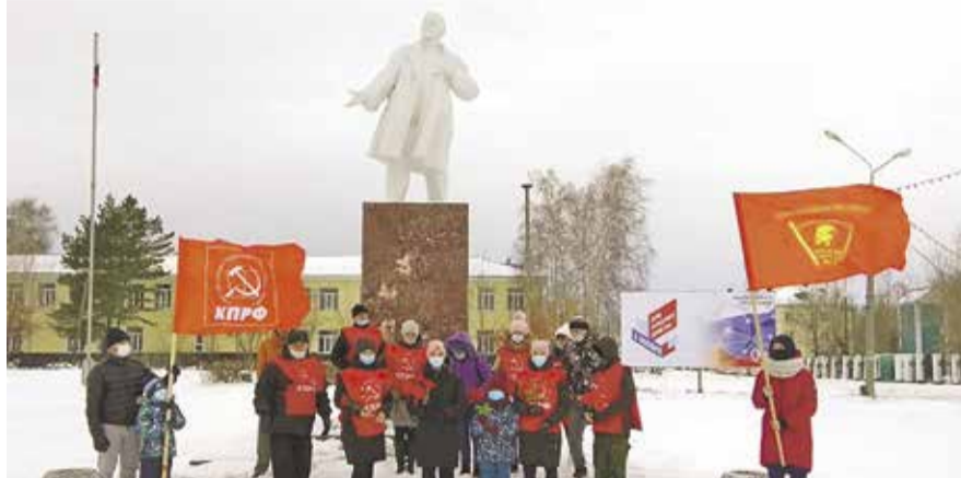
НА ФОТО: КОММУНИСТЫ БАРАБИНСКОГО МЕСТНОГО ОТДЕЛЕНИЯ КПРФ

Коммунисты возложили цветы к мемориалу героям Великой Отечественной войны, таким образом отдав дань памяти еще одному важному событию — 80-летию парада 7 ноября 1941 года в Москве. Его отмечают по всей стране, но при этом умалчивают, что он был посвящен 24-й годовщине Октябрьской революции, на что указал в своем выступлении Сталин: «Дух великого Ленина и его победоносное знамя вдохновляют нас теперь на Отечественную войну так же, как 23 года назад». Поэтому после возложения актив Краснообской первички