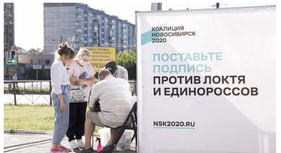
НА ФОТО: А КТО БУДЕТ ДУМАТЬ О ГОРОДЕ?