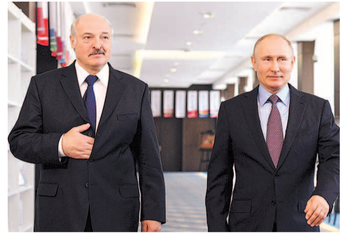
НА ФОТО: О ЧЕМ ОНИ ДОГОВОРЯТСЯ?

Путин может предложить Лукашенко вернуться к давней идее обра-