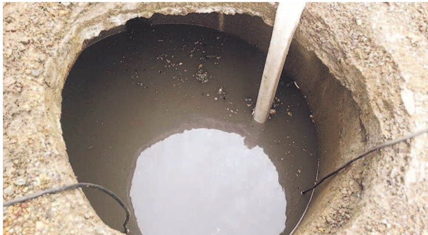
НА ФОТО: ДАЖЕ ГИБЕЛЬ ДЕТЕЙ НЕ ИСПРАВИЛА СИТУАЦИЮ С ВОДОПРОВОДОМ В КОЛЫВАНИ

Муниципальный контракт на строительство водопровода в селе Кандаурово был заключен администрацией Колыванского района и компанией ООО «БурСиб-Н» еще осенью 2018 года. На реализацию проекта выделили миллионы рублей из бюджета, однако подрядчик справился со своей задачей только на бумаге. Впрочем, это не мешало коммерсантам получить деньги.