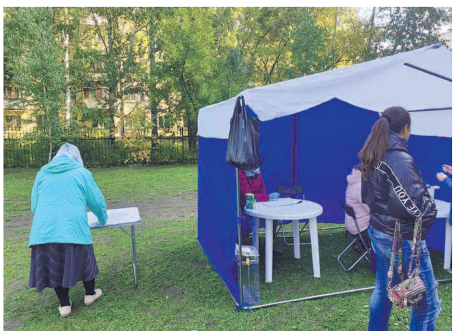
НА ФОТО: ГОЛОСОВАНИЕ «НА ПЕНЬКЕ»

Оппоненты КПРФ испугались своего бессилия перед кандидатами от Компартии. Вынуждены они были пойти на крайние меры — купить всех и вся. Особенно это было видно в Заельцовском районе, где «Лига эффективности» решила раздать