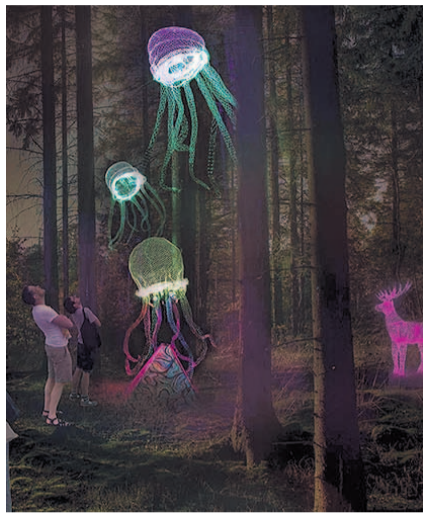
НА ФОТО: ПРОЕКТ НЕОНОВОГО ПАРКА

— Еще один нюанс — это разделение зон пешеходных, зон велодорожек,