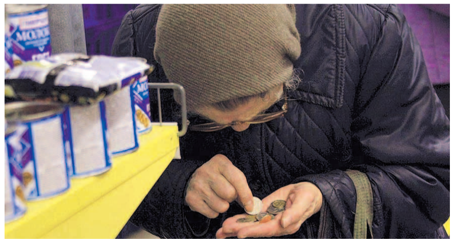
НА ФОТО: ЦЕННОСТЬ РУБЛЯ ПАДАЕТ С КАЖДЫМ ДНЕМ

Видимо, эксперты говорят о повышении реальных доходов только за счет выхода из коронавирусных ограничений. На снижение реальных доходов населения и в предыдущие годы ощути-