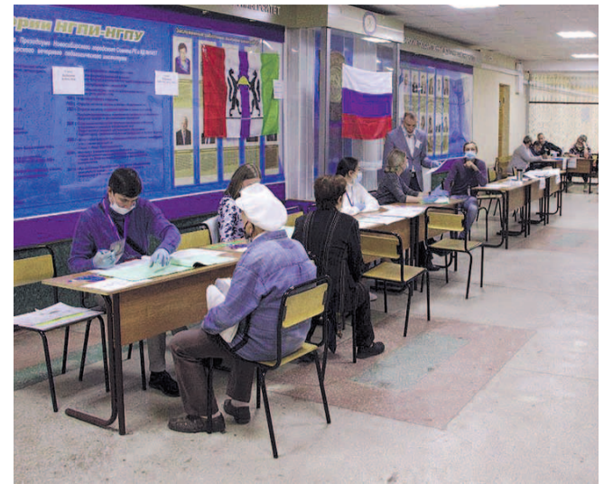
НА ФОТО: В НОВОСИБИРСКОЙ ОБЛАСТИ ЗАВЕРШИЛИСЬ ВЫБОРЫ

Границы округов, на которых были депутатами коммунисты, значительно изменились, что, в том числе, негативно повлияло на результат. Еще один фактор, который повлиял на результат, — наличие партий-спойлеров, в таком количестве их не было давно. «Партия пенсионеров», которая прошла в Заксо-