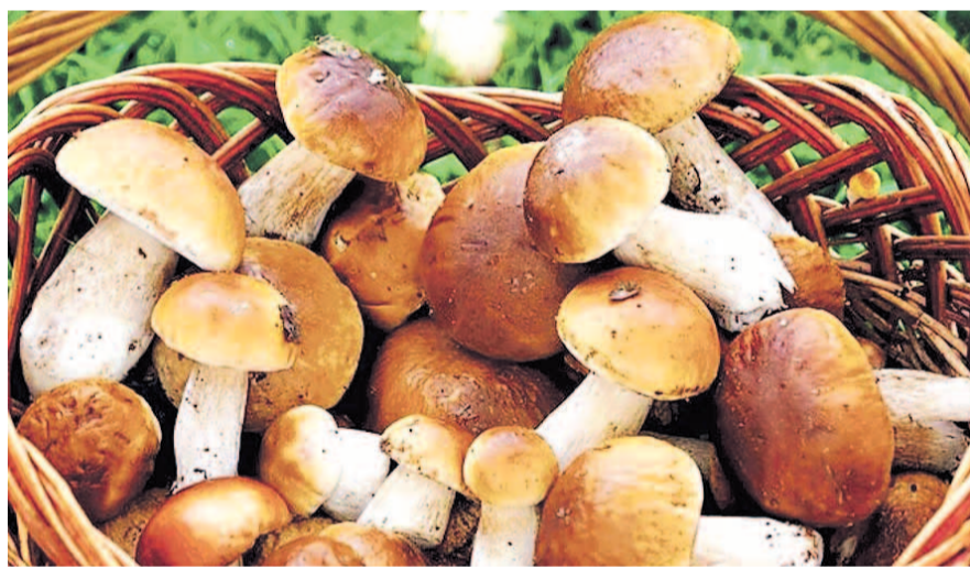
НА ФОТО: НЫНЕШНЯЯ ОСЕНЬ БОГАТА ГРИБАМИ

Настоящие лисички растут на полянках большими колониями. Шляпка у них рыжая с волнистыми краями,