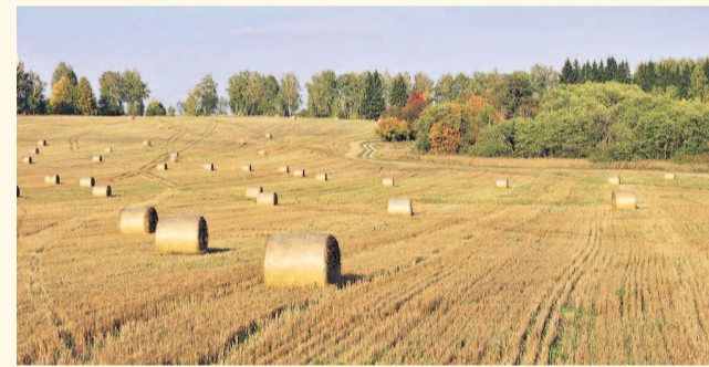
НА ФОТО: УБОРКА УРОЖАЯ ИДЕТ ПОЛНЫМ ХОДОМ