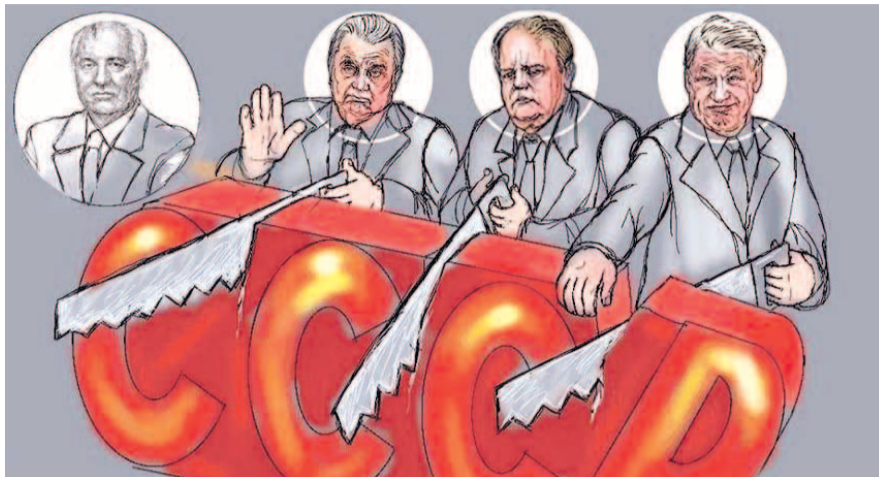
НА ФОТО: ПРИНЦИП СТАР: РАЗДЕЛЯЙ И ВЛАСТВУЙ

12 декабря 1991 года лауреат Нобелевской премии оправдывался: «Я думал, что пьянка в лесу закончится, как всегда: песнями, плясками, игрой Бориса на алюминиевых ложках. Но эта троица совсем перепилась. Это ненормально, но пусть идет процесс». 25 декабря М. Горбачев ушел в отставку и уехал на свою виллу в Швейцарию, а