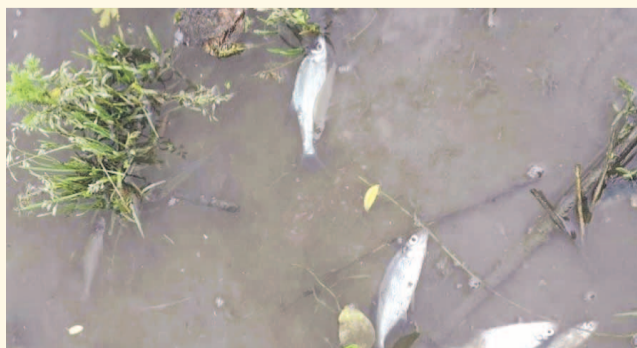
НА ФОТО: РЫБА В РЕКЕ ГИБЛА ИЗ-ЗА НЕЗАКОННЫХ СБРОСОВ