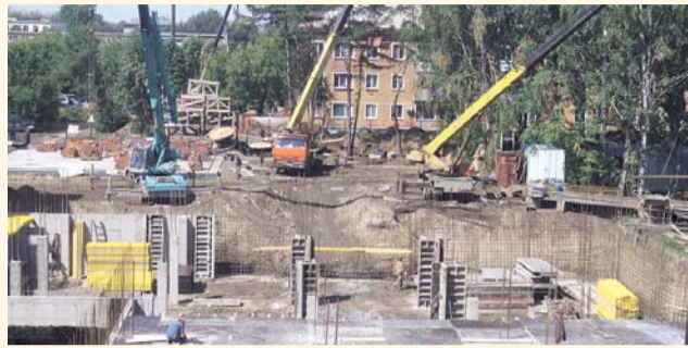
НА ФОТО: СТРОИТЕЛЬСТВО ИДЕТ ПОЛНЫМ ХОДОМ

Новое здание 155-й школы строится по федеральной программе. По словам «красного мэра», 1 сентября в этом здании уже должен начаться учебный процесс.