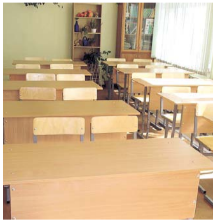
НА ФОТО: ШКОЛА ИЛИ ФИЛИАЛ?