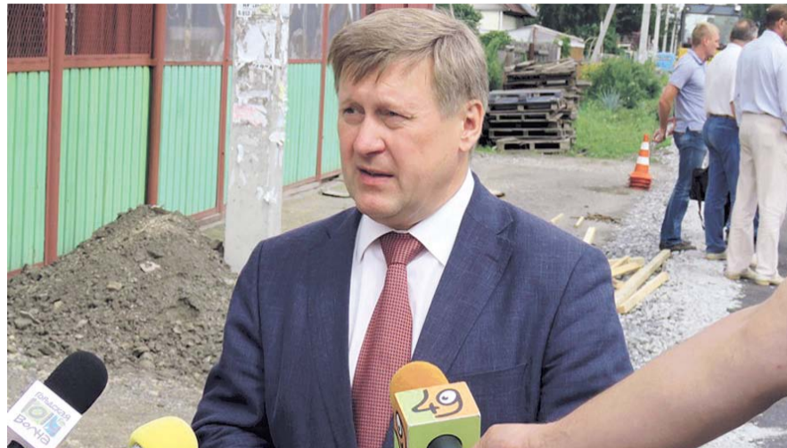
НА ФОТО: АНАТОЛИЙ ЛОКОТЬ ЛИЧНО КОНТРОЛИРУЕТ БЛАГОУСТРОЙСТВО ЧАСТНОГО СЕКТОРА

с водоотведением, ведь бич частного сектора — это распутица, от которой будет сыпаться весь этот асфальт, весь этот гравий, — объяснил журналистам Анатолий Локоть.