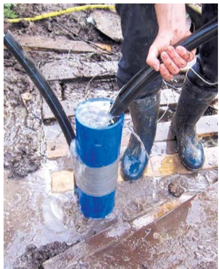
НА ФОТО: ВОДОПРОВОД ТРЕБУЕТ РЕМОНТА

Однако, самым обсуждаемым и набравшим вопросов стала ситуация с обеспечением райцентра питьевой водой. Как уже рассказывал КПРФНск ранее, износ коммуникаций здесь составляет 85%. Средств на их замену у муници-