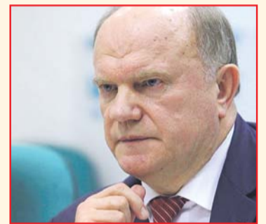
НА ФОТО: ГЕННАДИЙ ЗЮГАНОВ

Мне казалось, что новый состав Думы, чувствуя обстановку, видя, что нас обложили санкциями, что вокруг России пороховые бочки от Прибалтики, Украины до Ближнего Востока, поймет, что необходимо сплочение общества на идеях созидания, труда, качественного образования, медицинского обслуживания, уважения к женщинам, детям, старикам. Но, тем не менее, мы в четвертый раз вносим закон о детях войны и получаем очередной отказ. Правда, 23 региона, куда мы отправили наш закон, приняли это решение на местном уровне. Недавно принято решение в Иркутской области, которую возглавляет коммунист Сергей Левченко. На эти цели выделено более 300 млн. рублей.