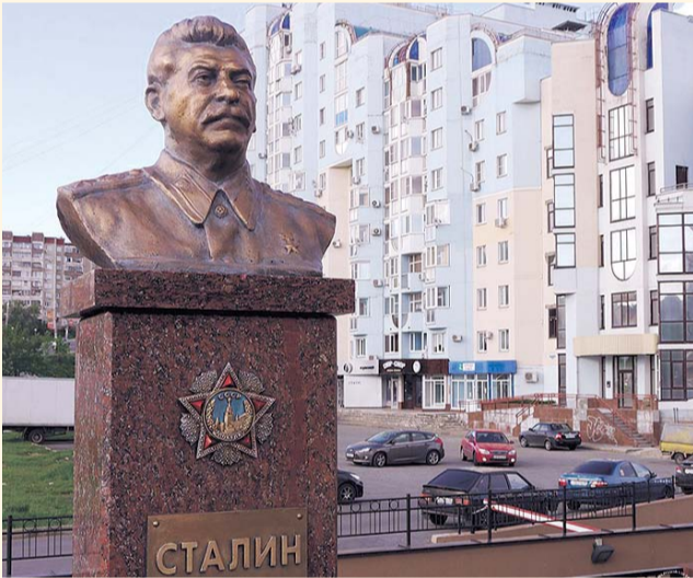
НА ФОТО: ЛЮДИ ПОМНЯТ СТАЛИНА