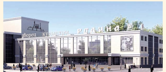
НА ФОТО: ЗА БЛЕСТЯЩИМ ФАСАДОМ — СОВРЕМЕННЫЙ РЕМОНТ