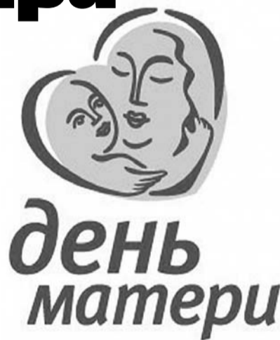
НА РИС.: БУДЕТ ОТМЕЧАТЬСЯ 24 НОЯБРЯ

— Падение нравов, засилье псевдокультуры, формирование извращенных понятий не могут не волновать общество, государство. Одним из