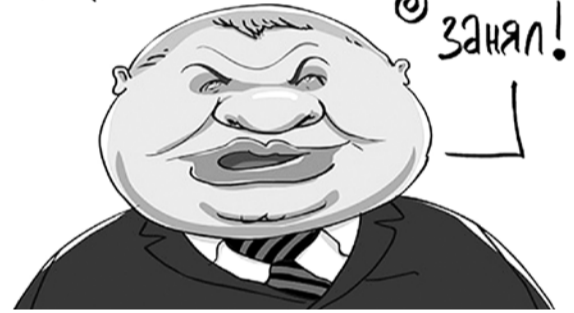
НА РИС.: СЕРДЮКОВУ НАШЛИ НОВОЕ «ТЕПЛЕНЬКОЕ» МЕСТЕЧКО

Вот только на минутку отвернулся, а какой-то шойгу место занял!