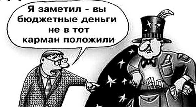
НА РИС.: СЛУЖЕБНЫЙ ПОДЛОГ В КОЛЫВАНСКОМ ДЕТСКОМ САДУ ОБНАРУЖИЛ КОЛЛЕКТИВ

Помимо уборщика, как узнали сотрудники, «мертвые души» занимали должности сторожа, педагога дополнительного образования и некоторые другие, уволенные сразу же после