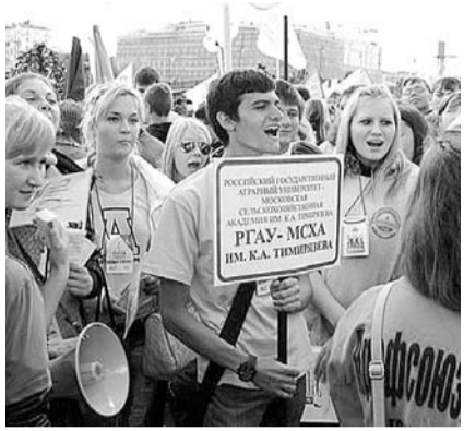
НА ФОТО: ЭТО РАЗВЯЖЕТ РУКИ РУКОВОДИТЕЛЯМ ВУЗОВ В ПЛАНЕ ИДЕОЛОГИИ

Вообще инициатива совета ректоров вузов Петербурга о создании в вузах специальных советов «для усиления работы со студентами в области идеологии» в принципе не является каким-то новаторством. То, что со студентами в вузах проводится определенная работа, направленная на формирование «правильной» с точки зрения власти политической позиции и «правильного» отношения к этой самой власти — давно не секрет. Достаточно хотя бы вспомнить проводимые перед или после выборов митинги в поддержку правящего курса, на которых студентам, мобилизованным стараниями ректоров и деканатов, наряду с бюджетниками, отводится роль основной массовки. Еще пример — управляемое голосова-