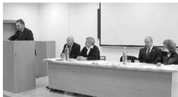
НА ФОТО: В ПРЕЗИДИУМЕ СЪЕЗДА

В поселке Краснообск по инициативе Новосибирского райкома КПРФ состоялся съезд депутатов районного и сельских Советов.