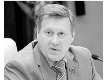
НА ФОТО: АНАТОЛИЙ ЛОКОТЬ В ГОСУДАРСТВЕННОЙ ДУМЕ

Депутат от Новосибирской области Анатолий ЛОКОТЬ потребовал провести парламентское расследование дела «Рособоронсервиса» и установления в нем роли СЕРДЮКОВА на пленарном заседании Госдумы во вторник. Ситуация, когда вопиющим фактам не дается должной оценки, не устраивает никого.