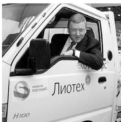
НА ФОТО: ЗА РУЛЕМ — АНАТОЛИЙ ЧУБАЙС

шоу-центр» выиграл конкурс на организацию ряда мероприятий форума «Технопром».