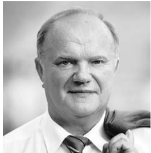
НА ФОТО: ЛИДЕР КПРФ

Этот вопрос станет основным в повестке дня предстоящего пленума Новосибирского обкома КПРФ. Напомним, что национальный вопрос стал главным вопросом уже прошедшего пленума ЦК КПРФ, который после доклада Председателя ЦК КПРФ Геннадия ЗЮГАНОВА обсудили делегаты из всех российских регионов.