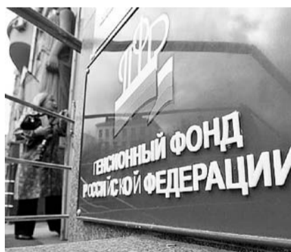
НА ФОТО: ПЕНСИЯ ТЕПЕРЬ БУДЕТ В БАЛЛАХ

— Граждане с большими доходами не пострадают: 15 лет работы — и у них есть страховая пенсия. А малообеспеченные граждане рискуют к 60-летнему возрасту не получить право на пенсию