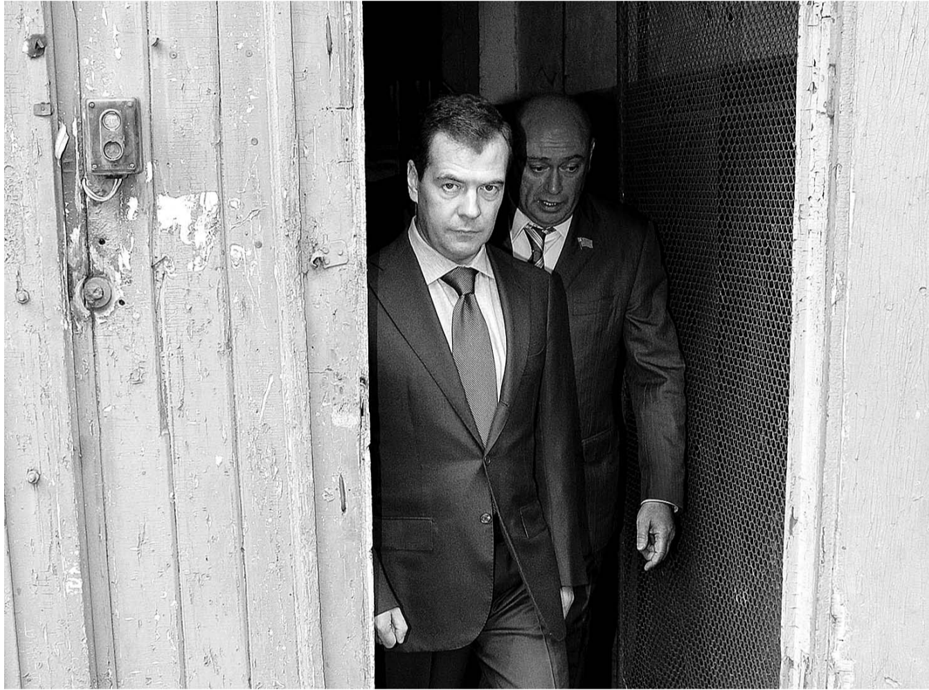
НА ФОТО: ПРЕМЬЕР МЕДВЕДЕВ ПРЕДЛОЖИЛ БРАТЬ С РОССИЯН ПРЕДОПЛАТУ ЗА УСЛУГИ ЖКХ