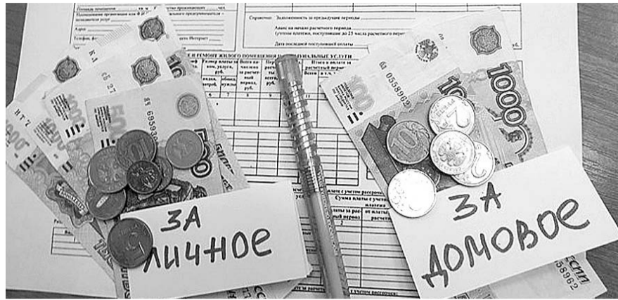
НА ФОТО: В СФЕРЕ ЖКХ СТОЛЬКО НОВОВВЕДЕНИЙ — НЕ УСПЕВАЕШЬ РАЗБИРАТЬСЯ!

15 ноября, прямо во время работы международного форума технологического развития «Технопром», новосибирские следователи провели выемку документов в офисе московской компании «Арт-шоу-центр» в связи с расследованием уголовного дела по хищениям на форуме «Интерра». «Арт-