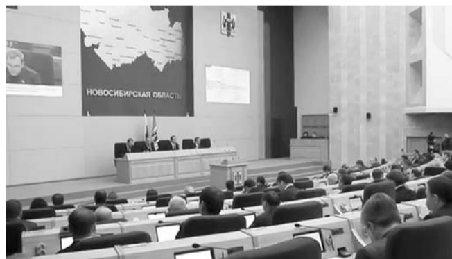
НА ФОТО: ИДЕТ СЕССИЯ ЗАКОНОДАТЕЛЬНОГО СОБРАНИЯ ОБЛАСТИ

— Я уверен, что все знают проблему с финансированием капремонта. Новый порядок, описанный в законе, который мы недавно принимали, скоро начнет действовать. Ожидания лю-