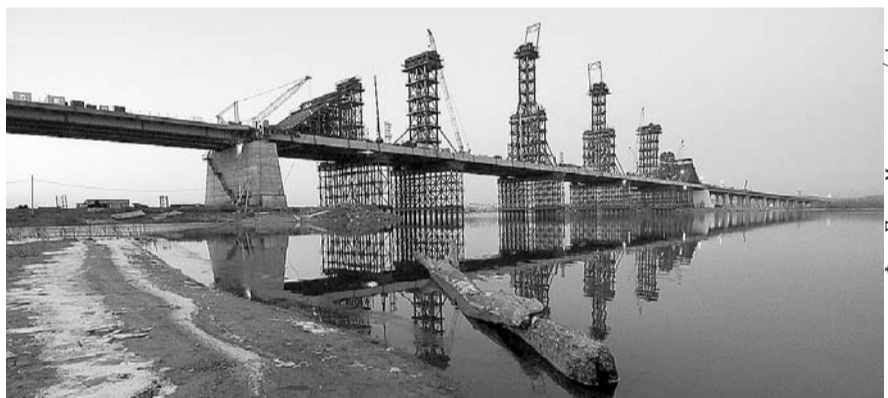
НА ФОТО: В БЮДЖЕТЕ НЕ ЗАЛОЖЕНО СОФИНАНСИРОВАНИЕ СТРОИТЕЛЬСТВА МОСТА