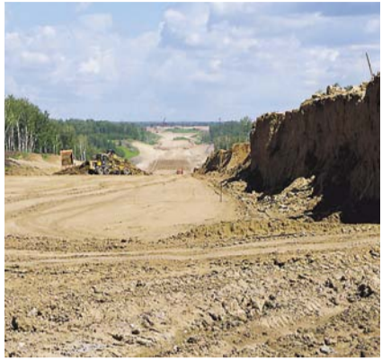
НА ФОТО: БУДЕТ ЛИ ВОСТОЧНЫЙ ОБХОД СДАН В СРОК?

Работы на крупнейшей дорожной стройке Новосибирской области — Восточном обходе — остановлены на нескольких участках. 15 компаний не получили расчет за работу на стройке, накопившийся перед ними долг составляет около 100 миллионов рублей. Произошло это из-за одного из субподрядчиков — группы компаний «Инфраструктура».