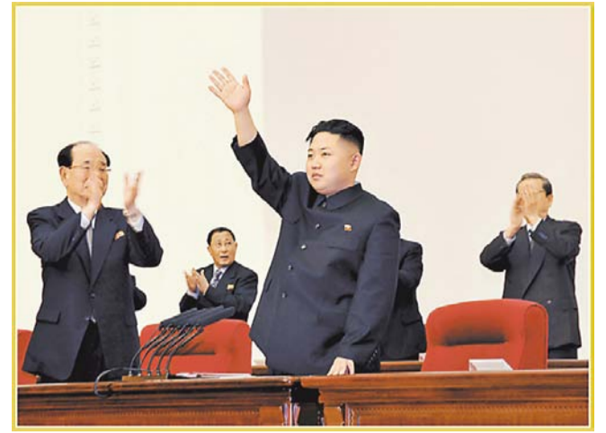
НА ФОТО: УВАЖАЕМЫЙ КИМ ЧЕН ЫН ИЗБРАН ПЕРВЫМ СЕКРЕТАРЕМ ТПК НА IV КОНФЕРЕНЦИИ ТПК (АПРЕЛЬ 2012 Г.)

Однако корейцы, монолитно спаянные вокруг Ким Чен Ира, под руководством ТПК, всесторонне проводящей сонгунскую политику, встали на защиту социализма. Под руководством партии корейский народ не только защитил социализм в крайне трудной обстановке, но и даже создал трамплин для строительства могучего и процветающего государства. В августе 1998 г. успешно запущен первый корейский ИСЗ «Кванменсон-1» стопроцентно отечественного производства, что удивило людей всего мира. Это было равноценно