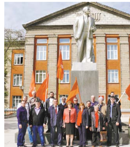
НА ФОТО: ОБНОВЛЕННЫЙ ПАМЯТНИК ЛЕНИНУ В ЛЕНИНСКОМ РАЙОНЕ