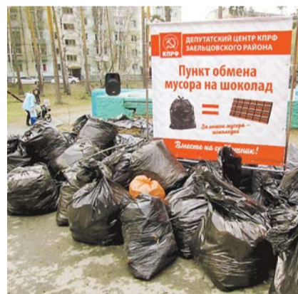
НА ФОТО: АКЦИЯ ЗАЕЛЬЦОВСКИХ КОММУНИСТОВ

у главного памятника героям Великой Отечественной войны в Новосибирске — Монумента Славы. Коммунисты украсили военную технику флагами КПРФ и ЛКСМ, Знаменем Победы — и работа началась. Каждый выполнял свое поручение честно и добросовестно, в итоге удалось освежить этот сегмент мемориального комплекса.