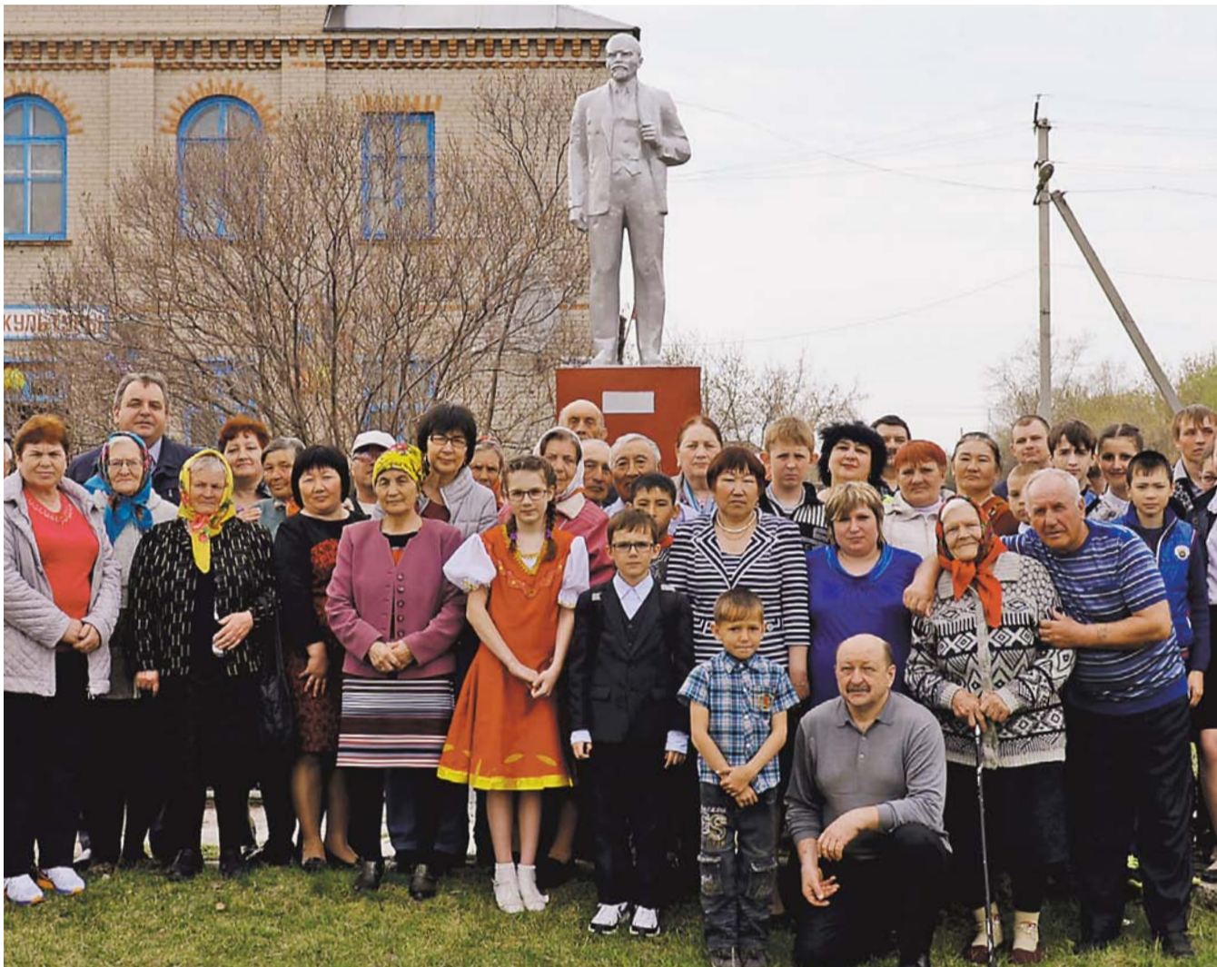
НА ФОТО: БОЛЕЕ СТА ЖИТЕЛЕЙ СЕЛА СВЕТОЕ ПРИШЛИ НА ОТКРЫТИЕ ПАМЯТНИКА