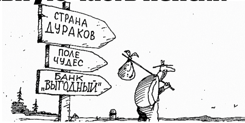
НА РИС.: С 1 ЯНВАРЯ 2014 ГОДА ПФР АННИЛИРУЕТ НАКОПИТЕЛЬНУЮ ЧАСТЬ ПЕНСИИ

«Новые известия» напоминают, что в конце 2012 года в пенсионное законодательство были внесены поправки, перераспределяющие страховые взносы в Пенсионный фонд. Речь идет о 22% от фонда оплаты, отчисляемых работодателем. Для россиян, родившихся раньше 1967 года, из этих 22% формируется только страховая часть: 6% идет на солидарную часть, а 16% — на индивидуальную часть тарифа. У родившихся в 1967 году и позже 16% идет на страховую часть, а 6% — на накопительную часть пенсии. С 2014 года в этой схеме произойдут изменения — отчисления на накопительную часть будут существенно урезаны. Причем если раньше планировалось, что они снизятся до 2%, а высвобожденные 4% будут перераспределены в страховую (солидарную) часть тарифа, то вчера стало известно, что речь уже идет о том, что накопительная часть сократится до 0%, а все 6% перейдут в страховую часть.