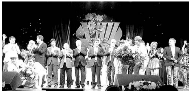
НА ФОТО: ФЕСТИВАЛЬ «МОЛОДЕЖЬ — ЗА СОЮЗНОЕ ГОСУДАРСТВО!»

— Каждое заседание мы пытаемся продвигать этот вопрос, — говорит Анатолий ЛОКОТЬ , — потому что он постоянно стопорится, причем именно российской стороной, правительством Российской Федерации. Но если мы не можем решить проблемы социальных гарантий в отношении хотя бы тех людей, которые занимаются воссозданием Союзного Государства, то что можно говорить о тех жителях Беларуси, что приезжают в Россию, где сталкиваются со всеми «прелестями» нашего пенсионного, социального законодательства, в то время как белорусская сторона все эти гарантии строго соблюдает?