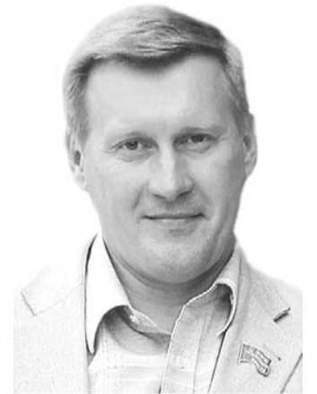
НА ФОТО: АНАТОЛИЙ ЛОКОТЬ

В Ростове-на-Дону проходит заседание комиссии Парламентского Собрания по социальной политике, науке, культуре и гуманитарным вопросам под председательством депутата Государственной думы и первого секретаря Новосибирского обкома КПРФ Анатолия ЛОКОТЬ.