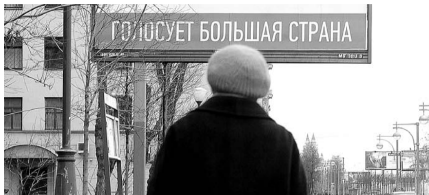
НА ФОТО: ПЕРЕНΟΣ ВЫБОРОВ СОЗДАСТ ЕЩЕ БОЛЬШИЕ ПРЕИМУЩЕСТВА ДЛЯ «ПАРТИИ ВЛАСТИ»