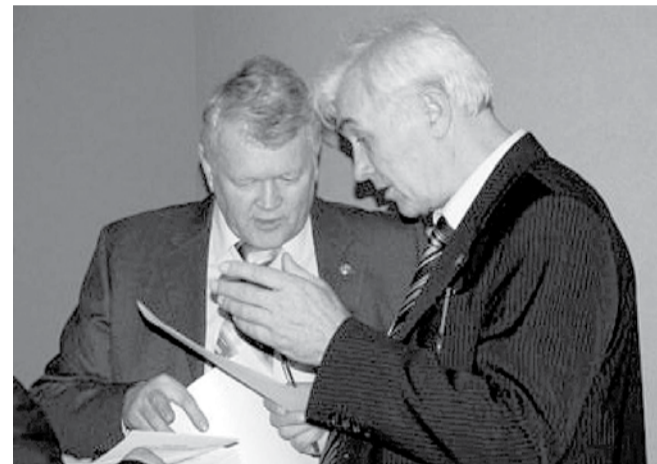
НА ФОТО: ПРЕДСЕДАТЕЛЬ СО РАН АЛЕКСАНДР АСЕЕВ И НИКОЛАЙ ЛЯХОВ (СЛЕВА НАПРАВО)

— Академия наук активно финансирует социальную сферу Советского района. Доходы от научной деятельности постоянно растут. Половину инвестированного в СО РАН мы тратим в городе Новосибирске, — рассказал Ляхов. — Нас обвиняют в старости и неэффективности, но факты показывают, что это не так.