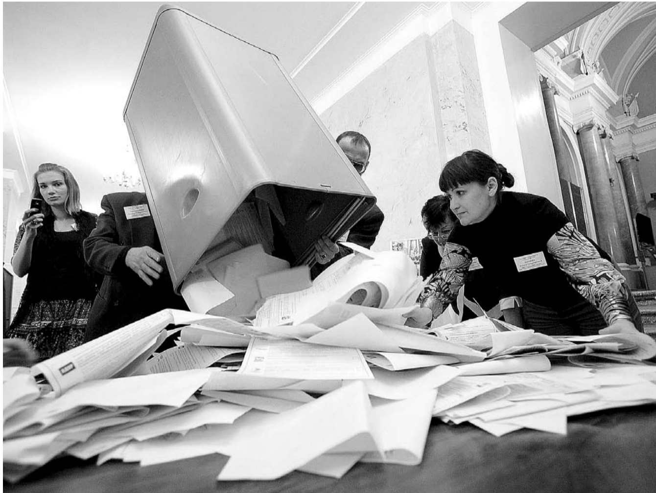
НА ФОТО: АДМИНИСТРАЦИЯ ПРЕЗИДЕНТА РЕШИЛА УЗАКОНИТЬ ИСПОЛЬЗОВАНИЕ АДМИНИСТРАТИВНОГО РЕСУРСА НА ВЫБОРАХ