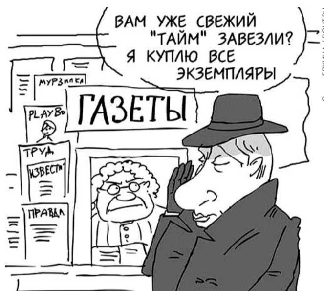
● НА РИС.: УПРАВЛЯЕМАЯ СВЕРХУ СВОБОДА СЛОВА