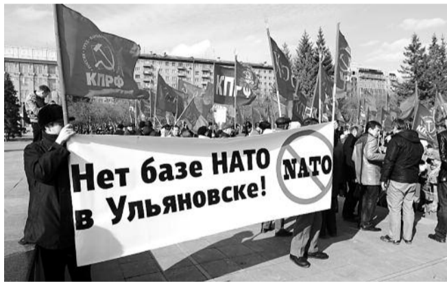
■ НА ФОТО: НАТО НАМ НЕ НАДО!

На сессии Совета депутатов города Новосибирска в среду обсуждался вопрос «Об обращении Совета депутатов города Новосибирска в связи с предложением о размещении перевалочного пункта НАТО в городе Ульяновске». Ранее данная инициатива фракции КПРФ получила отрицательное заключение в комиссии Горсовета по местному самоуправлению, однако в соответствии с регламентом его были вынуждены вынести на сессию. В итоге случилась редкая для муниципального парламента ситуация — ряд депутатов, в том числе и из фракции «Единая Россия», поддержали коммунистов и не дали отклонить инициативу. Однако и принимать данное обращение не стали, отправив его на доработку в комитет по местному самоуправлению.