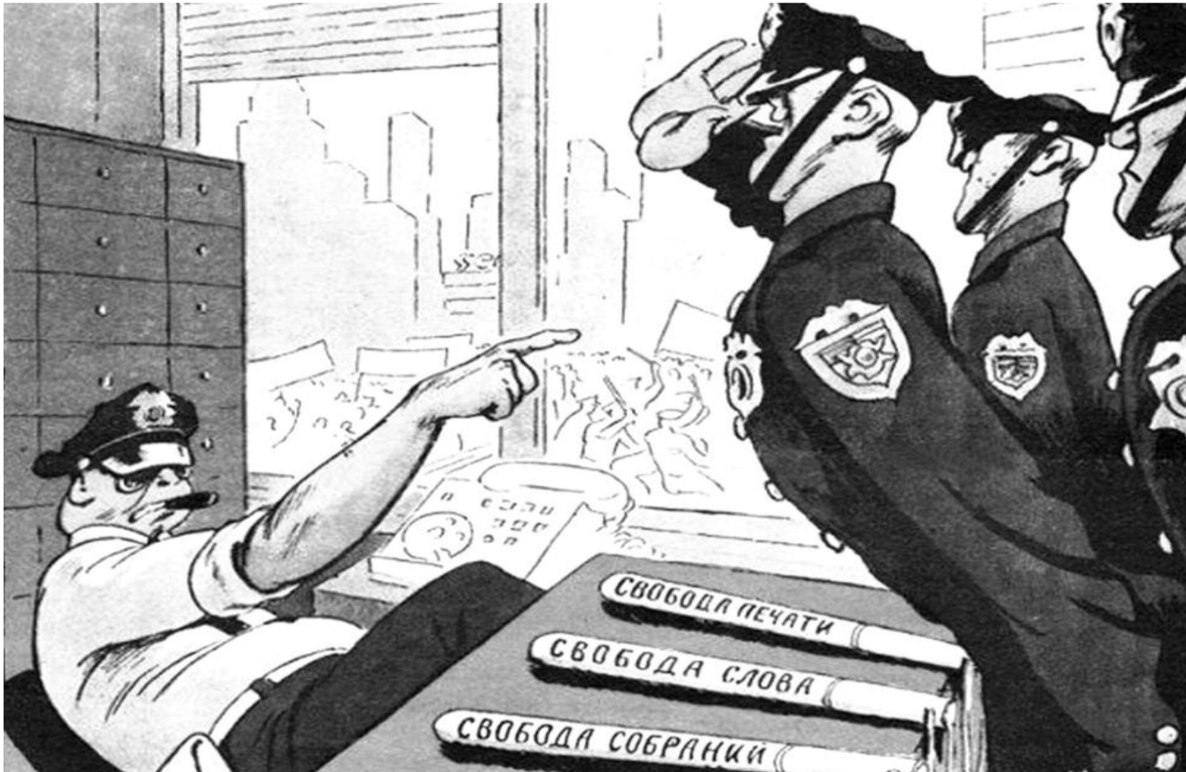
● НА РИС.: «ВКОЛАЧИВАЙТЕ, СЕРЖАНТ, В ГОЛОВЫ ДЕМОСТРАНТОВ ОСНОВНЫЕ СТАТЬИ НАШЕЙ КОНСТИТУЦИИ»