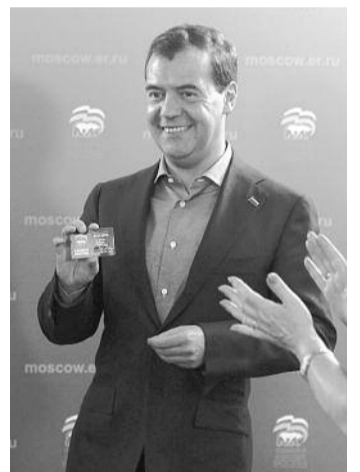
● НА ФОТО: МЕДВЕДЕВ ПРИНЯЛ НА СЕБЯ «ПОНОШЕННЫЙ КАФТАН»

Во вторник премьер-министр правительства РФ, а еще недавно президент страны Дмитрий МЕДВЕДЕВ окончательно принял на себя «поношенный кафтан», доставшийся ему от ПУТИНА . Медведев вступил в «Единую Россию», получив партбилет в одном из первичных отделений Москвы. Как отмечают СМИ, Медведев, таким образом, стал первым партийным премьер-министром в новейшей истории.