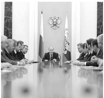
● НА ФОТО: НОВЫЙ КАБИНЕТ МИНИСТРОВ

Первым вице-премьером останется Игорь ШУВАЛОВ, зампредами правительства стали Владислав СУРКОВ, Дмитрий РОГОЗИН, Аркадий ДВОРКОВИЧ, Ольга ГОЛОДЕЦ, Дмитрий КОЗАК и полномочный представитель президента в СКФО Александр ХЛОПОНИН. Свои посты сохранили «птенец кудринского гнезда» министр финансов Антон СИЛУАНОВ, министр иностранных дел Сергей ЛАВРОВ и одиозный министр обороны Анатолий СЕРДЮКОВ, неприятие которого в армии просто зашкаливает. Виталий МУТКО по-прежнему будет возглавлять Минспорттуризма. Министром внутренних дел вместо Рашида НУРГАЛИЕВА назначен началь-