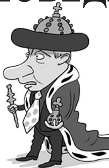
● НА РИС.: А КОРОЛЬ-ТО ГОЛЫЙ!

9 мая к традиционному многотысячному шествию КПРФ от Пушкинской к Лубянской площади присоединились «гуляющие» оппозиционеры. Сайт КПРФ подвергался массовой DDoS-атаке в течение двух дней. После окончания митинга белоленточная оппозиция направилась на Чистые пруды, где объявила бессрочный протест. У памятника Абаю разбит лагерь. 13 мая либеральная интеллигенция вывела на «Контрольную прогулку» по бульвар-