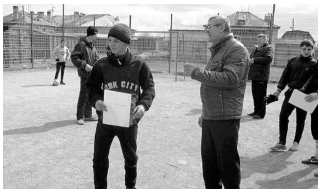
■ НА ФОТО: НА ТУРНИРЕ В БОЛОТНОМ. ГРАМОТЫ — ПОБЕДИТЕЛЯМ

8 мая коммунисты Болотнинского района провели спортивное соревнование по мини-футболу среди дворовых команд подростков города Болотного на спортивной площадке квартала Нечетный парк. Соревнования были посвящены Дню Победы в Великой Отечественной войне и памяти болотнинцев, павших на фронтах войны.