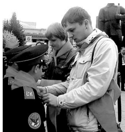
■ НА ФОТО: НАШИ НОВЫЕ ПИОНЕРЫ

С праздником ребят поздравили депутат Госдумы, первый секретарь Новосибир-