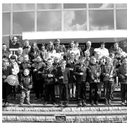
■ НА ФОТО: ПИОНЕРЫ КОЛЬВАНИ