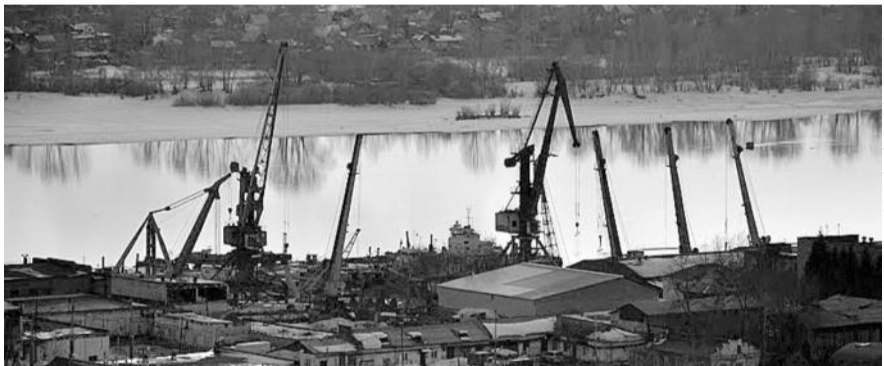
■ НА ФОТО: САМО ЗДАНИЕ ВРЯД ЛИ ПРЕДСТАВЛЯЕТ ЦЕННОСТЬ, ГЛАВНОЕ — ЗЕМЕЛЬНЫЙ УЧАСТОК

строено под другим номером — 5 вместо 5 «А», как это отмечено в паспортах прописанных в нем людей, что впоследствии создало дополнительные трудности не только для рабочих, но и для суда, в который рабочие обратились за защитой своих прав на жилье.