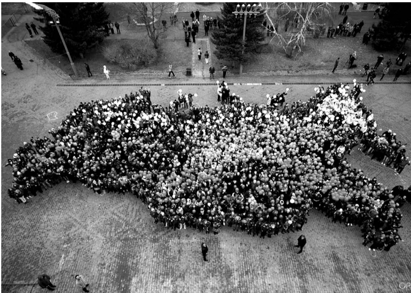
НА ФОТО: НАСЕЛЕНИЕ РОССИИ СОКРАЩАЕТСЯ