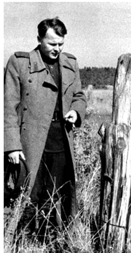
НА ФОТО: АЛЕКСАНДР ТВАРДОВСКИЙ В РОДНОЙ ДЕРЕВНЕ ЗАГОРЬЕ, 1943 г.

писатели, поэты относят стихотворение и песню «Враги сожгли родную хату...» к вершинам отечественной военной лирики, отмечая предельный трагизм ситуации. В подобном ключе отзывались, в частности, Твардовский, ЕВТУШЕНКО , Лев АННИНСКИЙ ... Песня неоднократно упоминается в различных произведениях искусства. Например, в фильме Владимира ХОТИНЕНКО «Зеркало для героя» один из персонажей, впервые услышав эту песню, говорит: «Я знал, что такая песня должна быть... Слеза несбывшихся надежд... Это же про меня...». В книге воспоминаний «Осколки зеркала» М. В. ТАРКОВСКАЯ (дочь поэта и сестра режиссера) подробно описывает неизгладимое впечатление от прослушивания песни в бардовском исполнении в начале 50-х годов.