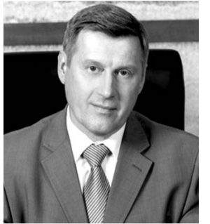
НА ФОТО: АНАТОЛИЙ ЛОКОТЬ

Мэр Новосибирска Анатолий ЛОКОТЬ и Председатель СО РАН Александр АСЕЕВ подписали соглашение о взаимодействии при создании технопарковых зон.