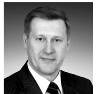
НА ФОТО: АНАТОЛИЙ ЛОКОТЬ

Мэр Новосибирска Анатолий ЛОКОТЬ в среду 10 июня провел выездное совещание на объектах дорожного ремонта. В этом году запланировано отремонтировать дорожное покрытие дорог городского и районного значения на площади 549 тыс. кв. метров. На сегодняшний день выполнено более 30% работ, или 22 объекта. Мэр напомнил, что в 2014 году было отремонтировано 340 тысяч квадратных метров, увеличение объемов произошло, но этого недостаточно для нормативного ремонта дорог.