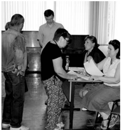
НА ФОТО: НА СЕМИНАРЕ

Учитывая характер наиболее частых обращений от жителей района, Депутатский центр КПРФ вновь провел встречу, посвященную вопросам капитального ремонта. На сегодняшний день это одна из самых болезненных и актуальных тем в сфере ЖКХ, которая, так или иначе, касается каждого собственника.