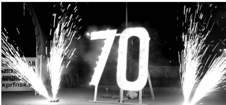
НА ФОТО: НА ЗАКРЫТИИ «ДНЯ ПРАВДЫ»

В этом году организатор фестиваля — региональное отделение КПРФ посвятил его одной из главных дат в нашей истории — 70-летию Победы советского народа в Великой Отечественной войне. Именно под Красным Знаменем Победы, которое торжественно подняли курсанты речного училища имени Дежнева, прошли основные мероприятия праздника оппозиционной печати. Подвигам советских солдат, наших земляков, вкладу в Победу Новосибирской области были посвящены тематические площадки, которые развернулись на аллеях сквера. Участники фестиваля могли узнать о помощи города и села фронту на площадках «Новосибирск — фронту!», «Село — фронту». На площадке «Соколы Покрышкина» все интересующиеся могли увидеть уникальную продукцию завода «Электросигнал», в том числе ее образцы военного периода. А в самом центре — около фонтана в Первомайском сквере — настоящий самолет, сконструированный студентами-энтузиастами конструкторского бюро Университета телекоммуникации и информатики. Теме Великой Победе были