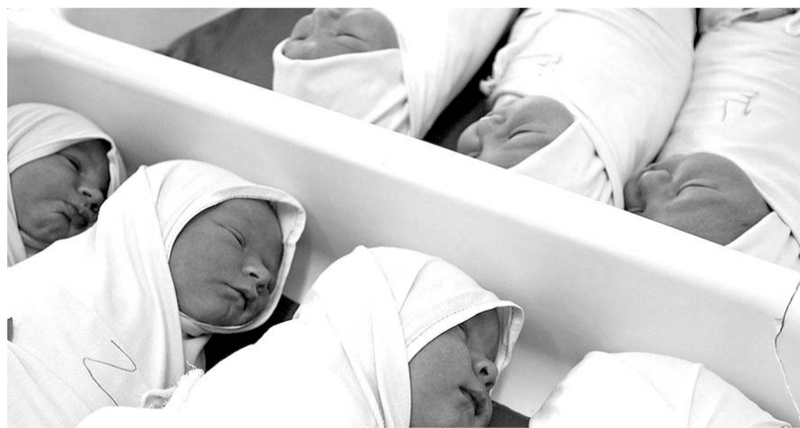
НА ФОТО: СМЕРТНОСТЬ В РОССИИ ПРЕВЫШАЕТ РОЖДАЕМОСТЬ

Насколько можно судить, в России на глазах возобновляется тренд на де-