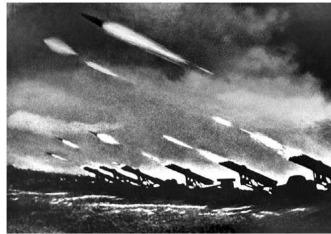
НА ФОТО: ЗАЛП БАТАРЕИ «КАТЮШ»

плацдарма. Остановить контратаки решено было огнем реактивной артиллерии. Выбор пал на комбата ст. лейтенанта И. ШКРЕБА в середине января 1944 года. Он с двумя радистами, на лодке переплыв речку, обосновался в траншее на командном пункте майора КОБЯКОВА , командира батальона. На передовой позиции примерно в 500 м от противника было хорошо видно накопление танков, пехоты для контратаки. Я подготовил исходные данные для подавления контратаки фашистов и передал их на огневую позицию дивизиона (это 8 «Катюш»). Ранним утром началось движение танков и пехоты на наши траншеи. После пристрелки был дан залп всех 8-ми «Катюш». Противника накрыли 128 снарядами фугасного и осколочного действия. Наступление захлебнулось: горели танки, немцы выталкивали раненых и убитых. Где-то к полудню наступательные действия, более мощные, повторились. Часть пехоты прорвалась в наши траншеи. Пришлось вступить в рукопашную и отбросить фашистов. Одновременно последовал залп «Катюш», который усмирил противника. После-