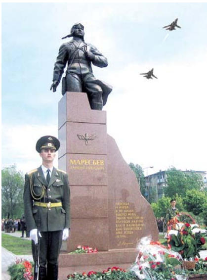
НА ФОТО: ПАМЯТНИК АЛЕКСЕЮ МАРЕСЬЕВУ