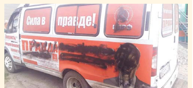
НА ФОТО: ГАЗЕЛЬ, ИСПОРЧЕННАЯ ВАНДАЛАМИ