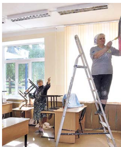
НА ФОТО: СКОРО РЕМОНТ ЗАВЕРШАТ

В то же время родители выполняют только представительскую функцию — они могут задавать интересующие их вопросы, но решение о том, готово