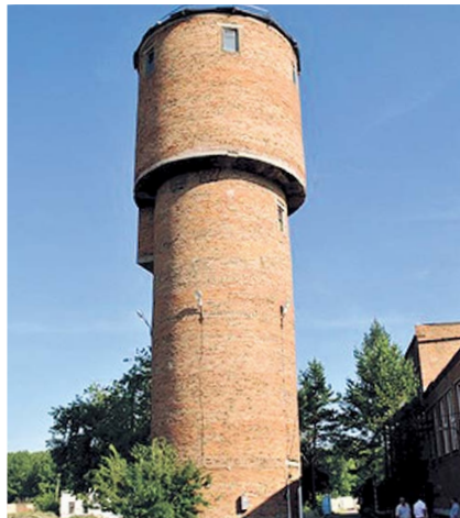
НА ФОТО: НОВАЯ НАСОСНАЯ СТАНЦИЯ В ГОРОДЕ ТАК И НЕ ПОЯВИЛАСЬ