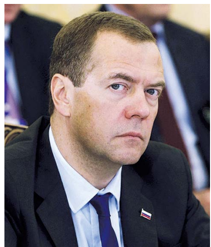
НА ФОТО: ДМИТРИЙ МЕДВЕДЕВ

Ответ премьера был обычным для человека либеральных взглядов: «Не рассказывайте о трудностях жизни — это сложно». Кроме того, в начале совещания Дмитрий Медведев сказал: «Каждый регион должен зарабатывать свои доходы сам». Об этом сообщила