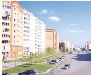
НА ФОТО: «РОДНИКИ»

На документах, полученных в ответ на запрос жительницы «Родников» от управляющей компании «Сибирская инициатива», подписи председателя совета дома не совпадают с его же подписями на других документах.