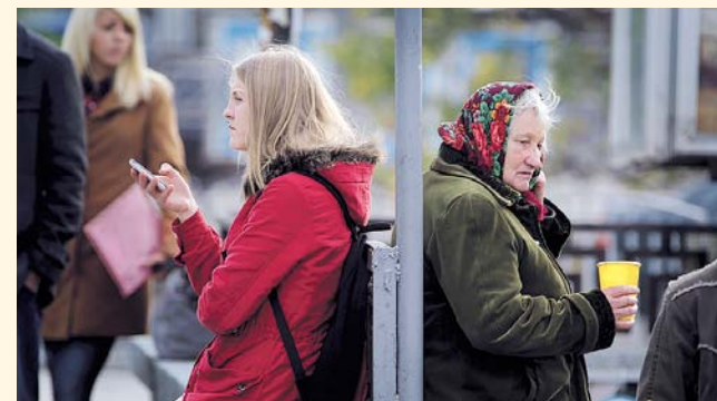
НА ФОТО: ЖИТЬ СТАЛО ДОРОГО