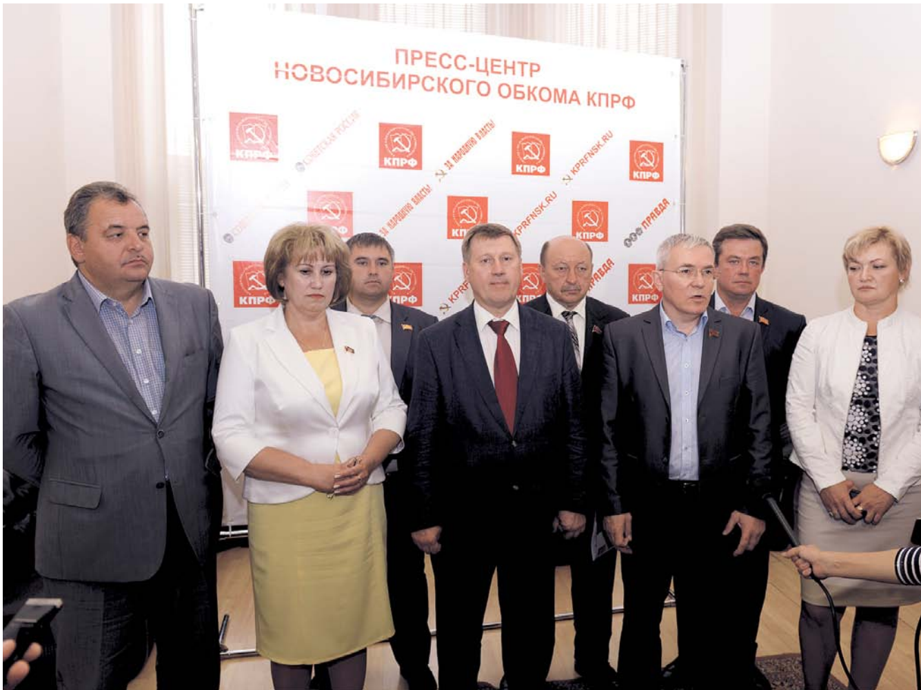
НА ФОТО: ЛИДЕРЫ НОВОСИБИРСКИХ И ТОМСКИХ КОММУНИСТОВ НА ВСТРЕЧЕ С ЖУРНАЛИСТАМИ