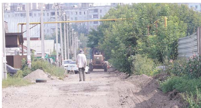
НА ФОТО: УЛ. ТЕЛЕЦКАЯ В ЧАСТНОМ СЕКТОРЕ НОВОСИБИРСКА