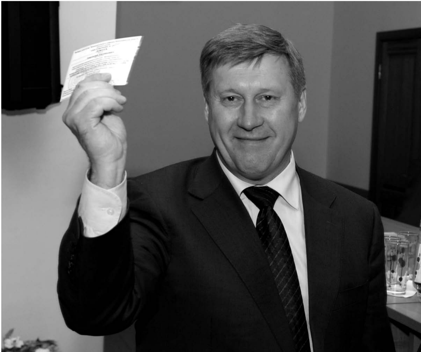
НА ФОТО: АНАТОЛИЙ ЛОКОТЬ ВОЗГЛАВИЛ СПИСОК КПРФ В ЗАКСОБРАНИЕ НОВОСИБИРСКОЙ ОБЛАСТИ