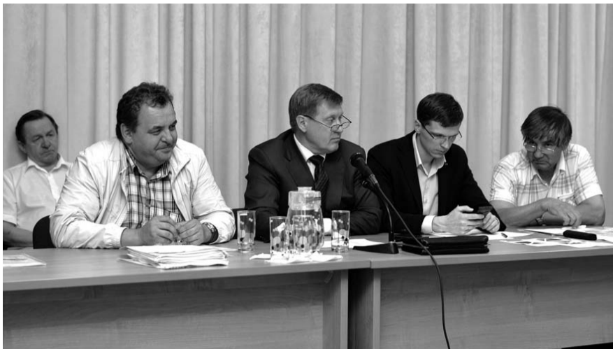
НА ФОТО: ПРЕЗИДИУМ СОБРАНИЯ КАНДИДАТОВ ОТ КПРФ

По словам Анатолия Локтя, сделано немало. В кризисном 2014-м году удалось добиться стопроцентного исполнения бюджета. Сдан в эксплуатацию Бугринский мост, осенью этого года будет сдана долгожданная развязка на ул. Петухова — въезд в город со стороны Советского шоссе. Выполнен