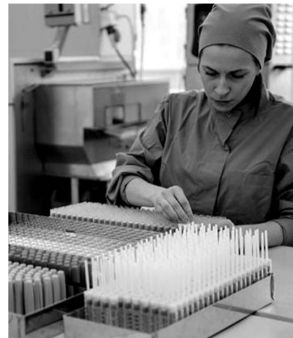
НА ФОТО: ЛЕКАРСТВО ТРЕБУЕТ КОНТРОЛЯ

— Я бы сказал, что сегодня не только контроль за качеством лекарственных препаратов, но и контроль за ценообразованием и ценами в аптеках страдает. И у профильного Министерства здравоохранения нет каких-то внятных инструментов по контролю, которые они могли бы применить. Это отмечал председатель правительства Дмитрий МЕДВЕДЕВ , когда министр СКВОРЦОВА докладывала ему по перечню жизненно важных лекарств. Министр уверяла, что в регионах ситуация находится под контролем, на что Дмитрий Анатольевич ей сказал, что это не так, у него масса жалоб от населения. Могу сказать, что тут есть над чем работать.