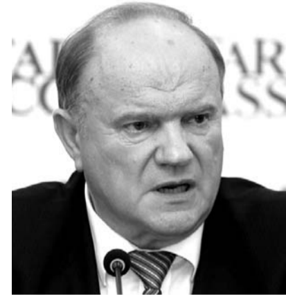
НА ФОТО: ГЕННАДИЙ ЗЮГАНОВ

Лидер КПРФ прокомментировал блокировку Россией резолюции в Совбезе ООН о трибунале по делу по гибели малайзийского «Боинга».