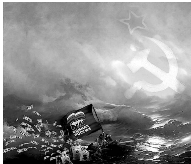
НА ФОТО: «ЕР» НЕ В СОСТОЯНИИ ВЫВЕСТИ СТРАНУ ИЗ КРИЗИСА

Актуальная шутка есть: «Кто виноват в падении ВВП? Само собой, ОБАМА . Что делать? Конечно же, ничего не делать, сплотиться и ждать, пока все само рассосется». Ну, а если серьезно, то, в принципе, ничего удивительного не происходит, кто бы сомневался, что ситуация будет ухудшаться — для всех здравомыслящих людей было понятно, что кризис в России начался еще в 2012 г. Именно тогда появились первые предвестники так называемого «идеального шторма», в который Россия попала во втором полугодии 2014 г., и у чиновников было два года, чтобы что-то предпринять. Но все, что они делали, — это говорили, что все хорошо, что напрягаться не нужно, что мы идем верным курсом, а все беды — это, вроде как, влияние внешних факторов, которые от них не зависят. Теперь нам объясняют, что во всех бедах виноваты санкции, нефть и Обама.