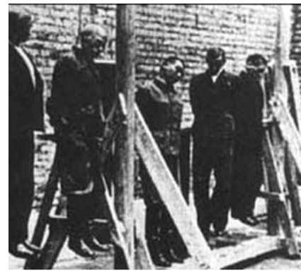
НА ФОТО: ГЕНЕРАЛ ВЛАСОВ (ТРЕТИЙ СПРАВА) СО ШТАБОМ

Далеко не все попавшие в плен советские высшие офицеры следовали примеру иуд. Многие вели себя в плену мужественно и с достоинством. Генералы КАРБЫШЕВ, СНЕГОВ, ЛУКИН с брезгливостью отвергли призыв Власова сотрудничать с немцами. А генерал-лейтенант П.Г.ПОНЕДЕЛИН еще и плюнул в физиономию изменника.