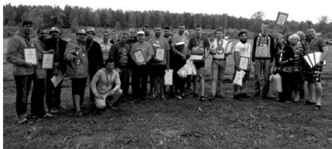
НА ФОТО: ПОБЕДИТЕЛИ СПАРТАКИАДЫ