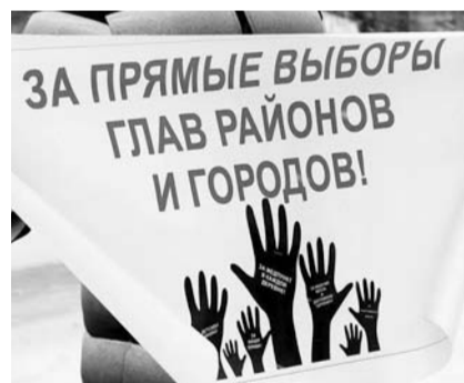
НА ФОТО: ИМЕЕМ ПРАВО ВЫБИРАТЬ!