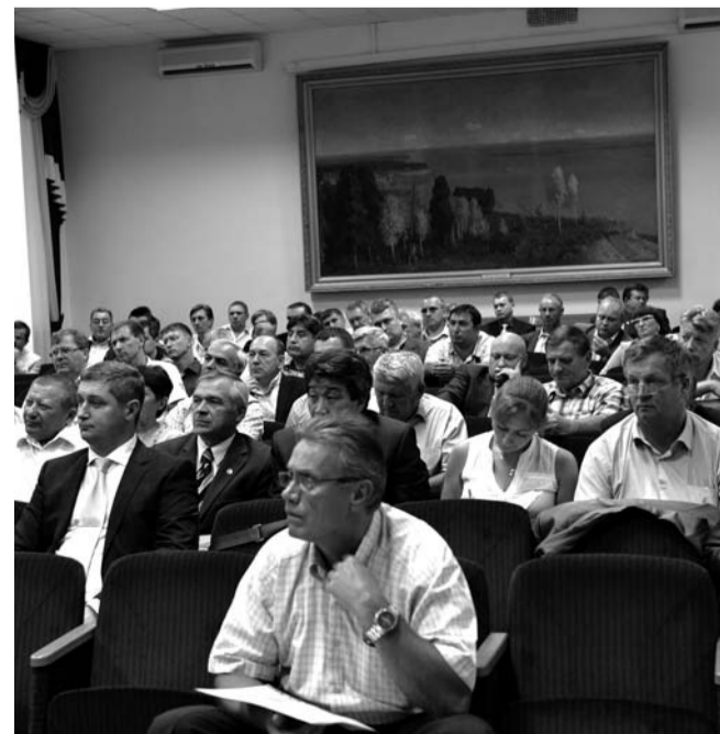
НА ФОТО: КОММУНИСТЫ ОБСУДИЛИ ХОД КАМПАНИИ