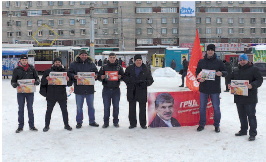
НА ФОТО: КОМСОМОЛЬЦЫ ПРИЗЫВАЮТ ОСТАНОВИТЬ ПОТОКИ ЛЖИ

15 февраля, коммунистами Дзержинского района был проведен пикет у станции метро «Золотая Нива». Была отмечена высокая узнаваемость Павла Грудинина. За полтора часа жители получили от участников пикета 1000 экземпляров газеты. Избиратели задавали вопросы, связанные с положениями программы кандидата.