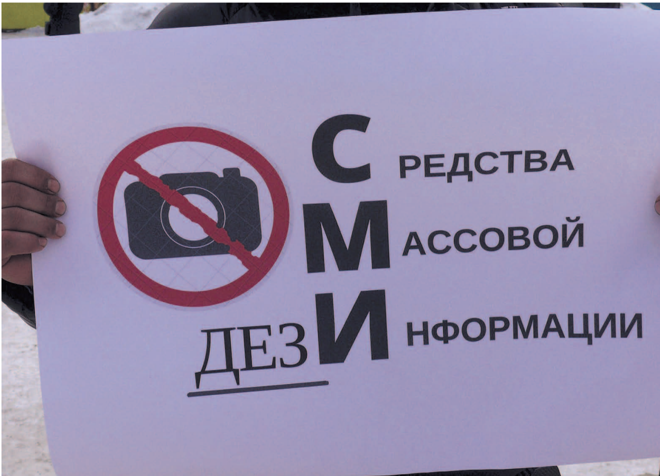
НА ФОТО: СРЕДСТВА МАССОВОЙ ИНФОРМАЦИИ ДЕКРЕДИТИРОВАНЫ СЕБЯ ЛОЖЬЮ