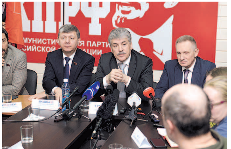
НА ФОТО: НА ПРЕСС-КОНФЕРЕНЦИИ

После этого кандидат в президенты ответил на вопросы журналистов. Преобладала региональная тематика, в частности, один из первых вопросов касался инициативы сибирских перевозчиков по отмене транспортного налога и системы «Платон». Павел Гру-