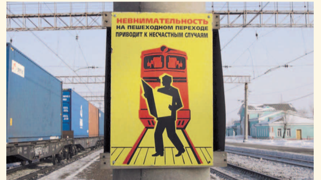
НА ФОТО: ПЕРЕХОД ЗАЧАСТУЮ ПЕРЕГОРОЖЕН СОСТАВАМИ