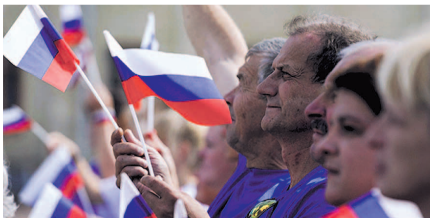
НА ФОТО: РОССИЯНЕ ЖДУТ ОТ НОВОГО ПРЕЗИДЕНТА ПОВЫШЕНИЯ БЛАГОСОСТОЯНИЯ НАРОДА

На третьем месте стоит модная уже который год борьба с коррупцией (31%). Причем, два года назад по этому поводу беспокоились лишь 17% респондентов / Освещение по телевидению знаковых антикоррупционных процессов, приговоры РЕЙМЕРУ , БЕЛЫХ , ХОРОШАВИНУ делают тему популярной, но явно недостаточной. Это все больше похоже на показуху, чем реальную борьбу.