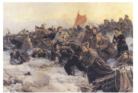
НА ФОТО: «РОЖДЕНИЕ КРАСНОЙ АРМИИ»

В марте 1919 г. на VIII съезде РКП(б) было принято принципиальное решение о внесении изменений в программ-