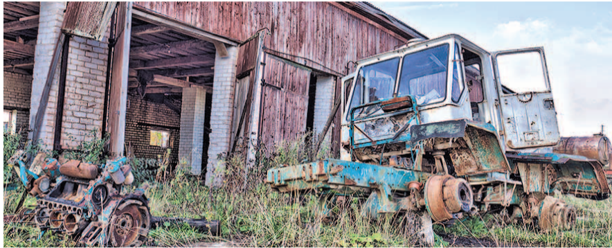
НА ФОТО: РАЗРУХА НА СЕЛЕ — РЕЗУЛЬТАТ РАБОТЫ ПРЕЗИДЕНТА И ПРАВИТЕЛЬСТВА

Прочитав обращение руководителей сельхоз предприятий Забайкальского края к президенту России В.В. ПУТИНУ в газете «Советская Россия», я подумал, что нам, новосибирцам, стоило бы подписаться под этим криком души селян. Сейчас все чаще слышишь слова ностальгии по прошлым временам. Почему мы так сожалеем о прошлом?