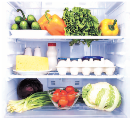
НА ФОТО: ПРОДУКТЫ НУЖНО УМЕТЬ ПРАВИЛЬНО ХРАНИТЬ И ГОТОВИТЬ

Некоторые витамины легко окисляются кислородом воздуха. По этой причине резать овощи и фрукты надо не заранее, а непосредственно перед