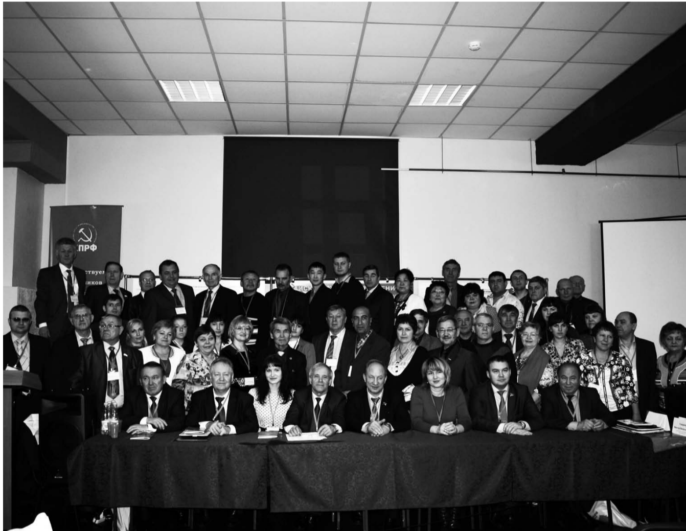
НА ФОТО: УЧАСТНИКИ СЕМИНАРА-СОВЕЩАНИЯ РЕГИОНАЛЬНЫХ ОТДЕЛЕНИЙ КПРФ СИБИРСКОГО ФЕДЕРАЛЬНОГО ОКРУГА