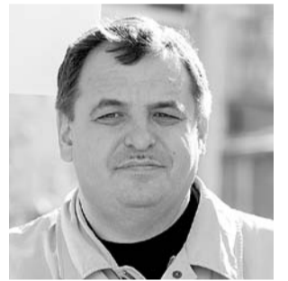
НА ФОТО: РЕНАТ СУЛЕЙМАНОВ

Речь заместителя председателя Совета депутатов города Новосибирска, лидера фракции КПРФ Рената СУЛЕЙМАНОВА на прошедшей сессии городского парламента, посвященная бюджету города на 2015 год.