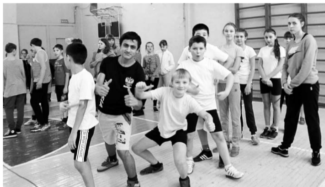
НА ФОТО: ШКОЛЬНИКИ НА «ВЕСЕЛЫХ СТАРТАХ»