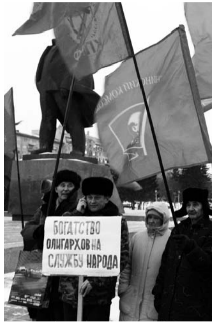
НА ФОТО: НА ПИКЕТЕ

— 20 лет — одни слова. А дела — падение курса рубля, на котором нажились олигархи, которые сразу ринулись зарабатывать на курсе, покупать доллары, потом продавать их. Дешевеет нефть, Путин в своем послании сказал — будем проводить экономи-