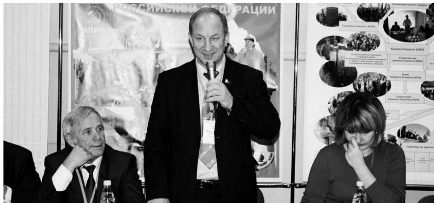
НА ФОТО: В ПРЕЗИДИУМЕ — ВАЛЕРИЙ РАШКИН