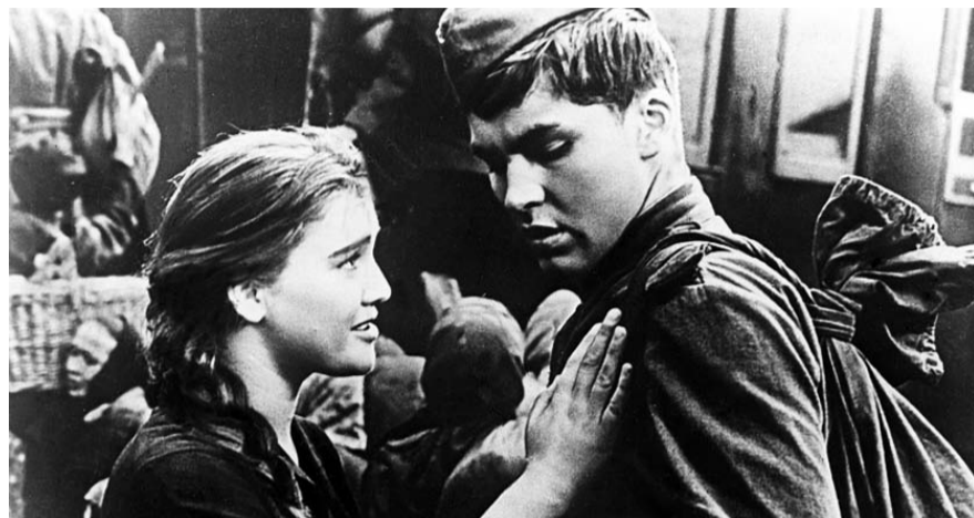
НА ФОТО: «ОГОНЕК» ГОРИТ ДО СИХ ПОР — ПОКА МЫ ПОМНИМ