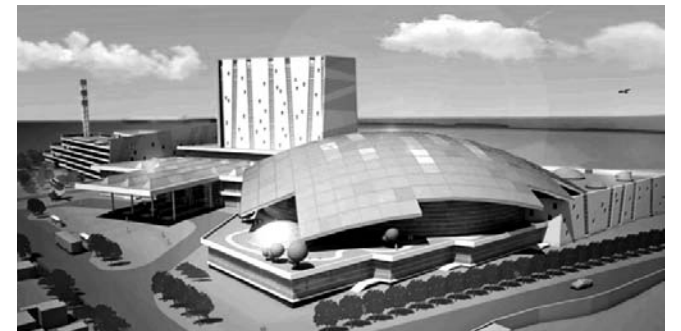
НА ФОТО: ТАК ВЫГЛЯДИТ ПРОЕКТ АКВАПАРКА В НОВОСИБИРСКЕ