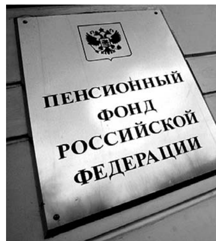
НА ФОТО: КАКУЮ ПЕНСИЮ МЫ ЗАРАБОТАЕМ?

И вот теперь новые предложения ВЭБ имеют своей целью лишить людей возможности выбора в этом важнейшем вопросе. То есть люди опять будут вынуждены принудительно формиро-