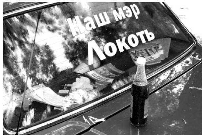
НА ФОТО: КОГДА У ОПОНЕНТОВ НЕ ОСТАЕТСЯ ДРУГИХ АРГУМЕНТОВ...