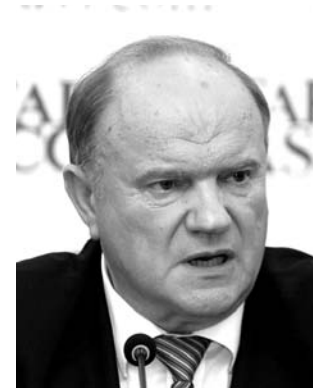
НА ФОТО: ГЕННАДИЙ ЗЮГАНОВ

Инициатива о переносе парламентских выборов в 2016 году с декабря на третье воскресенье сентября нелегитимна, заявил Председатель ЦК КПРФ Геннадий ЗЮГАНОВ .