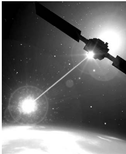
НА ФОТО: СОИ ВЕРНУЛИСЬ?

Отметим, что размещение в космосе ядерного оружия и оружия массового поражения запрещено на основании договора, вступившего в силу 10 октября 1967 года. По состоянию на октябрь 2011 года этот договор подписали 100 стран, еще 26 госу-