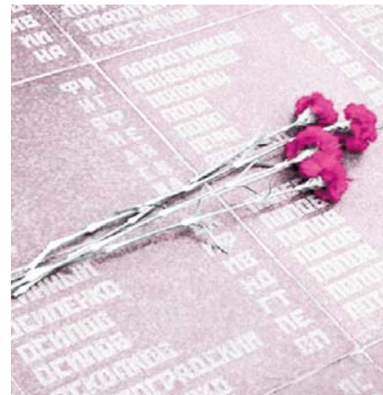
НА ФОТО: ПАМЯТЬ ЖИВА!

давать партизанские отряды. Все силы народа — на разгром врага!»