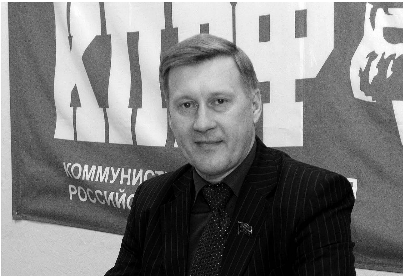
НА ФОТО: МЭР НОВОСИБИРСКА АНАТОЛИЙ ЛОКОТЬ БЛАГОДАРЕН КПРФ ЗА ПОДДЕРЖКУ