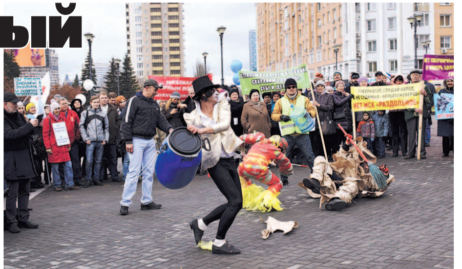
НА ФОТО: НА МИТИНГЕ ПРОТИВ МУСОРНОЙ КОНЦЕССИИ

По словам депутата, невыполнение концессионером взятых на себя обязательств позволяло врио губернатора расторгнуть концессию, но этого до сих пор не произошло, несмотря на многочисленные заявления. Речь пока