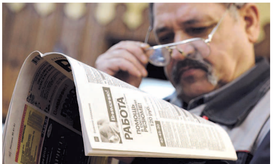
НА ФОТО: ЧТО ДЕЛАТЬ, ЕСЛИ НЕ УСПЕЛ ДО 45 ЛЕТ ЗАРАБОТАТЬ НА БЕЗБЕДНУЮ СТАРОСТЬ?

Статистика тут довольно печальная: только 3% сотрудников, нанятых через «HeadHunter» в 2015 году, были старше 45 лет — это некий «возраст отсеечения». «В подавляющем большинстве работодатели ориентированы на работников 23-40 лет», — говорится в отчете. В кризис те, кому «за 45», становились первыми кандидатами на увольнение. А сейчас их если и берут, то меньше платят.