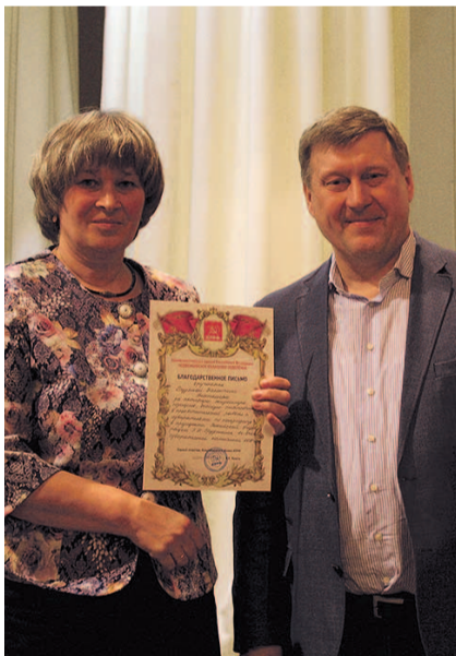
НА ФОТО: АНАТОЛИЙ ЛОКОТЬ В ЧИСТООЗЕРНОМ

Второй секретарь Обкома КПРФ Ренат СУЛЕЙМАНОВ отметил, что Новосибирск уже несколько лет является лидером в России по многим показателям: вводу жилья, капремонту и ремонту дорог, приросту населения. Новосибирск является одним из самых привлекательных для жизни городов.