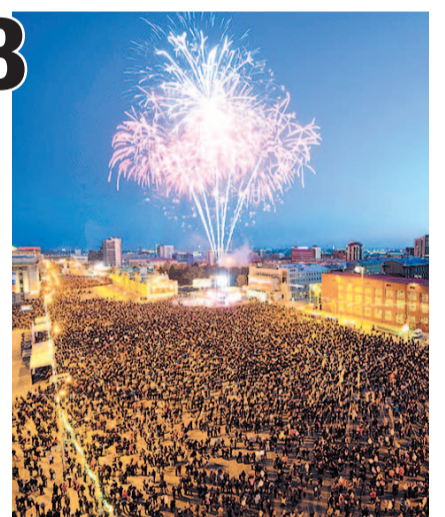
НА ФОТО: САЛЮТ В ЧЕСТЬ ДНЯ ПОБЕДЫ

Отдельно военные дадут большой победный салют над Обью. Запускать его будут с пляжа «Наутилус», а для звукового сопровождения будут еще и стрелять из гаубиц. Фейерверки будут запущены одновременно со всех площадок в 21-50.