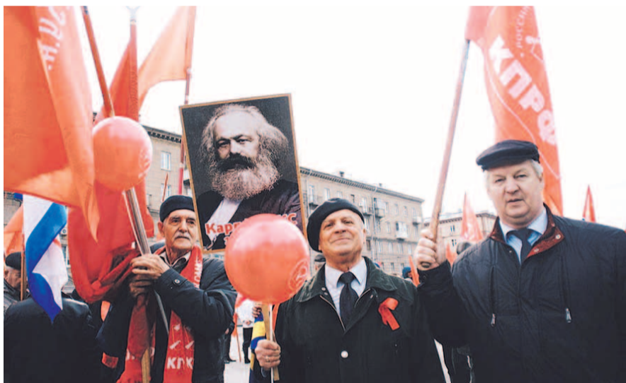
НА ФОТО: 5 МАЯ ИСПОЛНИТСЯ 200 ЛЕТ СО ДНЯ РОЖДЕНИЯ КАРЛА МАРКСА