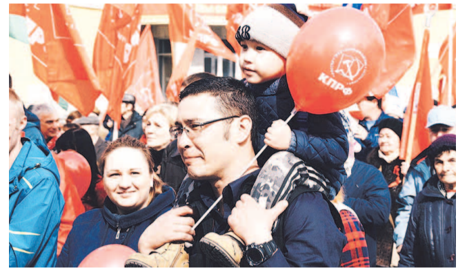
НА ФОТО: 1 МАЯ — НЕ ТОЛЬКО ТРУДОВОЙ, НО И СЕМЕЙНЫЙ ПРАЗДНИК

— Я сегодня, с этой трибуны, хочу поблагодарить всех тех, кто участвовал в весеннем субботнике и привел в