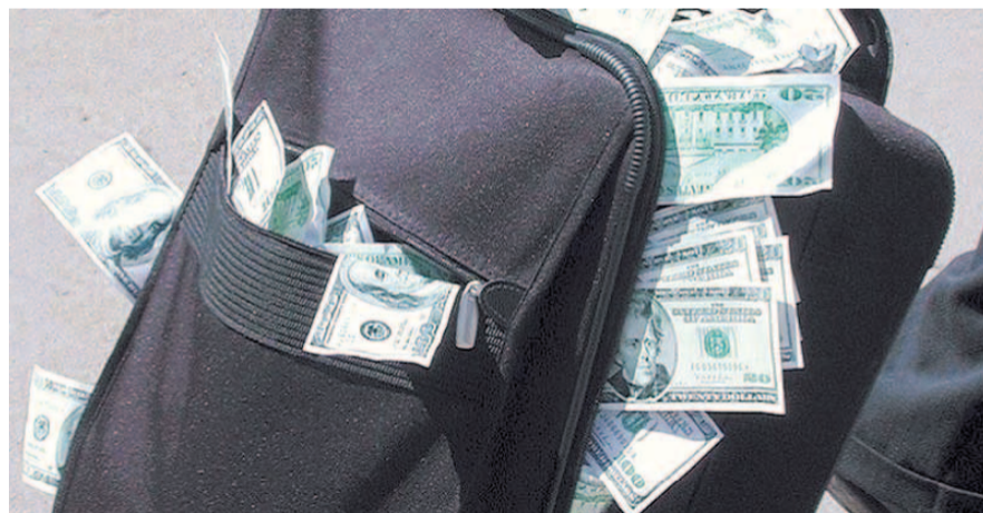
НА ФОТО: ДЕНЬГИ ИЗ СТРАНЫ ВЫВОЗЯТ ЧЕМОДАНАМИ

В комитете предлагают усовершенствовать систему организационного и информационного взаимодействия пра-