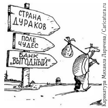
НА РИС.: ЖИТЕЛИ НОВОСИБИРСКОЙ ОБЛАСТИ Взяли БОЛЬШЕ КРЕДИТОВ, ЧЕМ МОГУТ ОТДАТЬ

По данным исследования, проведенного аналитиками «Альфа-банка», кредитный дефолт может начаться в субъектах федерации и вылиться в системный кризис. Новосибирская область вошла в пятерку регионов, жители которых задолжали банкам больше, чем физически могут отдавать со своей зарплаты.