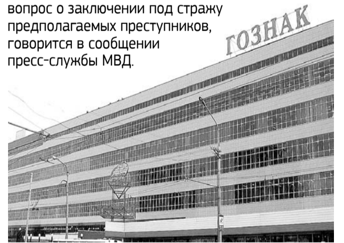
НА ФОТО: РАБОТНИКИ ГОЗНАКА ПОДОЗРЕВАЮТСЯ В МОШЕННИЧЕСТВЕ

Сотрудники МВД России задержали бывших и действующих работников ФГУП «Гознак». Организованная ими афера, как считают в полиции, нанесла ущерб государственному предприятию на сумму свыше 35 млн рублей. В Мещанском районном суде решается вопрос о заключении под стражу предполагаемых преступников, говорится в сообщении пресс-службы МВД.