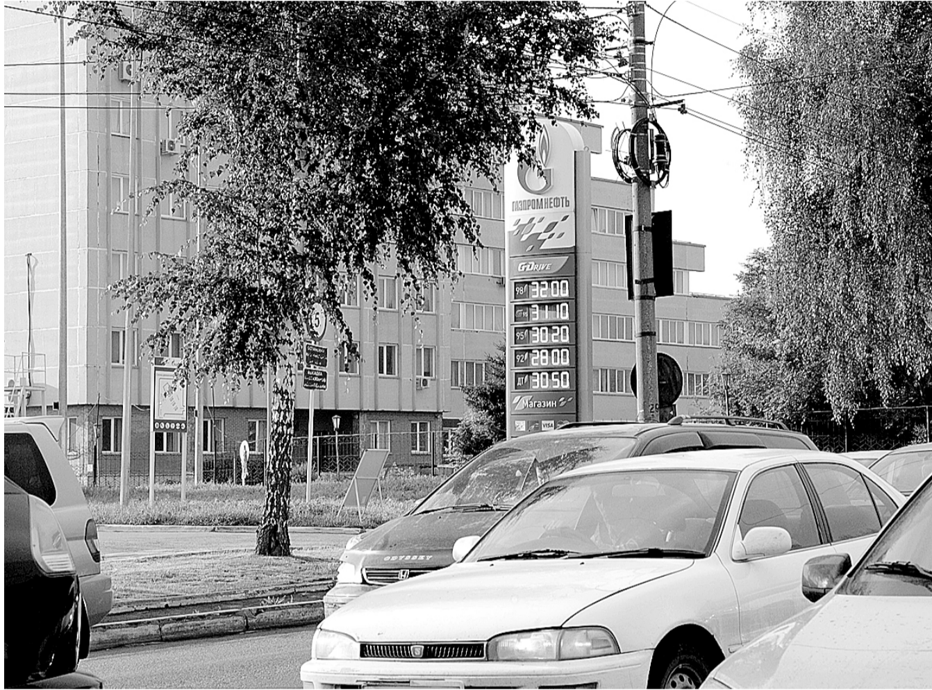
НА ФОТО: 95-Й БЕНЗИН В НОВОСИБИРСКЕ ПРЕОДОЛЕЛ 30-РУБЛЕВЫЙ РУБЕЖ