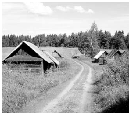
НА ФОТО: ВОЗРОЖДЕНИЕ РОССИИ НЕВОЗМОЖНО БЕЗ ВОЗРОЖДЕНИЯ СЕЛА

Сердце кровью обливается, и невольно сжимаются кулаки, когда смотришь на зарастающую травой территорию бывшего животноводческого комплекса и остовы разграбленных телятников, коровников и других производственных зданий. Сельчане, хотя и возмущаются политикой властей, но не унывают, выступают с концертами и даже сами сочиняют и поют вот такие песни: