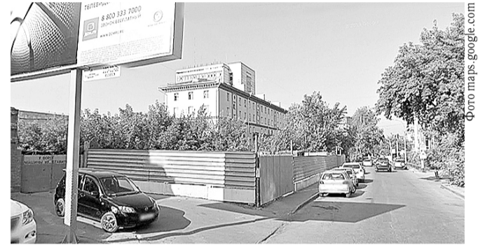
НА ФОТО: ПЛОЩАДКА НА УЛ. ЧАПЛЫГИНА, 54

В комментарии сайту Тайга.инфо Юрченко пояснил, что тогда городу не хватало гостиниц, «а это место, действительно, подходящее для гостиницы».