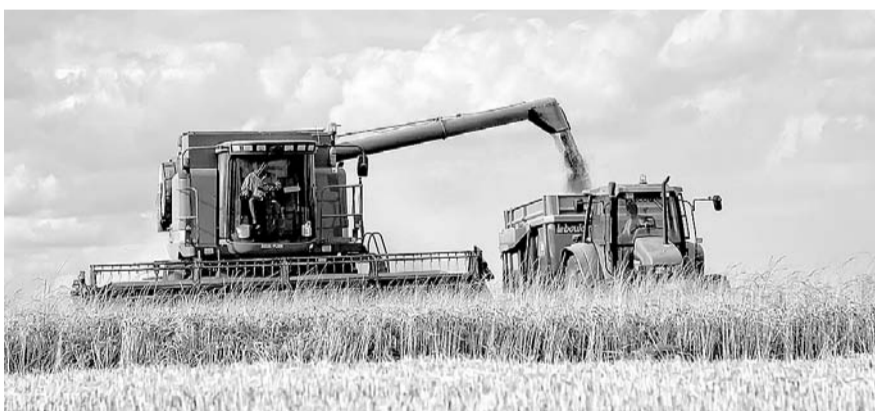
НА ФОТО: ИЗ-ЗА ПОГОДЫ СРОКИ СОЗРЕВАНИЯ КУЛЬТУР ЗАТЯГИВАЮТСЯ

Этому поспособствуют как погодные, так и экономические причины. Сельские труженики не знают, чего ждать как от погоды, так и от госполитики и ценообразования в аграрном секторе.