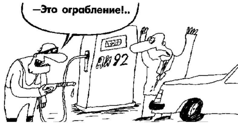
НА РИС.: ПОВЫШЕНИЕ ЦЕН НА БЕНЗИН ОЩУТЯТ НА СЕБЕ ВСЕ ГРАЖДАНЕ СТРАНЫ

По новому закону, продюсерам ничего не надо доказывать через суд и заставлять интернет-компании удалять ссылки. Теперь вся эта головная боль ложится на самих провайдеров, которые вынуждены будут постоянно внимательно проверять свой сайт, включая форумы. Если там появится нежелательный контент, то Роскомнадзор может заблокировать весь ре-