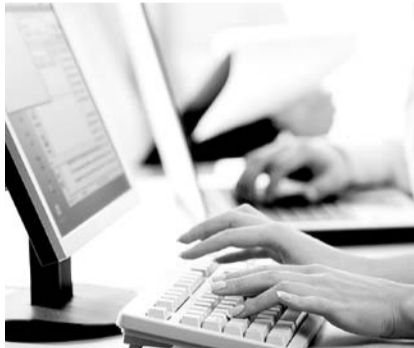
НА ФОТО: ТЕПЕРЬ САЙТ МОГУТ ЗАБЛОКИРОВАТЬ ИЗ-ЗА ССЫЛКИ НА ФОРУМЕ

курс как минимум на 15 дней. Понятно, что этим открывается простор для атаки со стороны недобросовестных конкурентов.