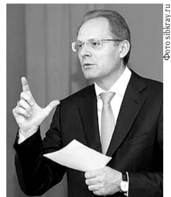
НА ФОТО: ГУБЕРНАТОР ЮРЧЕНКО

По информации, полученной от источника в следственном управлении Следственного комитета РФ по Новосибирской области, 1 августа 2013 года на допрос в рамках возбужденного уголовного дела по признакам преступления, предусмотренного ст. 159 УК