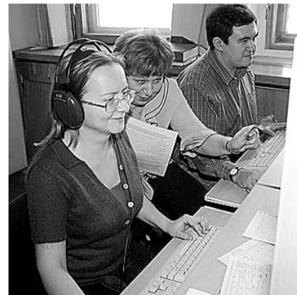
НА ФОТО: С ОКТЯБРЯ СОТРУДНИКИ РАДИО «СЛОВО» СТАНУТ БЫВШИМИ СОТРУДНИКАМИ

информационный продукт. Для всех очевидно, что уже не будет программ, пусть и с «устаревшим» форматом, каким его нарекли «реформаторы», но уникальных для новосибирского радио. Для депутатов Законодательного собрания, которые вот-вот выйдут из летних отпусков, большим сюрпризом станет тот факт, что теперь они не являются хозяевами собственного СМИ. Для попадания в эфир они вынуждены будут подстраиваться под желания настоящего «владельца» радиоканала.