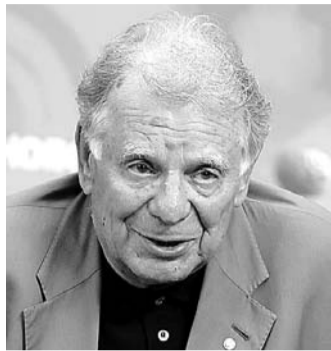
НА ФОТО: АКАДЕМИК РАН ЖОРЕС ИВАНОВИЧ АЛФЕРОВ

Полагаю, что президент страны всегда является самым большим патриотом своей страны и заинтересован в успешном ее развитии уже в силу занимаемой должности. Важнейшей задачей страны является возрождение высокотехнологичных отраслей промышленности. Вы сформулировали его как задачу для бизнеса: создать к 2020 году 25 миллионов рабочих мест в высокотехнологичном секторе экономики.