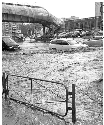
НА ФОТО: ПЛОЩАДЬ ТРУДА УТОНУЛА

— В процессе эксплуатации ливневая канализация забивается глиной или илом, поэтому ее необходимо чистить, но это дорогостоящие работы. В некоторых случаях дешевле даже бу-