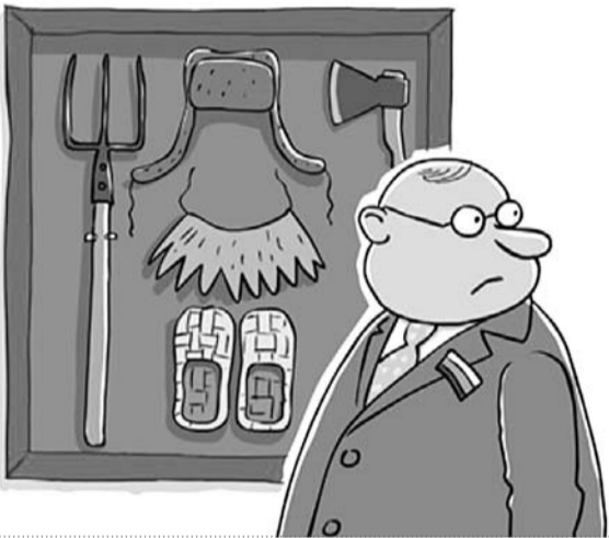
Карикатура Сергея Елкина / Polt.ru