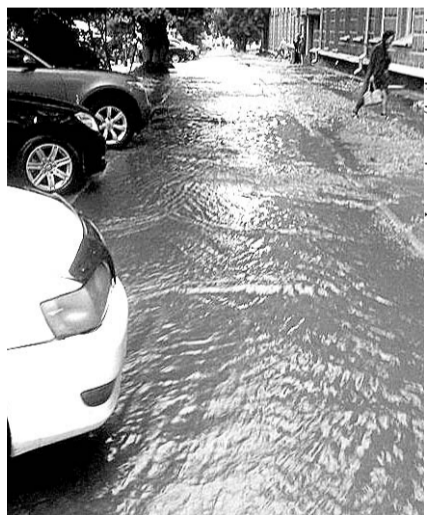
НА ФОТО: ТРОТУАР ПОГРУЗИЛСЯ ПОД ВОДУ

Сложная ситуация на дорогах не только парализовала улицы города, но и спровоцировала огромное количество ДТП. Транспортный коллапс образовался на подъездах к площади Труда.