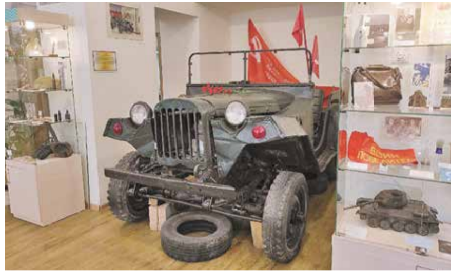
НА ФОТО: ЭКСПОЗИЦИЯ МУЗЕЯ «ЗАЕЛЬЦОВКА»