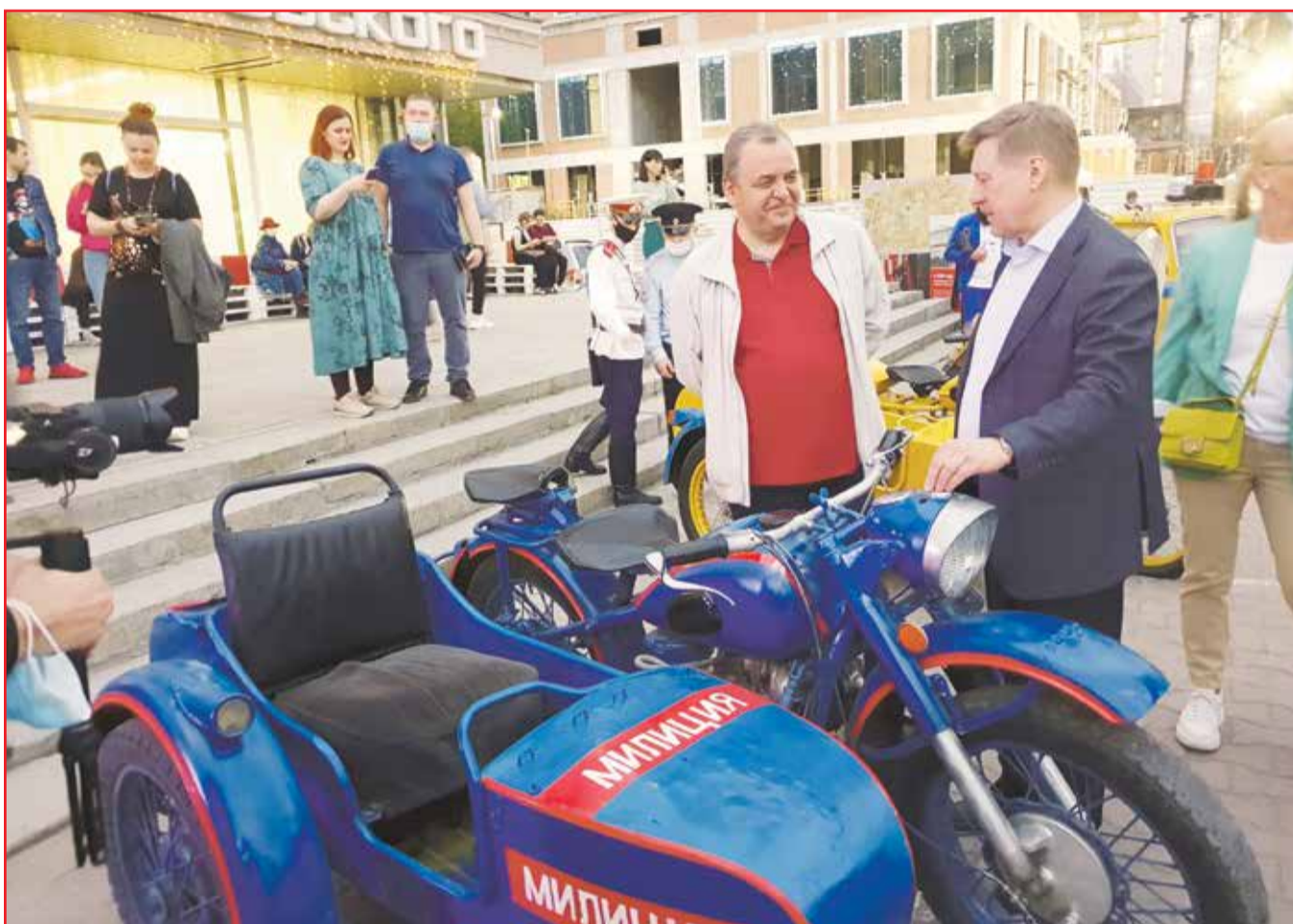
НА ФОТО: ЛИДЕРЫ НОВОСИБИРСКИХ КОММУНИСТОВ СМОТРЯТ ЭКСПОНАТЫ ВЫСТАВКИ ОКОЛО ККК ИМЕНИ МАЯКОВСКОГО