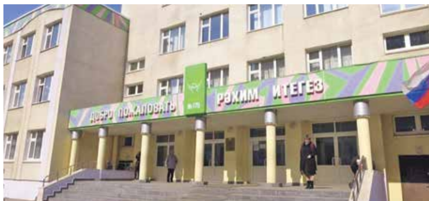
НА ФОТО: ШКОЛА №175 В КАЗАНИ, ГДЕ ПРОИЗОШЛА ТРАГЕДИЯ

Горе вновь пришло в наш дом. Капитализм, чья реставрация произошла в России тридцать лет назад, продолжает собирать кровавую жатву. Его главными жертвами становятся самые уязвимые, самые незащищенные — дети и пожилые люди. Это доказала чудовищная расправа в Казани. 19-летний отморозок явился с оружием в школу № 175, которую окончил несколько лет назад, и открыл стрельбу. Погибли учительница и ученики разных классов. Свыше двадцати человек находятся в больницах. Несколько из них в тяжелом состоянии.