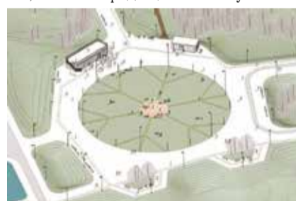
НА ФОТО: СХЕМА БУДУЩЕГО ПАРКА

В парке сохранят естественный ландшафт и высадят более двух тысяч деревьев и кустарников. Сейчас на этой территории закончили подготовительные работы — выровняли землю и убрали аварийные и больные деревья. Также здесь сделают луг для спокойного отдыха и пикников. Парк будет круглогодичным: зимой велодорожки будут превращаться в лыжню, а зона перед сценой — в уличный