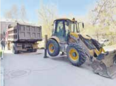
НА ФОТО: СТРОИТЕЛЬНАЯ ТЕХНИКА ВО ДВОРАХ ПЕРВОМАЙСКОГО РАЙОНА

— Я приехал на место, где ведутся работы, мы будем следить за данным объектом, контролировать реализацию наказа.