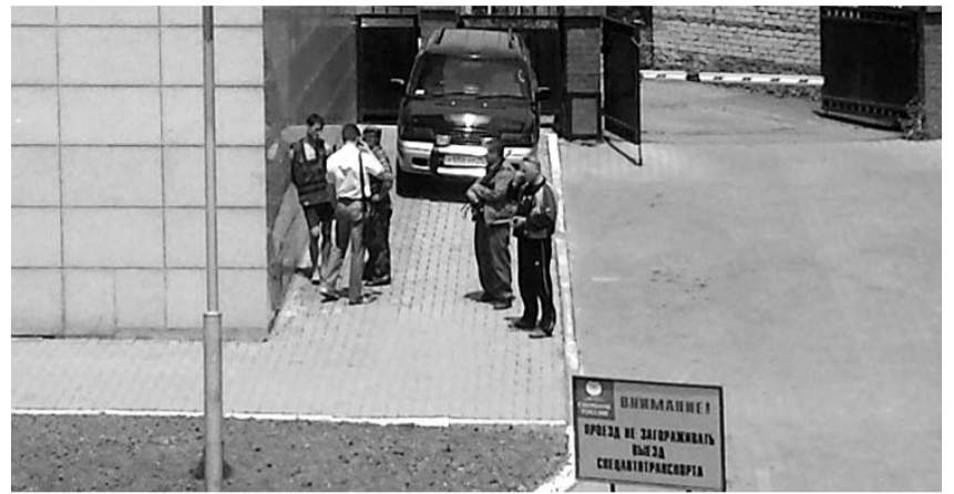
● НА ФОТО: ДОПРОС СДАВШЕГОСЯ «ПАРТИЗАНА» (СТОИТ СЛЕВА В БРОНЕЖИЛТЕ БОСИКОМ)

«Комментарии в интернет-форумах и некоторых СМИ о «ментовском беспределе, толкнувшем мальчишек на вооруженную борьбу», не соответствуют дей-