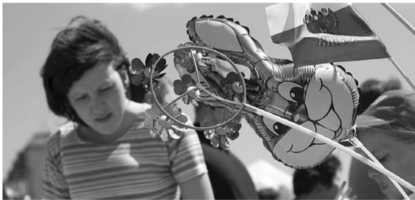
● НА ФОТО: ОТМЕЧАЕМ 12 ИЮНЯ — СЛУШАЕМ ПОЗДРАВЛЕНИЯ, УЛЫБАЕМСЯ И НЕ ДУМАЕМ...