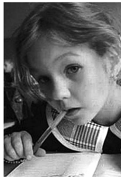
● НА ФОТО: ХВАТИТ ЛИ У РОДИТЕЛЕЙ ДЕНЕГ?

Вдумайтесь! Уже в начальной школе родителям придется платить 5-6 тысяч за каждого ребенка. А что будет в старших классах? И это забота государства о подрастающем поколении? Кто в таких условиях будет заводить много детей (или даже одного)? Ведь расходы на их образования уже с начальной школы будут достаточно приличными. Нынешний курс правительства на перевод системы образования на платную основу снова обрекает Россию на демографический спад, подобный тому, который она испытала в 90-х годах прошлого века.