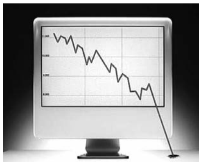
● НА ФОТО: ВСЕ НИЖЕ И НИЖЕ

Самой популярной фигурой среди новосибирских «единороссов» является олим-