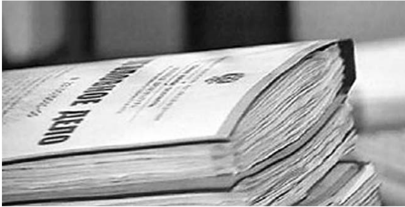
● НА ФОТО: В ГОСАРХИВЕ ОРУДОВАЛИ ФАЛЬСИФИКАТОРЫ?

Депутат Госдумы от фракции КПРФ Виктор ИЛЮХИН выступил с заявлением, что есть доказательства изготовления и подделки архивных документов. Коммунист встречался с человеком, имеющим непосредственное отношение к изготовлению и фальсификации архивных документов в 90-х годах прошлого века, имя его по понятным причинам не раскрывается. Из его высказываний следует, что в начале 90-х была создана группа из специалистов высокого ранга по подделке архивных документов, касающихся важных событий советско-