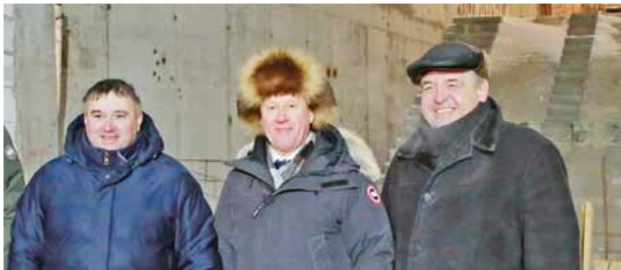
НА ФОТО: ДЕПУТАТ ЗАКСОБРАНИЙ РОМАН ЯКОВЛЕВ, МЭР НОВОСИБИРСКА АНАТОЛИЙ ЛОКОТЬ, ВТОРОЙ СЕКРЕТАРЬ НОВОСИБИРСКОГО ОБЛАСТНОГО КОМИТЕТА КПРФ РЕНАТ СУЛЕЙМАНОВ В ВЕСТИБУЛЕ БУДУЩЕЙ СТАНЦИИ МЕТРО «СПОРТИВНАЯ»

В течение года планируется также провести обустройство инженерных систем и внутреннюю отделку станции. Специалисты должны будут реконструировать существующее здание под-