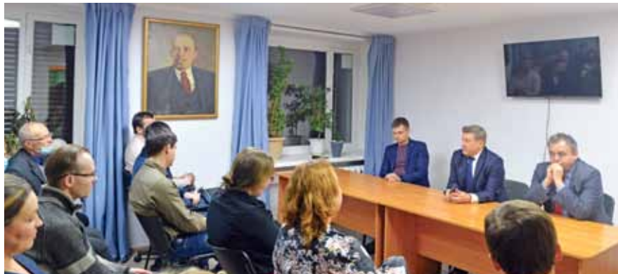
НА ФОТО: ВСТРЕЧА АКТИВА ЦЕНТРАЛЬНОГО РАЙКОМА КПРФ С ПЕРВЫМ СЕКРЕТАРЕМ ОБКОМА ПАРТИИ АНАТОЛИЕМ ЛОКТЕМ

— В 2020 году мы выполнили все стратегические обязательства, несмотря на то, что потеряли в доходах. Отремонтировали 41 километр дорог, ввели в эксплуатацию 10 новых детских садов — 2700 дополнительных мест, в том числе для детей в возрасте от 1,5 до 3 лет. Ввели три школы, открыли Затулинский дисперсный парк на левом берегу.