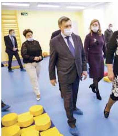
НА ФОТО: АНАТОЛИЙ ЛОКОТЬ НА ТЕХНИЧЕСКОМ ОТКРЫТИИ В ДЕТСКОМ САДУ №150

В строительной отрасли остаются проблемой долгострой и ветхое жилье. В 2020 году с привлечением застройщиков и бюджетных средств расселено 40 аварийных домов — в новое жилье переехали более 700 новосибирцев.