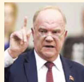
НА ФОТО: ПРЕДСЕДАТЕЛЬ ЦК КПРФ ГЕННАДИЙ ЗЮГАНОВ

Товарищи! XXI век устроил нам испытания не только новыми вирусами и кризисами. Главное испытание — это проверка на прочность, на жизнеспособность нашей цивилизации.