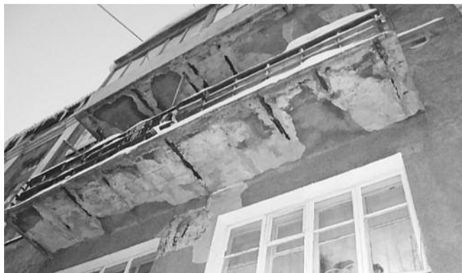
● НА ФОТО: ЖИЛОЙ ФОНД СРОЧНО НУЖДАЕТСЯ... ХОТЯ БЫ, В ЗАБОТЕ

В городе Обь при поддержке горкома КПРФ состоялась учредительное собрание некоммерческой организации «Ассоциация старших по домам». Организация объединяет общественных активистов, старших по домам, подъездам и тех, кто активно им помогает. Учреждение «Ассоциации старших по домам» — первый опыт создания подобной организации не только для Оби, но и для всей Новосибирской области.