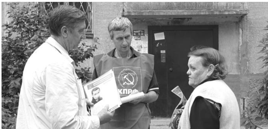
● НА ФОТО: КОММУНИСТЫ ЦЕНТРАЛЬНОГО РК КПРФ ПРОВОДЯТ АГИТАЦИОННУЮ РАБОТУ

А так, что крыша отремонтирована таким образом, что вода в результате таяния снега или после дождя попадает не в трубы-стоки, а стекает по стенам квартир