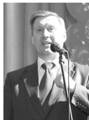
• НА ФОТО: АНАТОЛИЙ ЛОКОТЬ ПРИВЕТСТВУЕТ СОБРАВШИХСЯ

Накануне Дня космонавтики, 11 апреля в Доме культуры «Энергия» состоялся концерт, посвященный 50-летию со дня первого полета человека в космос. Зал был переполнен — на мероприятие пришли ветераны космической отрасли, курсанты Сибирского авиационного кадетского корпуса им. Покрышкина и протые новосибирцы.