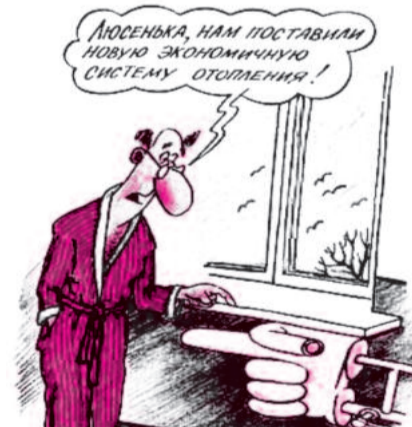
● НА РИС.: ЕСЛИ РЕМОНТ, ТО КАПИТАЛЬНЫЙ!

жильцов верхних этажей дома. Такой же эффект дают и железные листы снаружи окон на всех остальных этажах. И как результат — бесконечная сырость в квартирах.