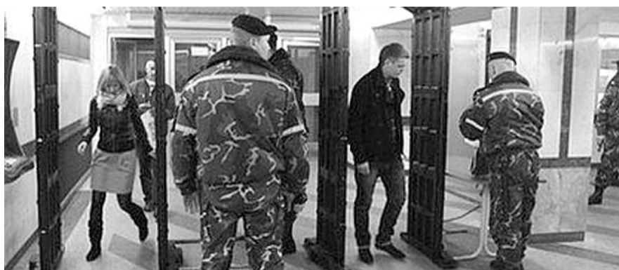
■ НА ФОТО: ПОСЛЕ ТЕРАКТА В МИНСКОМ МЕТРО УСТАНОВИЛИ МЕТАЛЛОИСКАТЕЛИ

— Установите, кому это было выгодно, кто за этим стоит, кому было выгодно взрывать стабильность и спокойствие в стране. Все проанализируйте. Тем более, что материалов у вас должно быть достаточно до