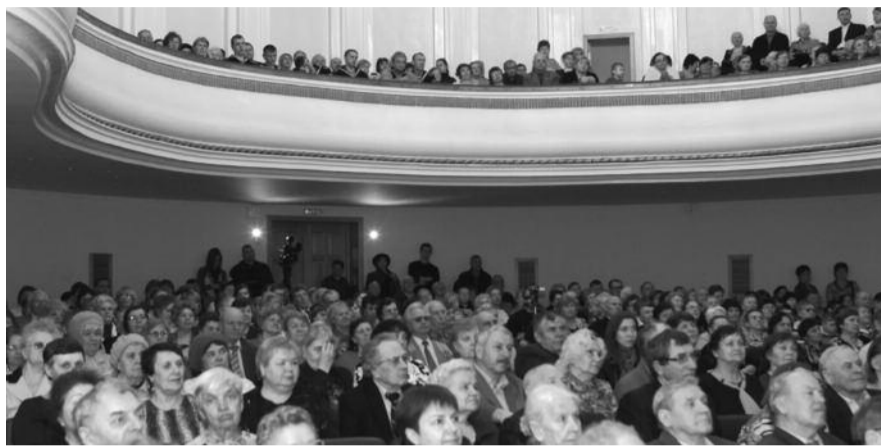
■ НА ФОТО: ЗАЛ ДОМА КУЛЬТУРЫ «ЭНЕРГИЯ» БЫЛ ПЕРЕПОЛНЕН

в 1960-1964 годах и был непосредственным участником тех великих событий.