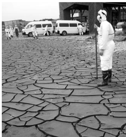
■ НА ФОТО: ЯПОНСКИЕ ПОЛИЦЕЙСКИЕ В ЗАЩИТНЫХ КОСТЮМАХ ОСМАТРИВАЮТ ТЕРРИТОРИЮ, В ТО ВРЕМЯ КАК ИХ КОЛЛЕГИ ГРУЗЯТ В ФУРГОН ТЕЛО ЖЕРТВЫ РАДИАЦИИ

Из Японии тем временем поступают сообщения о новых подземных толчках. Во вторник в 08:08 по местному времени в префектуре Фукусима было зафиксировано землетрясение магнитудой 6,3. Эпицентр находился в Тихом океане приблизительно в 80 км к востоку от Токио. Сообщений о жертвах и разрушениях не поступало. Предупреждение об угрозе цунами тоже не объявлялось. После зем-