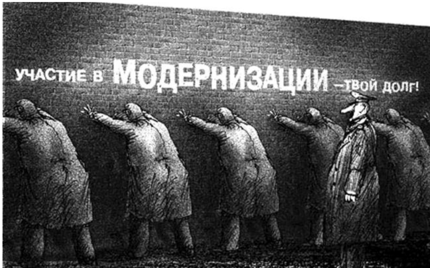
● НА РИС.: ДОБРОВОЛЬНО-ПРИНУДИТЕЛЬНАЯ МОДЕРНИЗАЦИЯ ПО-РОССИЙСКИ

ОТДАМ В ДОБРЫЕ РУКИ из-за болезни хозяйки: пострадавшую дворняжку (стерилизована); белого кота (1,5 года, приучен); черного котенка (2 месяца); рыжего пса-охранника. Тел. 334-60-43.