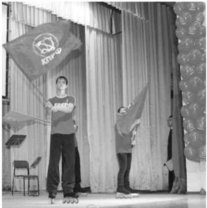
■ НА ФОТО: ВЫСТУПЛЕНИЕ РОЛЛЕРОВ