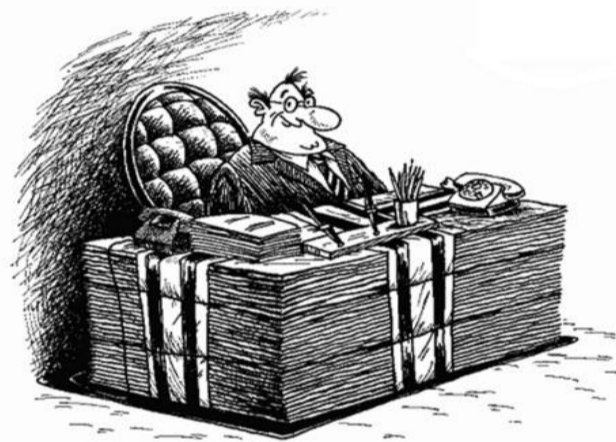
■ НА РИС.: РАБОЧЕЕ МЕСТО ЧИНОВНИКА КРАСИТ

А вот сотрудники кремлевской администрации намного богаче самого президента. Самый большой заработок за прошлый год в президентской администрации был у полпреда президента в Северо-Кавказском федеральном округе, вице-преьера Александра ХЛОПОНИНА — более 23 млн. руб. По сравнению с 2009 годом доходы полпреда уменьшились почти втрое, зато значительно выросли доходы у его супруги — с 13,7 млн. до 93 млн. руб. Все остальные полпреды живут скромнее — с заработком от 2,7 млн. руб. у Виктора ТОЛОКОНСКОГО, который большую часть 2010 года трудился губернатором Новосибирской области, до 7 млн. руб. у полпреда в Южном округе Владимира УСТИНОВА.