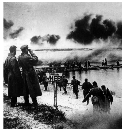
НА ФОТО: ФОРСИРОВАНИЕ ДНЕПРА