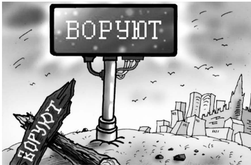
НА ФОТО: ИННОВАЦИИ НАЛИЦО

Сотрудники ФСБ в Новосибирской области раскрыли схему хищения средств из федерального бюджета со счетов регионального паевого инвестиционного фонда венчурных инвестиций, сообщает в пятницу пресс-служба управления ведомства по региону. В хищении 50 миллионов рублей подозревают руководителей ряда малых инновационных компаний Новосибирска.