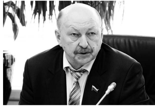
НА ФОТО: АЛЕКСАНДР АБАЛАКОВ

В адрес депутата Государственной думы от фракции КПРФ Александра АБАЛАКОВА обратилась с письмом инициативная группа граждан, которая требует заморозить тарифы ЖКХ на уровне 2014 года. На данный момент идет сбор подписей под этой петицией (собрано уже почти 1000 подписей). По мнению Александра Абалакова, любая из естественных монополий может понизить тарифы на 5-10% за счет повышения эффективности деятельности.