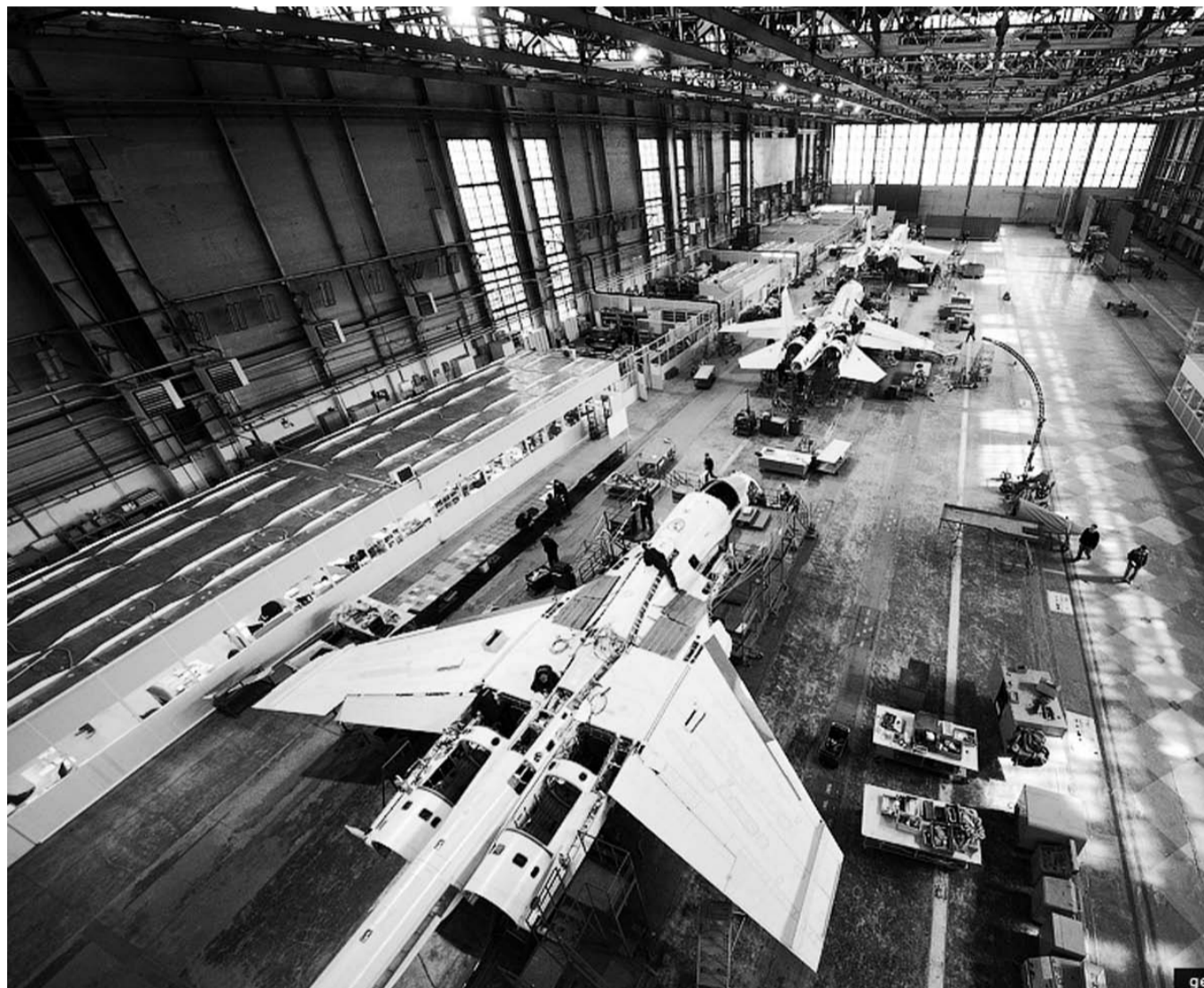
НА ФОТО: НОВОСИБИРСКАЯ ПРОМЫШЛЕННОСТЬ НА ПОРОГЕ НОВОЙ ИНДУСТРИАЛИЗАЦИИ