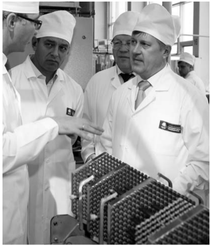
НА ФОТО: АНАТОЛИЙ ЛОКОТЬ НА НЭХК

— Новые условия диктуют совершенно другие реалии, прежде всего — отказ от сырьевой модели экономики России. Новосибирск объективно находится в выигрышном положении, у нас сильная научно-технологическая база, промышленная база, относи-