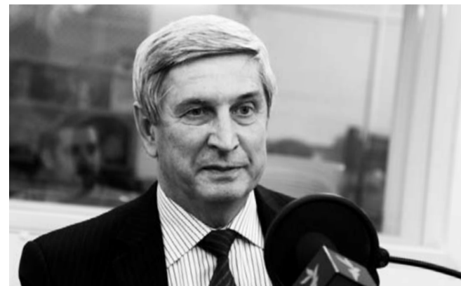
НА ФОТО: ИВАН МЕЛЬНИКОВ

КПРФ проанализирует задачи партии на мартовском пленуме с учетом того, что современные события в стране напоминают обстановку в России в начале XX века, заявил первый зампред ЦК КПРФ, первый вице-спикер Госдумы Иван МЕЛЬНИКОВ .