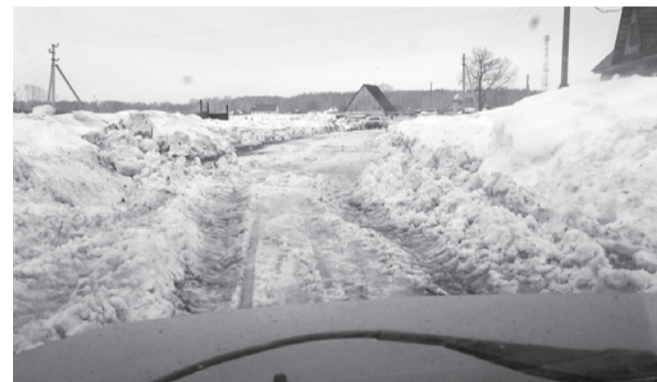
НА ФОТО: НЕТ ДОРОГИ, ТОЛЬКО НАПРАВЛЕНИЕ

Жители села Локти Мошковского района, большинство из которых вынуждены работать в Новосибирске, стали заложниками погодных условий. В снегопад зимой и в весеннюю распутицу выезд за пределы села превращается для многих из них в настоящее испытание.