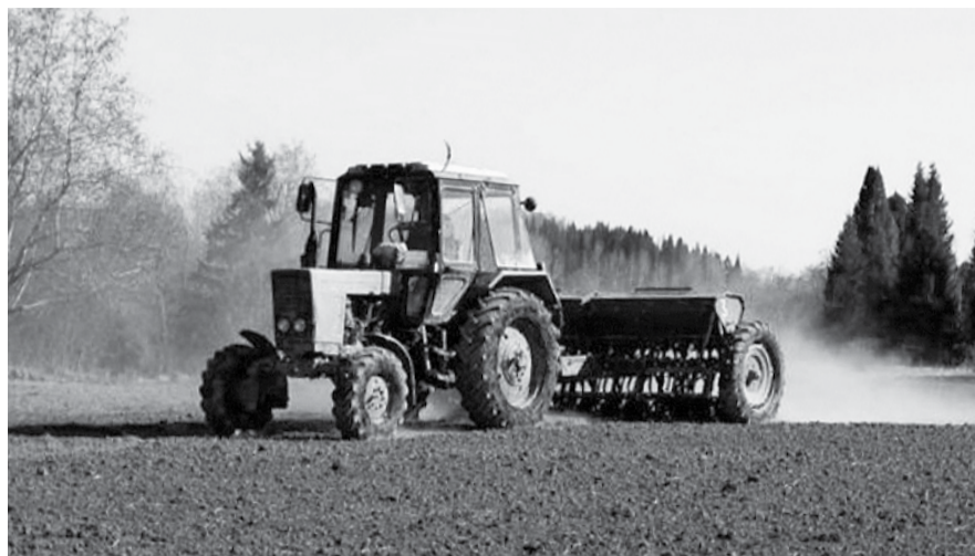
НА ФОТО: БЛИЗИТСЯ ПОСЕВНАЯ. НАСКОЛЬКО ОНА СТАНЕТ ДОРОЖЕ?

— Во-первых, предстоят затраты на семена, потому что семена есть не у всех, а покупные — явно дороги. Но мы надеемся, что обещания властей будут выполнены, и часть затрат на семена погасится субсидиями. Очень дорогие запасные части. Если ГСМ пока подорожали незначительно, то запасные части — наоборот. А в хозяйствах, где используется импортная техника, так вообще приходится приобретать запчасти, да и саму технику, по заоблачным ценам. Может, в нашей зоне импортную технику мало кто будет закупать, но даже и отечественная требует затрат — то же техническое об-