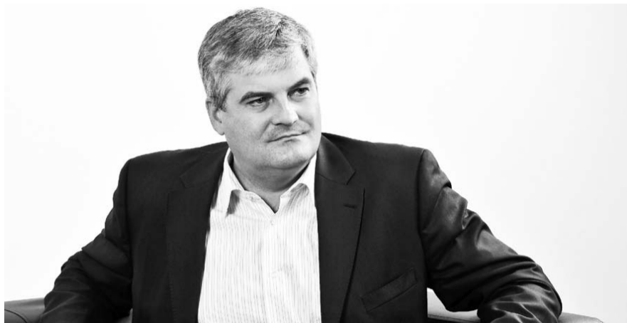
НА ФОТО: ВЯЧЕСЛАВ ИЛЮХИН

Стало очевидным: необходимо что-то менять, поэтому я и несколько моих коллег предприняли эту попытку... Но, как оказалось, большинство ничего менять не хотело.... Областная власть