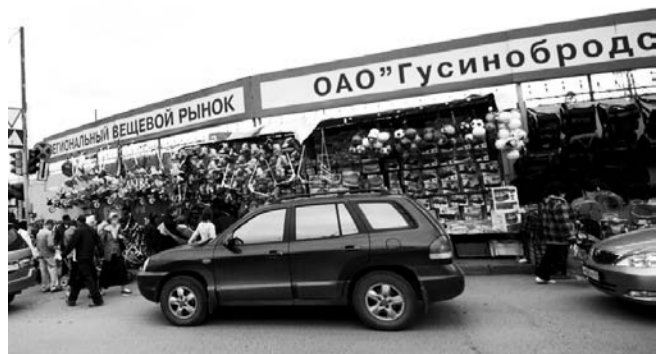
НА ФОТО: «БАРАХОЛКА» СКОРО ЗАКРОЕТСЯ