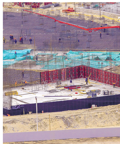
НА ФОТО: ГЛАВНАЯ СТРОЙКА ГОРОДА

В мае 2019 года Анатолий ЛОКОТ представил макет транспортной развязки и станции «Спортивная», которые должны быть построены для