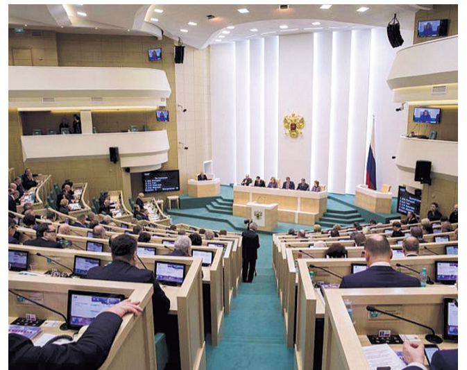
НА ФОТО: В ГОСУДАРСТВЕННОЙ ДУМЕ ВО ВРЕМЯ ГОЛОСОВАНИЯ

С Дмитрием Новиковым согласен и второй секретарь Новосибирского обкома КПРФ Ренат СУЛЕЙМАНОВ , который считает, что, к сожалению, избирательная система в России такова, что все меньше люди доверяют но-