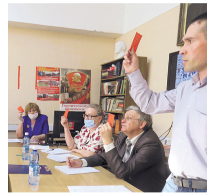
НА ФОТО: В ЗАВЕЛЬЦОВСКОМ РАЙКОМЕ

Завельцовский райком КПРФ — это шесть первичных отделений. В отчетный период продолжился рост партийных рядов, что показывает эффективность работы завельцовских коммунистов. Важным событием стало создание летом 2018 года Завельцовского отделения ЛКСМ РФ, райком «омолодился» — средний возраст составил 40 лет.