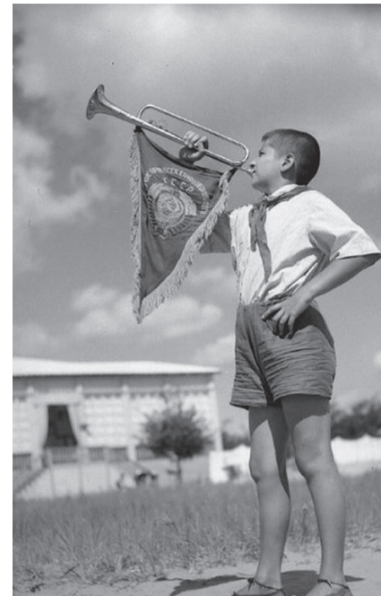
НА ФОТО: ПИОНЕР ВСЕГДА ГОТОВ!

— Дорогие друзья, пионеры всех поколений! Позвольте поздравить вас с замечательным, светлым праздником — Днем рождения Всесоюзной пионерской организации имени Владимира Ильича Ленина!