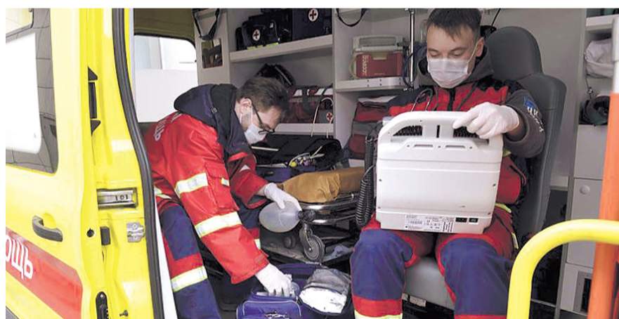
НА ФОТО: ДЕНЕЖНЫЕ ВЫПЛАТЫ ПОКА ТОЛЬКО НА БУМАГЕ

Медики НСО не полностью получили обещанные им надбавки. За две рабочих недели с больными коронавирусом пациентами им пообещали денежные выплаты до 60 тысяч рублей, но по факту кому-то дошло две тысячи, а кому-то и вовсе 57 рублей. Видеообращения о «смешных» надбавках приходят от сотрудников скорой медицинской помощи со всей страны. Доплаты рассчитывались в зависимости от количества времени, проведенного с больным пациентом. Средняя сумма за час работы в НСО составила около 75 рублей. После резонанса в средствах массовой информации корректность стимулирующих выплат начали проверять по всей стране. Генпрокуратура уже нашла нарушения при выплате надбавки медикам, работающим с Covid-19 в НСО. Меры прокурорского реагирования с учетом выявленных нарушений приняты, в частности, в Самарской, Новосибирской, Мурманской, Владимирской, Орловской, Иркутской, Курской, Белгородской, Нижегородской, Челябинской областях, Краснодарском, Пермском краях и ряде других регионов, — говорится в сообщении.