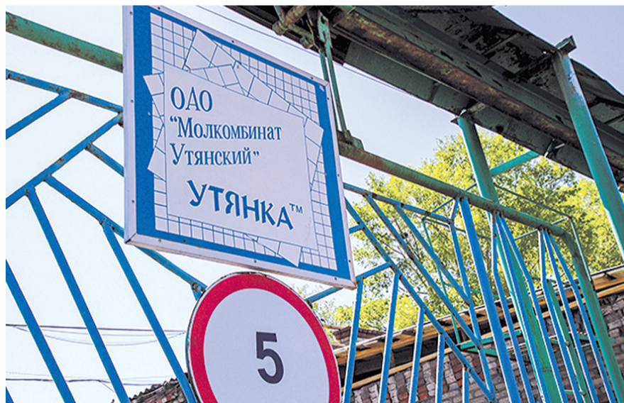
НА ФОТО: ПРЕДПРИЯТИЕ НА КРАЮ ФИНАНСОВОГО КРАХА

Временным управляющим назначен член Ассоциации «Урало-Сибирское объединение арбитражных управля-