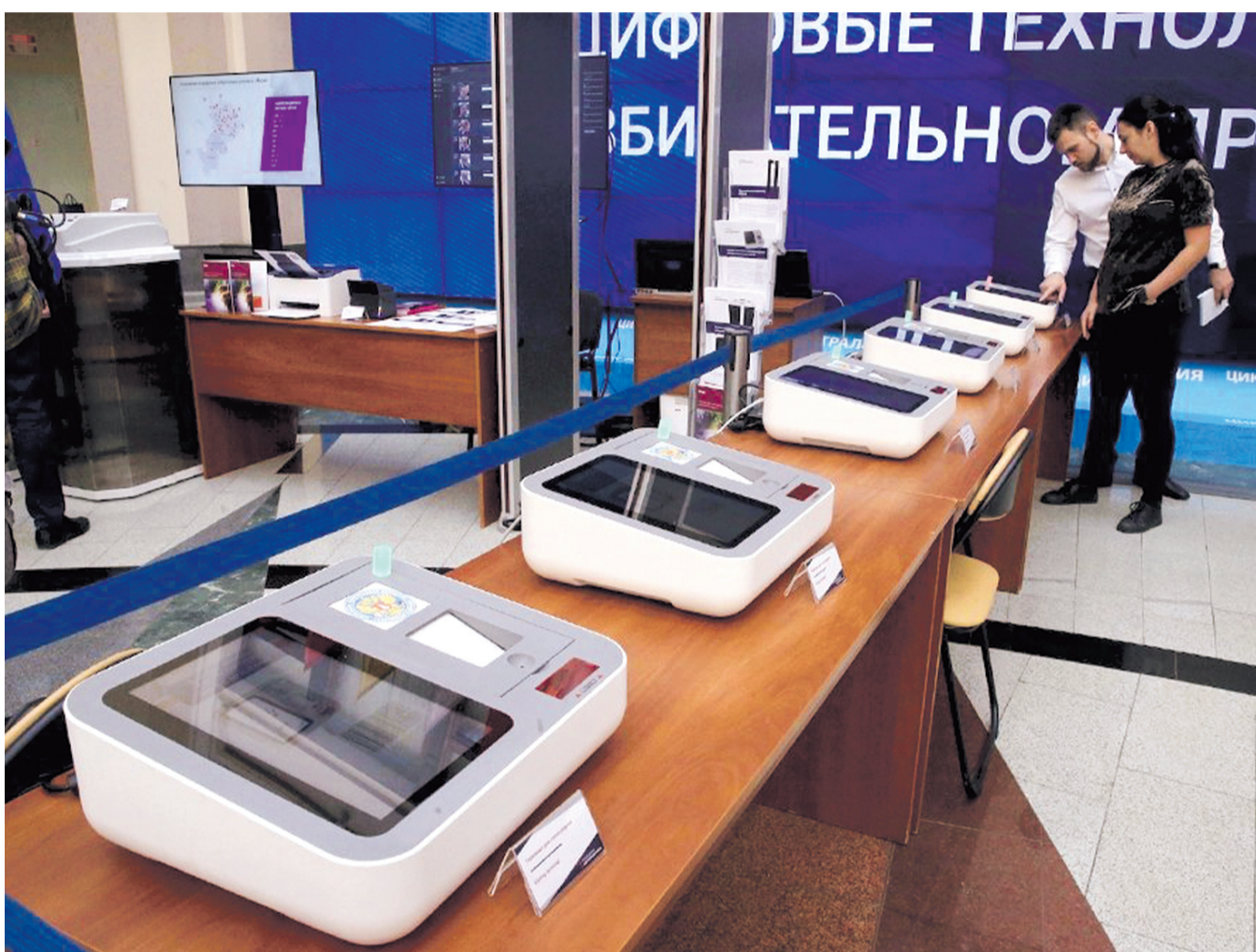
НА ФОТО: КОГДА ПРОГРЕСС И НОВЫЕ ТЕХНОЛОГИИ НЕ БЛАГО, А СПОСОБ ОБМАНА