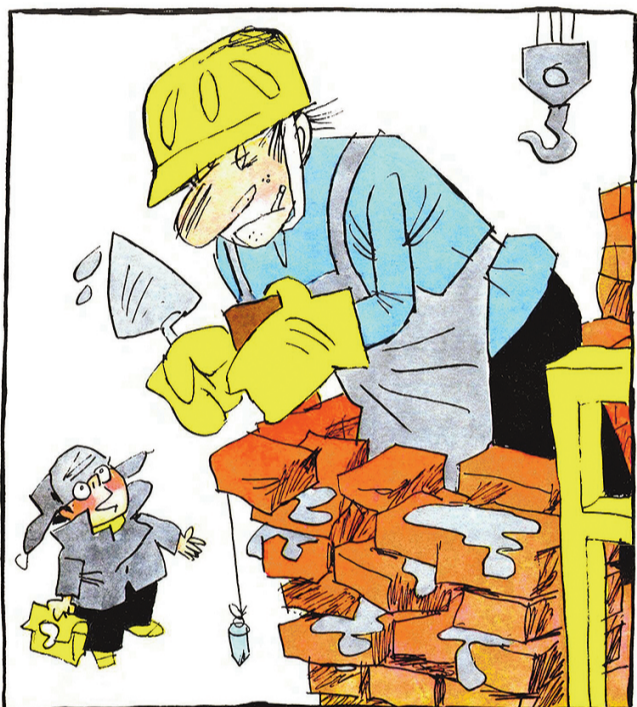
— Дяденька, а почему вы в перчатках работаете? Чтобы не узнали по отпечаткам пальцев, кто этот дом строил?