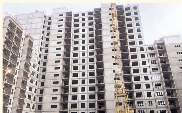
НА ФОТО: ДОЛГОСТРОЙ НА ЛЕНИНГРАДСКОЙ