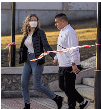
НА ФОТО: РЕЖИМ ИЗОЛЯЦИИ СОХРАНЯЕТСЯ

Стойкость и выдержку городская администрация проявила и в помощи здравоохранению. В Новосибирске военные достроили госпиталь для борьбы с коронавирусом. Он находится на территории военной части в Октябрьском районе. Стационар рассчитан на 160 больных: учреждение предназначено как для военных, так и для обычных новосибирцев.