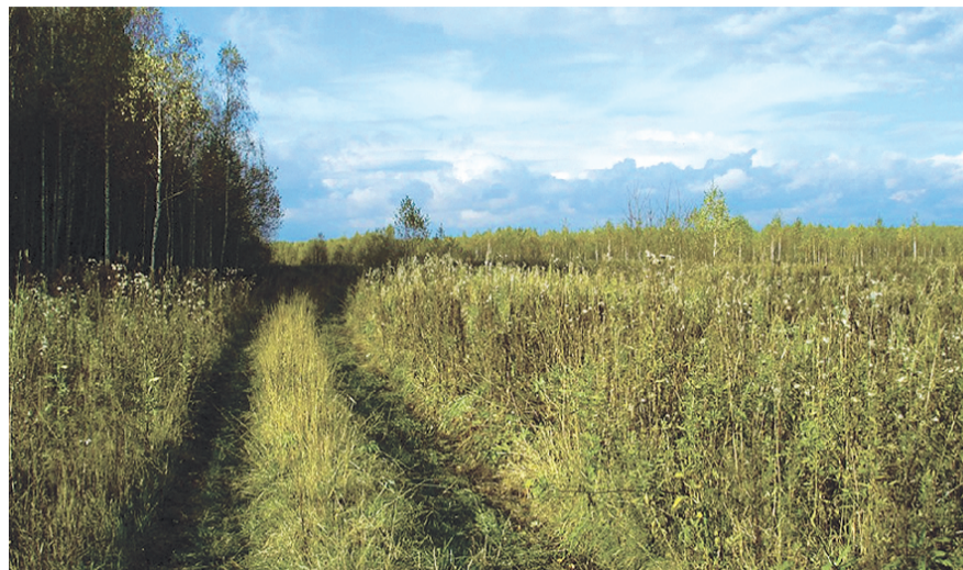
НА ФОТО: ПАХОТНЫЕ ЗЕМЛИ ЗАРАСТАЮТ БУРЬЯНОМ

— Еще более плачевная. Район остается на позициях отсталого, поголовье скота катастрофически упало, и надеяться на то, что оно будет прирастать, нет оснований. Рост цен на зерно, выгодный растениеводам, повышает затраты на производство продукции животноводства. Находить баланс не