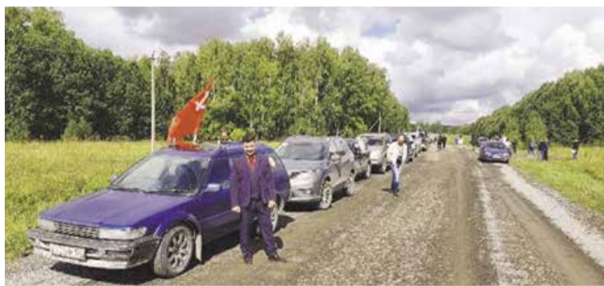
НА ФОТО: СТАРТ АВТОПРОБЕГА ПРОШЕЛ НА МЕСТЕ ПРЕДПОЛАГАЕМОГО СТРОИТЕЛЬСТВА ПОЛИГОНА

Действительно, Плотниковский сельсовет расположен на границе Новосибирского и Тогучинского районов, это территория, хорошо известная новосибирским дачни-