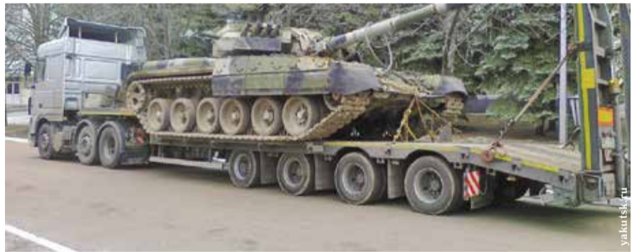
НА ФОТО: СЕРБИЯ СТЫГИВАЕТ НА ГРАНИЦУ С КОСОВО ВОЕННУЮ ТЕХНИКУ