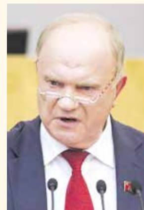
НА ФОТО: ПРЕДСЕДАТЕЛЬ ЦК КПРФ ГЕННАДИЙ ЗЮГАНОВ

С праздником! С Днём сослуживца — сотоварища по службе Родине! С Днём Советской Армии и Военно-морского флота! С Днём защитника Отечества!