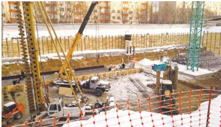
НА ФОТО: СТРОЙКИ ГК «РАСЦВЕТАЙ» РАЗВЕРНУТЫ ПО ВСЕМУ НОВОСИБИРСКУ