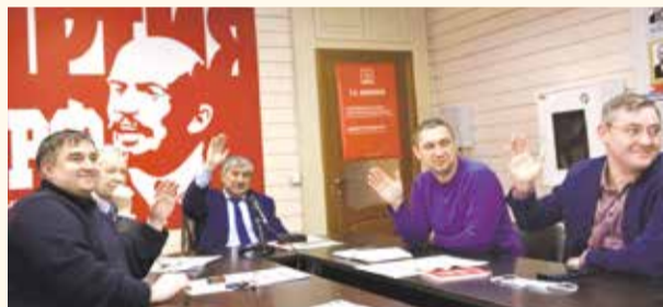
НА ФОТО: ЧЛЕНЫ НОВОСИБИРСКОГО ОБКОМА УЧАСТВУЮТ В КОНФЕРЕНЦИИ

— Тем не менее граждане нашей великой страны подтвердили волю жить в едином государстве. Пришли 80% избирателей и 76% из них проголосовали «за». Несмотря на протест националистических руководителей некоторых республик, трудовой народ пришел на референдум — даже в Прибалтике. Закавказье, Средняя Азия, Украина, Белоруссия — все поддержали Советский Союз. Против был только Свердловск, вотчина Ельцина. Его русофобская команда в Москве продолжала свою разрушительную политику.