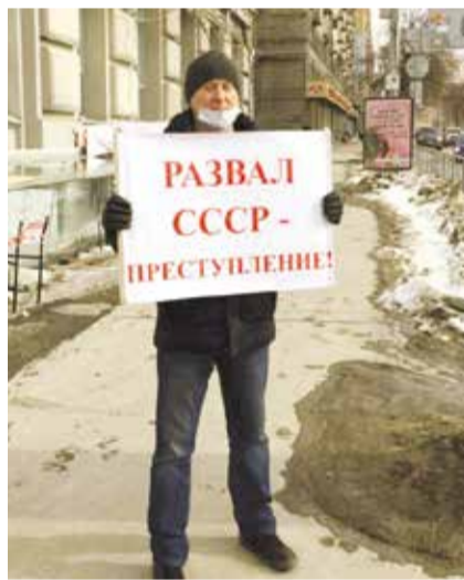
НА ФОТО: ПИКЕТ В КАЛИНИНСКОМ РАЙОНЕ