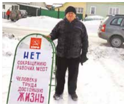
НА ФОТО: ПИКЕТ В ВЕНГЕРОВО