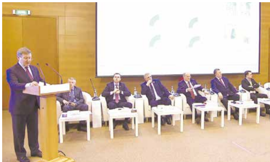
НА ФОТО: ВЫСТУПЛЕНИЕ МЭРА НОВОСИБИРСКА АНАТОЛИЯ ЛОКТИ

Мэр отметил, что у нацпроекта есть и обратная сторона. Программа