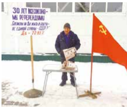
НА ФОТО: ПИКЕТ В МОШКОВО