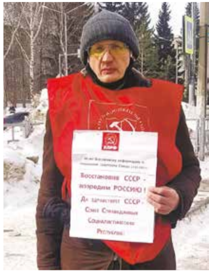
НА ФОТО: ПИКЕТ В БЕРДСКЕ

30 лет назад, несмотря на то, что Советский Союз еще существовал, антикоммунистическая пропаганда уже не останавливалась со страниц печатных изданий и телеэкранов. «Раскрестьянивание», «большевики уничтожили русское крестьянство», «сельское хозяйство спасет эффективный собственник» — такими были расхожие штампы того времени. Но прошли годы, и оказалось, что именно «рыночек» стал настоящим бичом сельского образа жизни. Так, в Новосибирской области только с 1990 по 2015 годы сельское население сократилось на 15,6% — на 109,5 тысяч человек, за это время было закрыто 511 школ. Если в 1990 году отставание в зарплате между городом