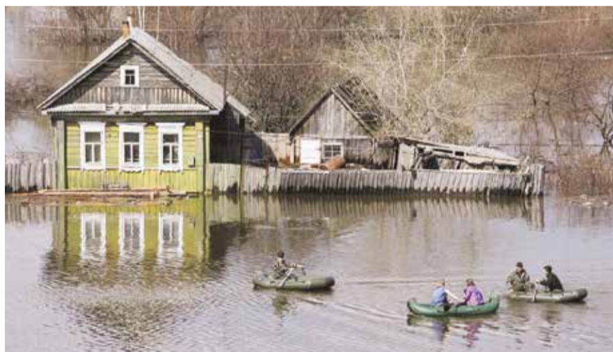
НА ФОТО: В ЗОНЕ ПОДТОПЛЕНИЯ В ЭТОМ ГОДУ 3,6 ТЫСЯЧИ ДОМОВ

Областные власти развернули противоподаковые мероприятия: