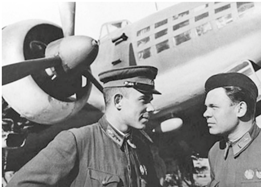
НА ФОТО: АЛЕКСЕЙ ГАРАНИН (СЛЕВА)

28 марта исполняется 100 лет со дня рождения Героя Советского Союза Алексея Гаранина, чьим именем названа улица в Октябрьском районе. Как и Александр Покрышкин, он был летчиком, но не истребителем, а бомбардировщиком.