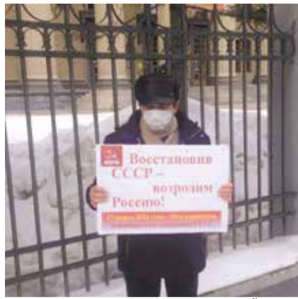
НА ФОТО: ПИКЕТ В ЗАЕЛЬЦОВСКОМ РАЙОНЕ

В Советском районе пикеты, в частности, прошли в рабочем микрорайоне ОбьГЭС, где местные жители до сих пор хранят память о трудовых подвигах при строительстве гидроэлектростанции. Раздавались листовки, наглядно