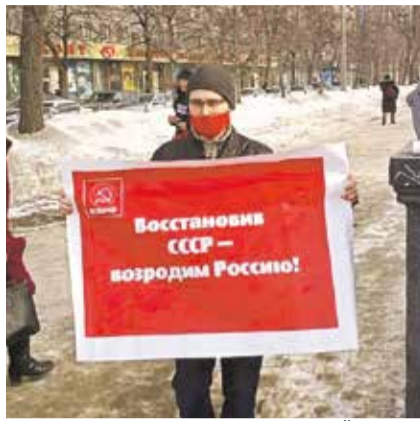
НА ФОТО: ПИКЕТ В ЦЕНТРАЛЬНОМ РАЙОНЕ