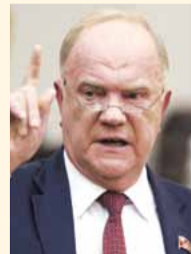
НА ФОТО: ПРЕДСЕДАТЕЛЬ ЦК КПРФ ГЕННАДИЙ ЗЮГАНОВ