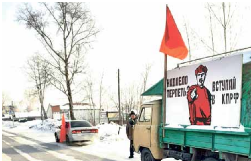
НА ФОТО: ПРАЗДНИЧНЫЙ АВТОПРОБЕГ В КРАСНОЗЕРКЕ

На прошлой неделе по всей стране отмечалась важная дата — 103 года со дня создания Красной армии. Несмотря на пандемию и 30-градусные морозы в Новосибирской области прошли возложения цветов и красные автопробеги.