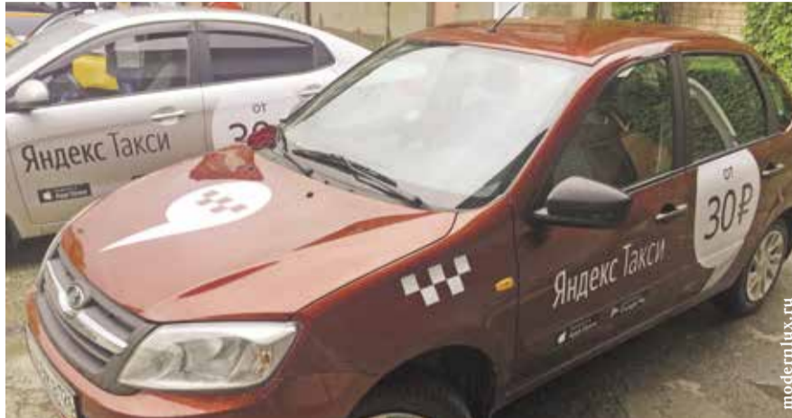
НА ФОТО: ВЫЗОВ ТАКСИ ЧЕРЕЗ МОБИЛЬНОЕ ПРИЛОЖЕНИЕ УЙДЕТ В ПРОШЛОЕ?

Жители крупных городов давно привыкли к услугам такси. Это быстро, удобно и безопасно.