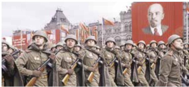
НА ФОТО: ВКЛАД КРАСНОЙ АРМИИ В ПОБЕДУ НАД НАЦИЗМОМ ДОЛЖЕН БЫТЬ ОЧЕВИДЕН ВСЕМ

Совет Федерации одобрил закон о штрафе или административном аресте за публичное отождествление роли СССР и нацистской Германии во Второй мировой войне.