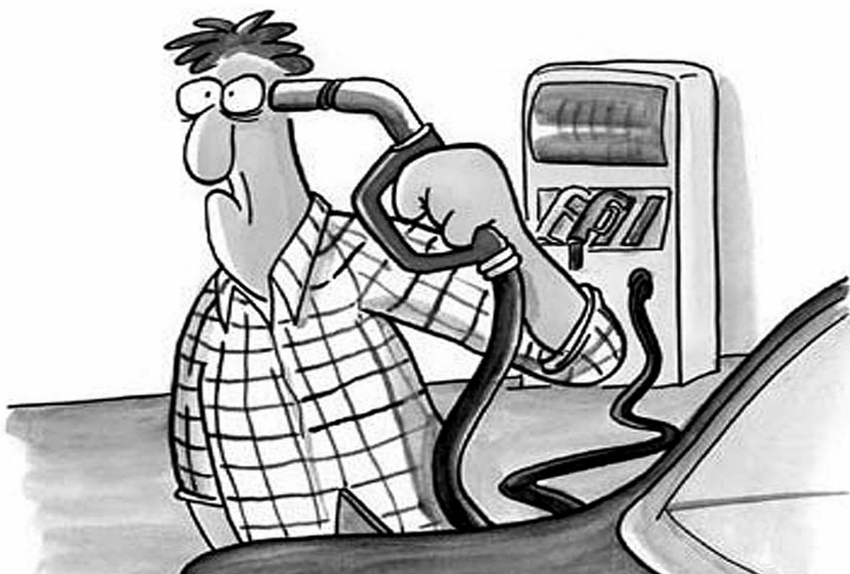
● НА ФОТО: ЦЕНЫ — ХОТЬ СТРЕЛЯЙСЯ