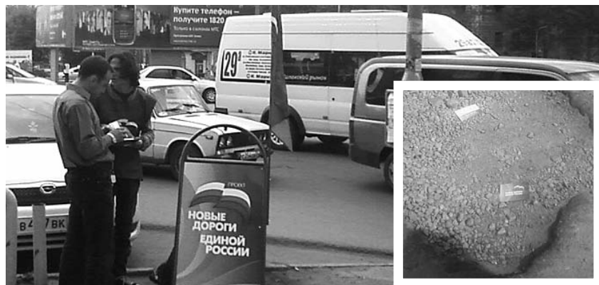
● НА ФОТО: В ПРОЕКТЫ «ЕДИНОЙ РОССИИ» УЖЕ НЕ ВЕРЯТ

Проект «Новые дороги «Единой России» создан для исправления имиджа партии власти. Напомним, что дороги Новосибирска, которым руководят представители «ЕР», были признаны худшими в России еще два года назад. На сего-