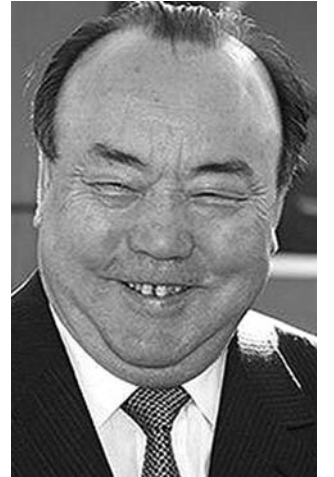
● НА ФОТО: СЧАСТЛИВЫЙ ОТСТАВНИК МУРТАЗА РАХИМОВ

Российские главы регионов перед уходом в отставку законодательно гарантируют себе безбедную жизнь. Если экс-президенту Башкирии Муртазе РАХИМОВУ курултай «подарил» неподсудность, гигантскую пенсию и пару президентских дворцов прямо в день отставки, то другие «наместники» делают это заранее. Карельский экс-губернатор КАТАНАНДОВ заготовил закон о 80%-й пенсии от зарплаты главы администрации за несколько лет до отставки. Закон о гарантиях для главы Татарстана ШАЙМИЕВА был принят еще в 2006 году. Эксперты отмечают, что готовиться к «достойной политической старости» губернаторы начали после отмены выборов глав регионов.