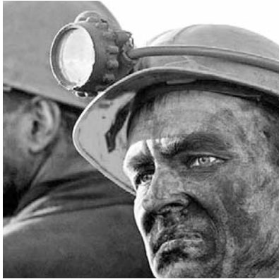
● НА ФОТО: КТО ОТВЕТИТ?

Два взрыва, прогремевших на шахте «Распадская» в ночь с 8 на 9 мая, унесли жизни 67 человек, а 23 до сих пор не найдены под завалами, образовавшимися после взрывов, и считаются пропавшими без вести. Ростехнадзор подготовил список виновных в аварии, но никого из владельцев ОАО «Распадская» в нем нет.