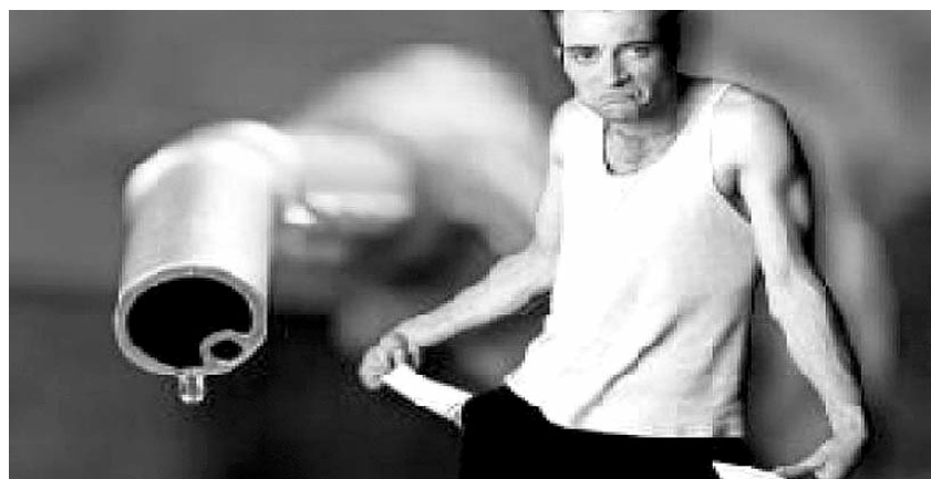
● НА ФОТО: АВТОМОБИЛЬ НЕ РОСКОШЬ?

Особенно интересно выглядит решение правительства ПУТИНА по увеличению