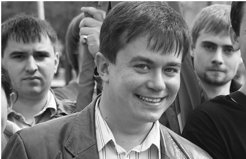
● НА ФОТО: КПРФ — ПАРТИЯ БУДУЩЕГО!

— Это было в феврале 1999 года. В Государственной думе тогда проходила процедура импичмента Бориса Ельцина. И президентское окружение, в первую очередь, господин БЕРЕЗОВСКИЙ рассматривало все варианты борьбы с коммунистами. Например, запрет нашей партии. Об этом прямо говорилось с телеэкранов, как и о том, что нужно забить последний гвоздь в крышку гроба КПРФ. В очень непростой ситуации я понял, что происходящее в России мне безразлично, и я должен быть с коммунистами. Мне было 24 года. Я работал журналистом в газете «Советская Сибирь» и освещал деятельность коммунистов в городском Совете. Видел, как они защищают интересы горожан, борются с чиновника-