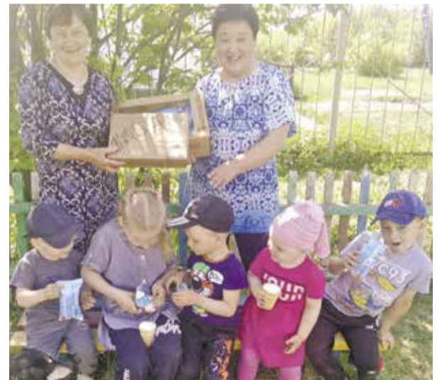
НА ФОТО: КОММУНИСТЫ С. ЗЛАТОУСТ (ТОГУЧИНСКИЙ РАЙОН) ОРГАНИЗОВАЛИ ПРАЗДНИК ДЛЯ МЕСТНЫХ ДЕТЕЙ

В Центральном районе в этот день провели прием в пионеры в сквере Героев Революции. В течение десятилетия ребята давали клятву в этом месте, где похоронили первых борцов за власть Советов в городе, что придавало церемонии особый, торжественный характер. Теперь традиция возобновлена.